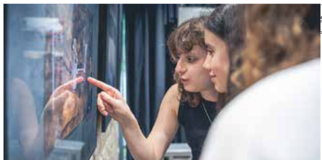
Wystawa wzbudza zainteresowanie nie tylko młodych ludzi.