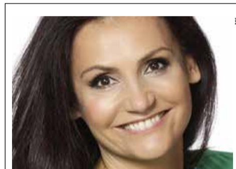
27 maja godz. 18: TURY KULTURY – SPOTKANIE Z AKTORKĄ MAŁGORZATĄ PIECZYŃSKĄ, MEDIATEKA

godz. 17 – ŚWIĘTO OSIEDLA „A”: Osiedle A w technice sgraffito – warsztaty dla najmłodszych (Niezależny Instytut Kultury, Pl. św. Anny 7b)