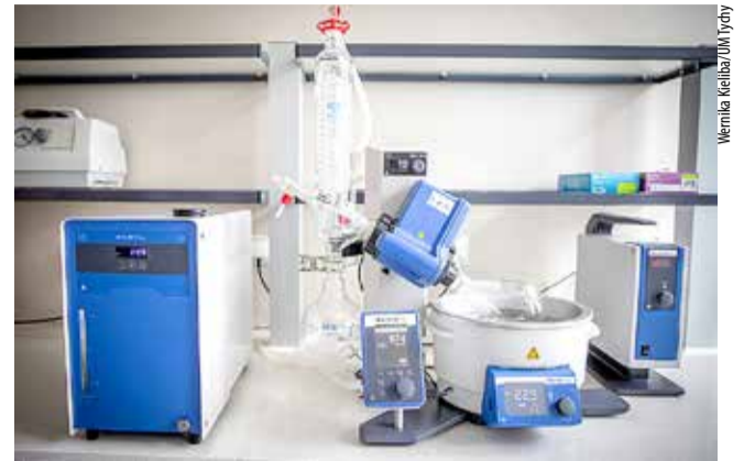
Centrum Badawczo-Rozwojowe wyposażone jest w nowoczesny sprzęt, służący ochronie środowiska.

W ramach inwestycji powstał nowoczesny budynek centrum badawczo-rozwojowego wraz ze specjalistycznym wyposażeniem laboratoryjnym. Obiekt ma służyć prowadzeniu badań i wdrażaniu technologii związanych m.in. z gospodarką o obiegu zamkniętym, ochroną zasobów wodnych, ograniczaniem emisji oraz rozwiązaniami energetycznymi opartymi na odnawialnych źródłach energii.