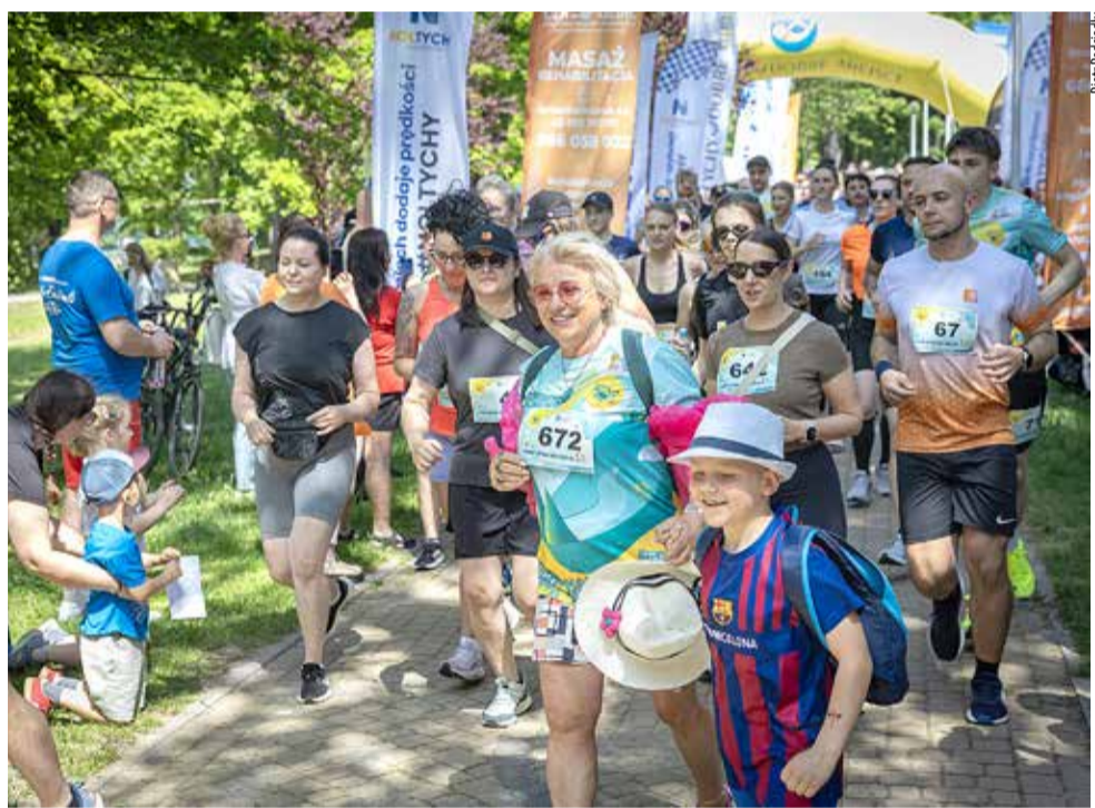
Na starcie stanęły tłumy biegaczy w najróżniejszym wieku.