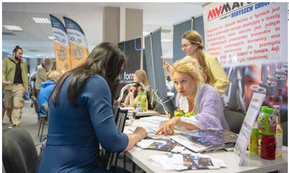
Odwiedzający targi mogli liczyć na wyczerpujące informacje ze strony potencjalnych pracodawców.

W organizację wydarzenia zaangażowali się przedstawiciele m.in. Powiatowego Urzędu Pracy w Tychach, Młodzieżowego Centrum Kariery, Zakładu Ubezpieczeń Społecznych, Urzędu Skarbowego oraz Wydziału Ewidencji Działalności Gospodarczej Urzędu Miasta Tychy. MN