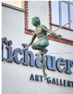
Jeden z balansjerów przy Tichauer Art. Gallery.