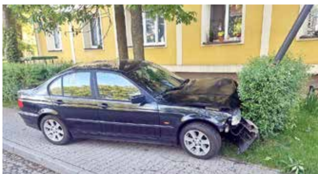
BMW na latarni przy ul. Czeresniowej.

◆ W CZWARTEK, 21 MAJA PRZED GODZ. 15 strażacy interweniowali przy pożarze komórki lokatorskiej w budynku wielorodzinnym przy ul. Dąbrowskiego. Dzięki szybkiej reakcji mieszkańców i sprawnym działaniom służb ogień nie rozprzestrzenił się na pozostałą część budynku. Na miejsce skierowano cztery zastępy strażaków oraz patrol prewencji policji. Ogień objął materiały znajdujące się w jednej z komórek lokatorskich w piwnicy budynku. Jak wynika z nieoficjalnych informacji, do pożaru mogło dojść podczas ładowania baterii do hulajnogi lub roweru elektrycznego.