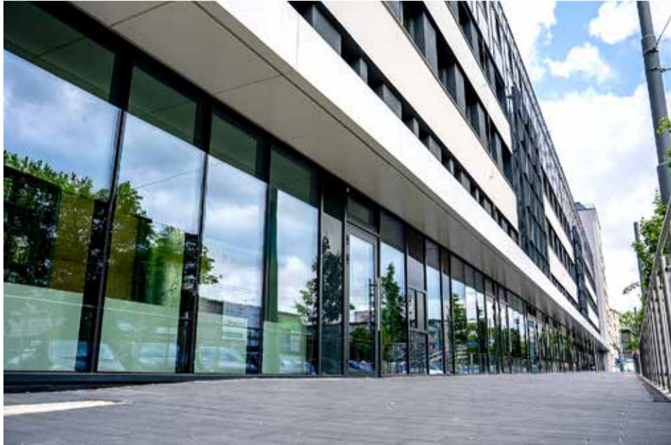
Lokale usługowe w części parterowej zyskały jednolity, estetyczny wygląd i są bardziej dostępne dla klientów.

MODERNIZACJA BUDYNKU TTBS PRZY UL. GROTA-ROWECKIEGO NA FINISZU.