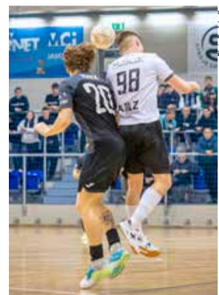
GKS Futsal Tychy musi teraz liczyć nie tylko na siebie, ale i na potknięcia rywali.