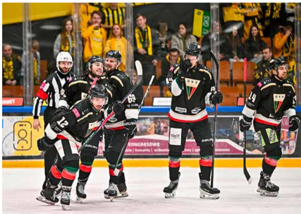
Ile meczów będzie trzeba, by wyłonić mistrza Polski sezonu 2025/26? Na razie bliżej tytułu jest GKS Tychy.

Drugi mecz finałowy: GKS KATOWICE – GKS TYCHY 0:1 (0:1, 0:0, 0:0). Gol dla Tyszan: Heljanko (16'). NS ●