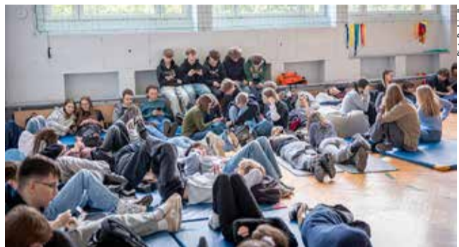
Odpoczynek i regeneracja był jednym z tematów Dni Zdrowia Psychicznego w „Kruczku”.

Aby skorzystać z transportu na zlecenie wystarczy telefon lub SMS.