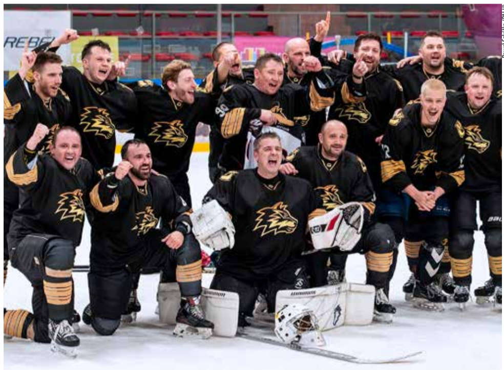
Zespół Tychy Wolves obronił mistrzostwo PALH sprzed roku.

Mistrzostwa Polski Amatorów Dywizji 1 (elita) odbędą się w Oświęcimiu w dniach 23-26.04.2026. W turnieju zagrają dwie tyskie ekipy: Tychy Wolves (brązowi medalisci 2025) oraz Tychy Knights. SSK ●