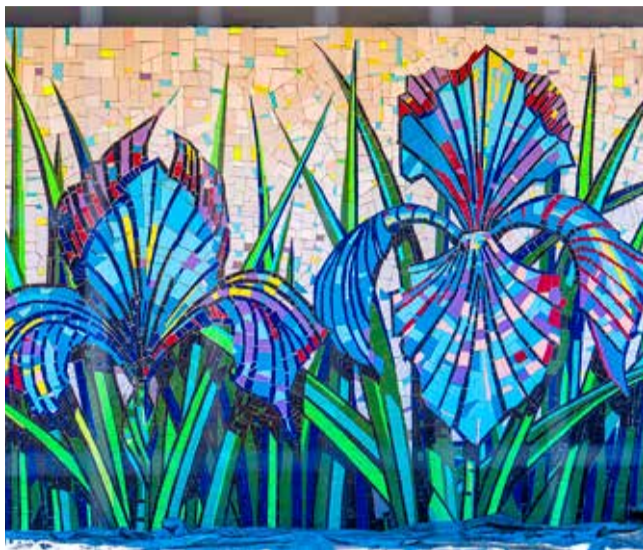
Mozaika prezentuje się bardzo okazale.

Samo wykonanie okazało się czasochłonne. Każda płytki została ręcznie przycięta szlifierką z diamentowym ostrzem, by idealnie dopasować ją do projektu. – Tworzenie mozaiki to w pewnym sensie malowanie ceramiką – tłumaczy artysta.