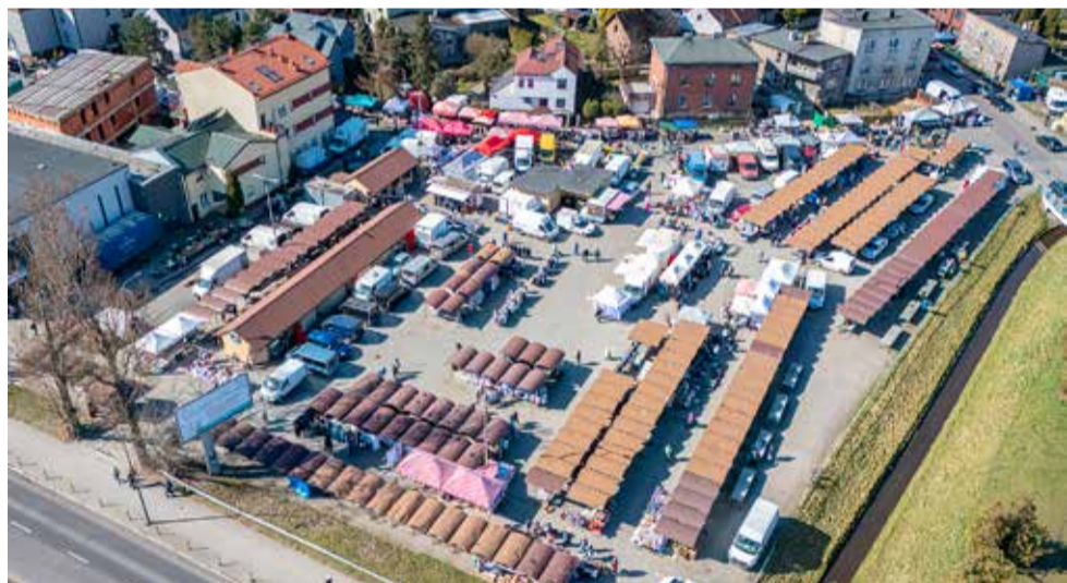
Plac targowy przy Al. Bielskiej nie straci po modernizacji swojego charakteru; będzie tylko bezpieczniej i ładniej.