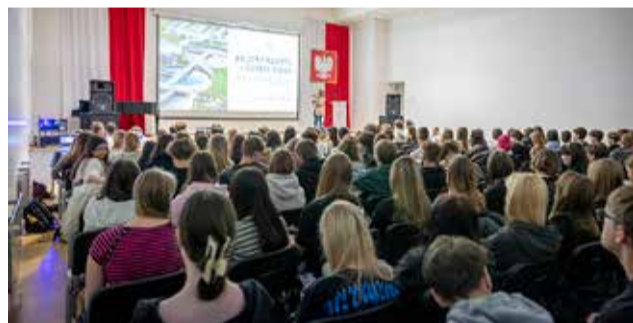
Podczas obchodów Światowego Dnia Wody aula ZS nr 1 była pełna młodych ludzi.

Istotnym elementem badań była także analiza obecności mikroplastiku w wodzie.