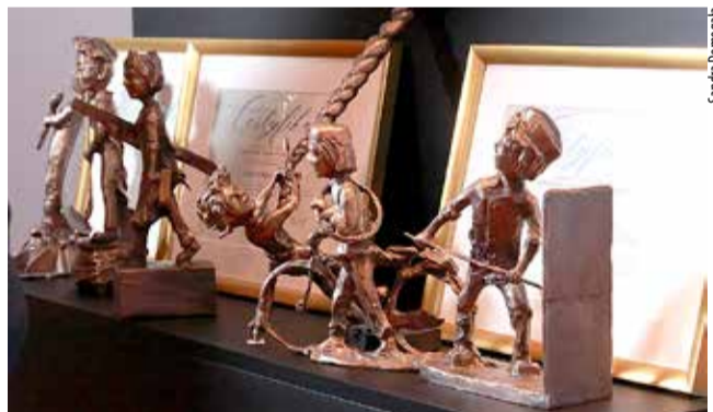
Pierwsze tyskie Terminki.

POZNAJ TYSKICH RZEMIEŚLNIKÓW W 70. ROCZNICĘ ISTNIENIA CECHU