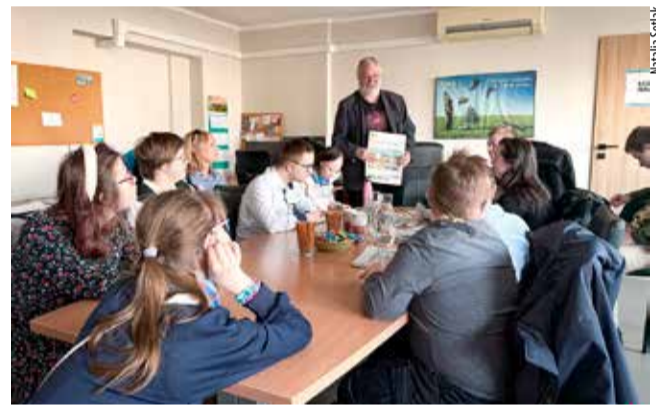
Goście w trakcie wizyty w „Twoich Tychach”.