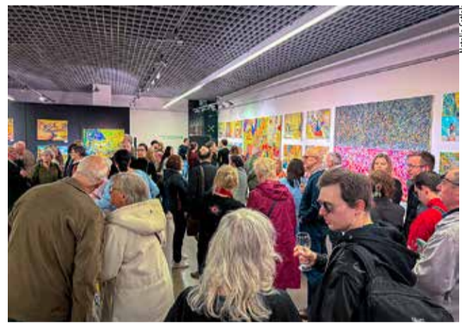
Wernisaż wystawy w galerii „Obok” cieszył się sporym zainteresowaniem.

Ekspozycję „A jeżeli to wszystko jest tylko snem” można oglądać w Miejskiej Galerii Sztuki OBOK w Tychach do 22 kwietnia 2026 roku. NS ●