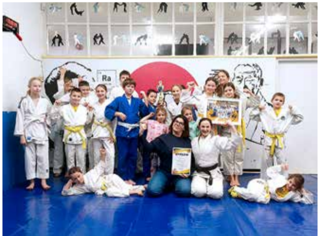
Zawodniczki i zawodnicy KS Polon mogą poszczycić się wieloma sportowymi osiągnięciami.