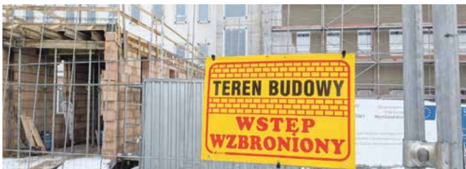
Prace w Zakładzie Opiekuńczo-Lecznicy...