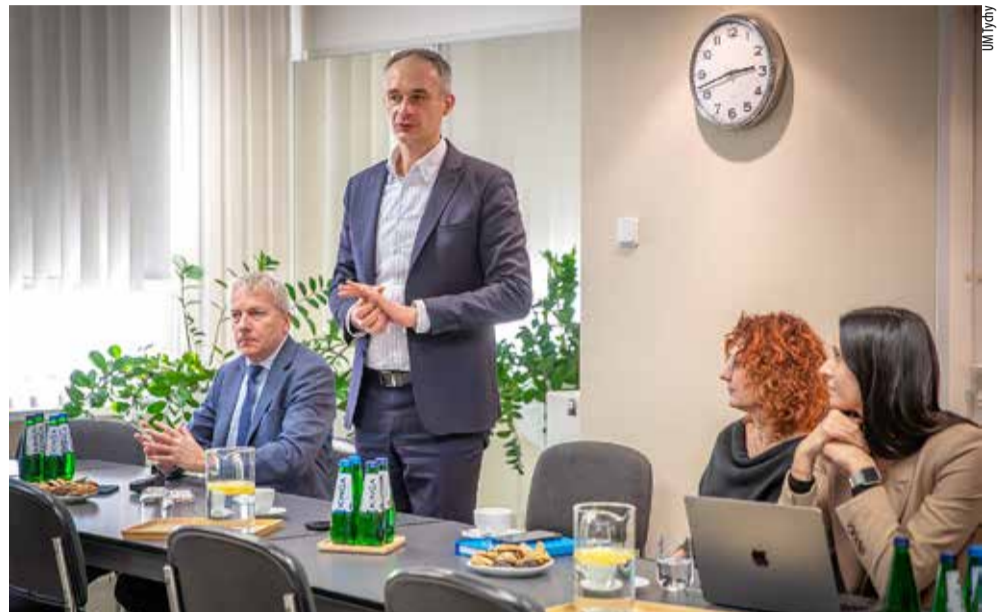
Z reprezentantami firmy Stellantis spotkali się m.in. przedstawiciele wojewódzkiego i miejskiego samorządów.

SPOTKANIE W URZĘDZIE MIASTA W SPRAWIE SYTUACJI W TYSKIEJ FABRYCE STELLANTIS.