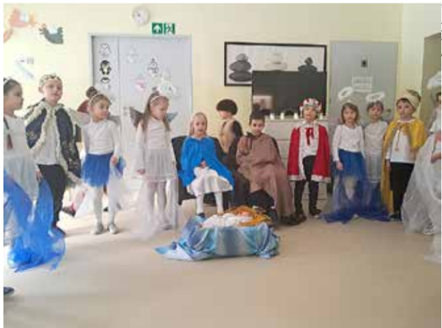
Przedszkolaki zaprezentowały pensjonariuszom DPS „Wrzos” widowisko jasełkowe. RN ●

Tymczasem 22 stycznia przedszkolaki z tej placówki wybrały się z wizytą do seniorów z Domu Pomocy Społecznej „Wrzos”, gdzie w ramach międzypokoleniowej integracji zaprezentowały jasełka, a w podziękę zostały poczęstowane herbatą i słodkościami. Świąteczna inscenizacja wywołała wzruszenie wielu podopiecznych DPS „Wrzos” i została bardzo ciepło przyjęta. RN ●