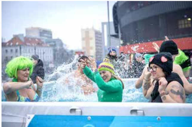
Woda zimna, ale serca gorące – jak zwykle podczas finału musiało być morsowanie!

W TYM ROKU WYDARZENIE ODBYŁO SIĘ W ZUPEŁNIE NOWYM MIEJSCU. NIE NA PLACU BACZYŃSKIEGO, JAK W POPRZEDNICH LATACH, A POD STADIONEM MIEJSKIM. PRZEZ CAŁY DZIEŃ NA MIESZKAŃCÓW CZEKAŁO MNÓSTWO ATRAKCJI. ZEBRANE PIENIĄDZE PODCZAS TEGOROCZNEGO FINAŁU ZOSTANĄ PRZEZNACZONE NA DIAGNOSTYKĘ I LECZENIE CHOROBY PRZEWODU POKARMOWEGO U NAJMŁODSZYCH PACJENTÓW.