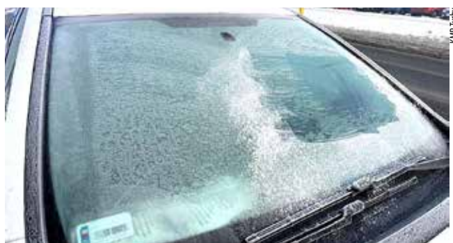
Tak nie wygląda gotowy do jazdy samochód.

◆ TEGO SAMEGO DNIA, DZIĘKI DOBREJ WSPÓŁPRACY POLICJANTÓW rewiru dzielnicowych tyskiej komendy z mieszkańcami, doszło do zatrzymania dwóch mężczyzn poszukiwanych listami gończymi. W działaniach uczestniczyli również policjanci z wydziału kryminalnego. Impulsem do podjęcia interwencji była informacja przekazana przez mieszkańca jednego z budynków wielorodzinnych, który poinformował policjantów o obecności nieznanego mu mężczyzny przebywającego w jednej z piwnic. Policjanci rewiru dzielnicowych, działając wspólnie z kryminalnymi, od razu postanowili zweryfikować to zgłoszenie. Jak ustalili, mężczyźni ukrywali się przed organami ścigania, aby uniknąć kary za popełnione wcześniej przestępstwa. Po przyjeździe na miejsce policjanci potwierdzili, że przebywający w piwnicy mężczyźni są osobami poszukiwanymi listami gończymi, więc zostali zatrzymani. 34-letni mieszkaniec Tychów odpowiadał za serię podpałów wiat śmietnikowych na osiedlu „B” w Tychach w 2022 roku. Usłyszał wówczas łącznie 7 zarzutów, a straty spowodowane jego działaniami oszacowano na blisko 100 tysięcy złotych. Zgodnie z decyzją sądu, najbliższy rok spędzi w areszcie śledczym. Drugi z zatrzymanych to 31-latek poszukiwany za kradzież oraz posługiwanie się skradzioną kartą płatniczą. Mężczyzna usłyszał łącznie 17 zarzutów. Za popełnione przestępstwa spędzi 78 dni w areszcie. NS