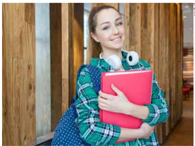
Ranking pokazał dobrą kondycję tyskiej edukacji.