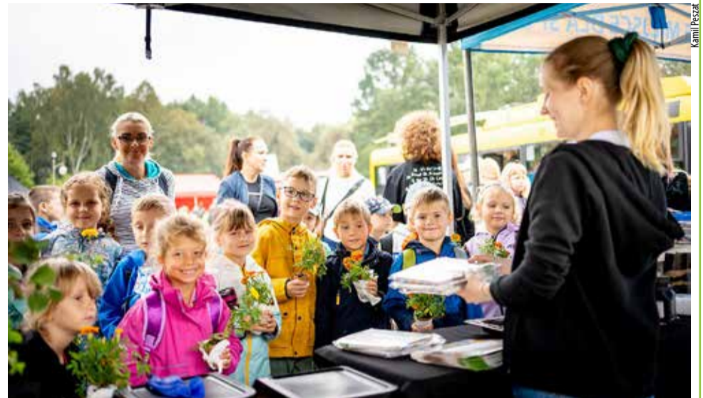
Tyskie eko-pikniki skierowane są głównie dla najmłodszych mieszkańców miasta, ale nie tylko.

W czasach narastających wyzwań środowiskowych nie ma skuteczniejszej drogi do zrównoważonej przyszłości niż konsekwentne budowanie świadomości ekologicznej. Przykład Tychów i spółki Master pokazuje, że lokalne działania – prowadzone systematycznie i z myślą o różnych grupach wiekowych – mogą przynosić wymierne efekty. To inwestycja, która nie tylko chroni środowisko, ale także kształtuje odpowiedzialne, świadome społeczeństwo. NS