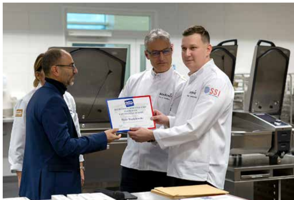
Ceremonia przekazania dokumentu o awansie do półfinału Cook for Change.

Historia tyskiego kucharza pokazuje, że nawet z najbardziej niepozornego składnika można wydobyć potencjał, jeśli towarzyszą mu wiedza, wrażliwość i szacunek do produktu. Chrupko, miękko i roślinnie – dokładnie tak, jak coraz częściej chcemy dziś jeść. NS