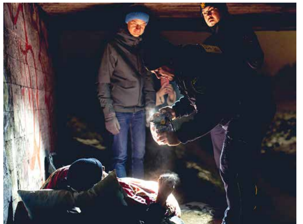
Czasem jedyną formą pomocy, akceptowaną przez osoby w kryzysie bezdomności, jest ciepła herbatą i jakiś koc.