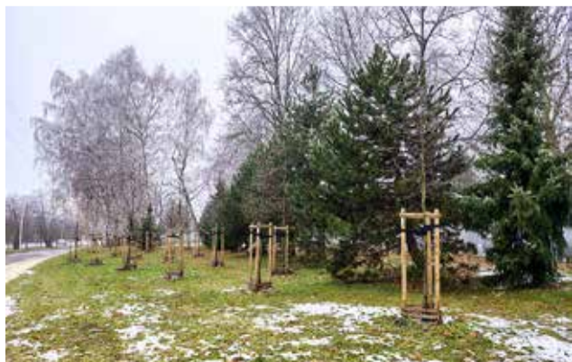
Drzewa nasadzone w bezmroźnym grudniu mają pełne szanse na prawidłowy rozwój.

Bo w zieleni miejskiej liczy się nie kalendarz, lecz warunki – i myślenie o przyszłości miasta, które ma być nie tylko funkcjonalne, ale też zielone i przyjazne. NS