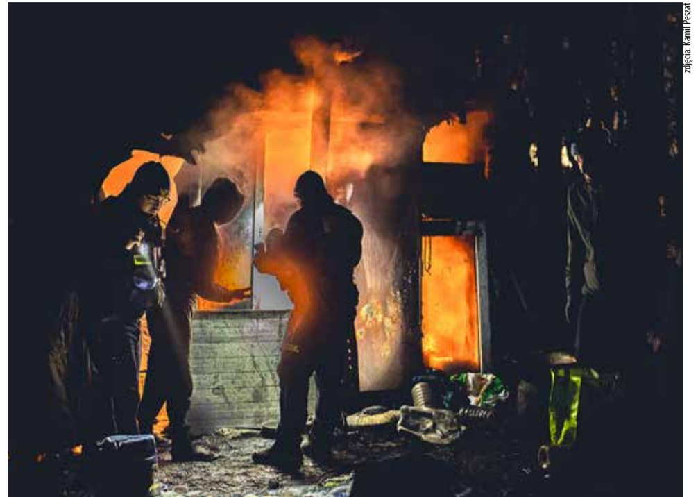
To nie pożar; sposoby ogrzewania koczowisk bywają czasem niebezpieczne.

– Ciuchów potrzebuję dla mojego Kopciuszka – mówi i wskazuje na kobietę leżącą w barłogu, przykrytą czymś, co kiedyś chyba było kocem. Słowo „Kopciuszek” zawisa w powietrzu dłużej niż dym. Jest w nim czułość i sytuacyjna kpina jednocześnie. Mówi dalej, jakbyśmy spotkali się nie na skraju lasu, w przeciekającym dymem szalasie, lecz przy stole, na którym brak co najwyżej garnirunku. Strażnicy słuchają. Nie przerywają. Wiedzą, że ta opowieść musi się wygadać sama. W końcu macha ręką. „Tu jest spokój. Tu jestem