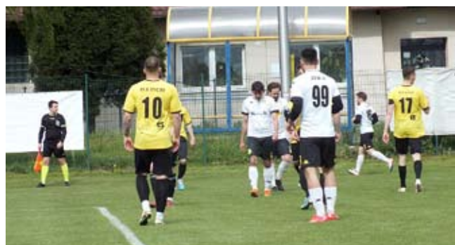
Ani Zetka ani JUWe nie zdobyły w tej kolejce punktów.