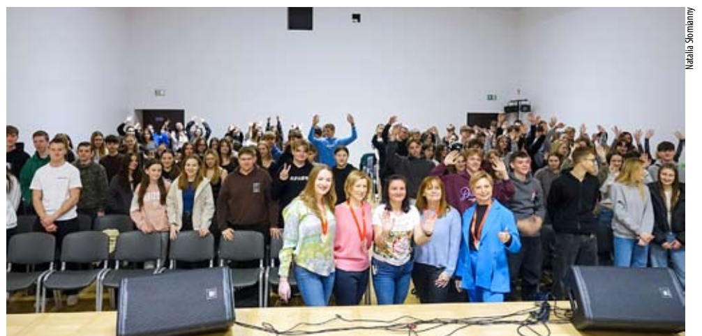
Goście Zespołu Szkół nr 1 oraz młodzież placówki przy ul. Wejchertów.

Tegoroczna, już 24. edycja, odbędzie się standardowo w dwóch możliwych lokalizacjach i datach: 16 maja w Wiśle oraz 21 września w Warszawie. W wiślańskim biegu weźmie udział młodzież z „Morcinka”. ZS 1 jako jedyna tyska placówka bierze udział w projekcie, a tym samym – stała się prawdziwym ambasadorem transplantologii w naszym mieście. Bieg ma charakter sztafety, w której startują cztery grupy – osobistości świata kultury oraz lekarze, osoby po przeszczepie, partnerzy i sponsorzy, a także młodzież. Impreza ma wymiar symboliczny i przypomina, że każdy z nas, może podarować drugiej osobie najcenniejszy dar – życie. NS ●