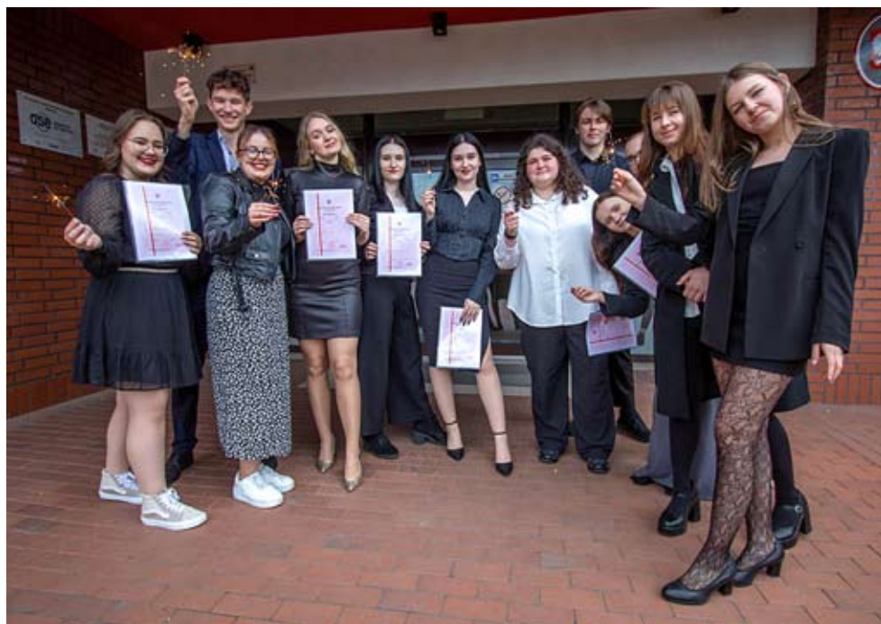
Świadectwa odebrane, teraz czas na egzamin dojrzałości, który rozpoczyna się już za tydzień.

Uczymy bohaterów powstań śląskich i uczestników Sejmu Wielkiego.