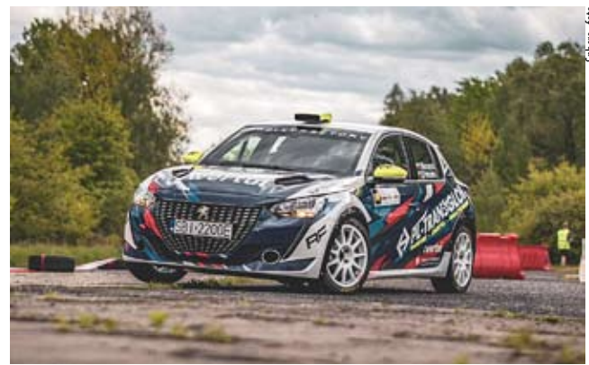
Niebawem rywalizacja SMT osiągnie półmetek.

Organizowane przez Automobilklub Ziemi Tyskiej Samochodowe Mistrzostwa Tychów rozkręcają się już na dobre – w niedzielę rozegrano trzecią w tym sezonie rundę tego cyklu.