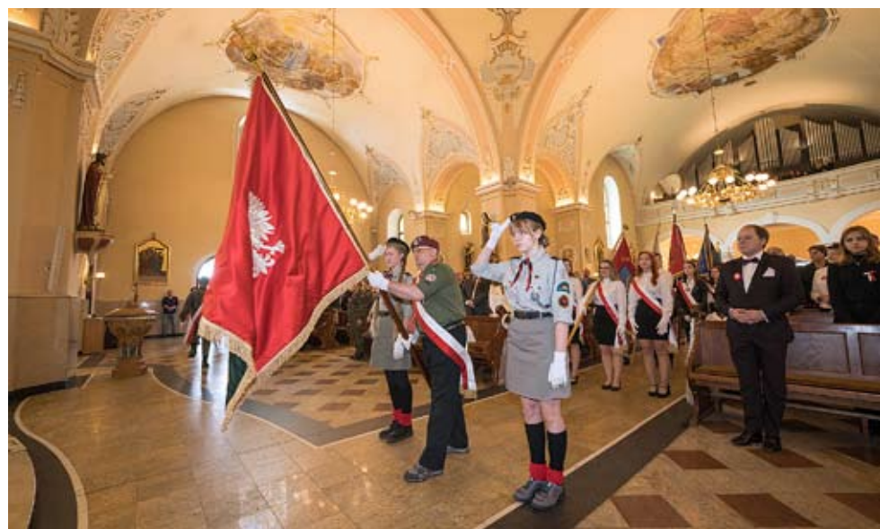
Jak co roku, w obchodach Święta Konstytucji 3 Maja wezmą udział harcerze i młodzież tyskich szkół.

Uczestnicy wydarzeń otrzymają chorągiewki w barwach narodowych i kokardy narodowe rozdawane w miejscach obchodów, co stanowi już tradycję tego święta w naszym mieście. RN ●