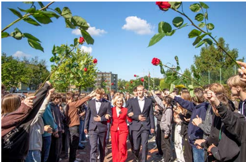
Abiturienti wraz z dyrekcją i nauczycielami weszli do szkoły w szpalerze swoich młodszych koleżanek i kolegów.

„SZCZĘŚLIWEJ DRUGI JUŻ CZAS” ŚPIEWAŁ RYSZARD RYŃKOWSKI I PEWNIENIEJ NIEJEDNEMU MATURZYSTYCE ODBIJAŁO SIĘ W GŁOWIE ECHO TYCH SŁÓW. SZCZEGÓLNI W PIĄTKOWY (26 KWIETNIA) PORANEK, KIEDY TO W ZESPOLE SZKOŁ NR 1 IM. GUSTAWA MORCINKA W TYCHACH ODBYŁO SIĘ POŻEGNANIE TEGOROCZNYCH MATURZYSTÓW – PEŁNE SENTYMENTU, WZRUSZEŃ I CIEPŁYCH ŻYCZEŃ.