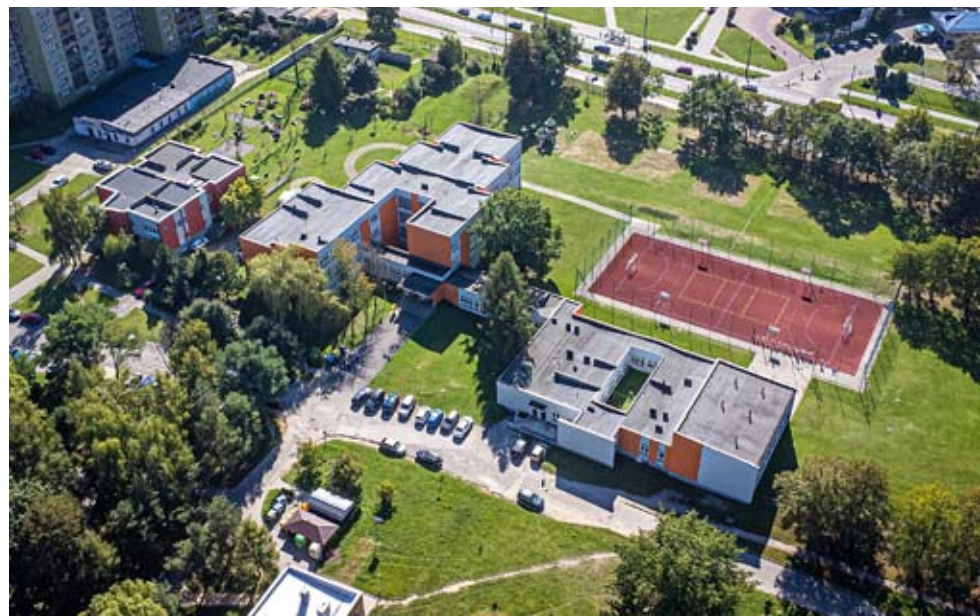
Do końca tego roku na terenie SP nr 21 powstanie nowe, kryte boisko.

Z myślą o młodzieży i zdrowym trybie życia, Urząd Miasta Tychy podpisał 16 kwietnia umowę z wykonawcą na realizację nowej inwestycji. W sąsiedztwie Szkoły Podstawowej nr 21 w Tychach przy ul. Młodzieżowej powstanie wielofunkcyjne boisko kryte za blisko 6 mln złotych.