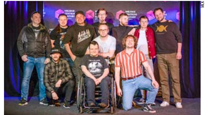
Przedstawiciele zakwalifikowanych do koncertu finałowego zespołów.

Losowanie kolejności zespołów w czerwcowym koncercie finałowym odbyło się 23 kwietnia. Jako pierwszy wystąpi zespół Kąkol czyli ośmioosobowa grupa grająca rap core z elementami nu metalu. Jako jedyni są debiutantem przeglądu i na scenie zmierzają z samymi weteranami. Następnie na scenę wejdzie ExoMooN, czyli zespół grający bardzo techniczny metal. Po nich rocka zagrają Viadomo, a przegląd zamknie trash metalowa Mantra. MN