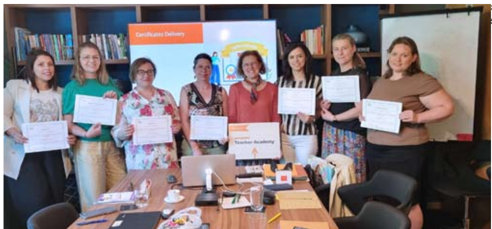
Nauczyciele z SP nr 21 w Tychach poszerzają swoje kompetencje, m.in. językowe.

SZKOŁA PODSTAWOWA NR 21 DOŁĄCZYŁA DO PLACÓWEK, KTÓRE UCZESTNICZĄ W PROGRAMIE UNII EUROPEJSKIEJ.