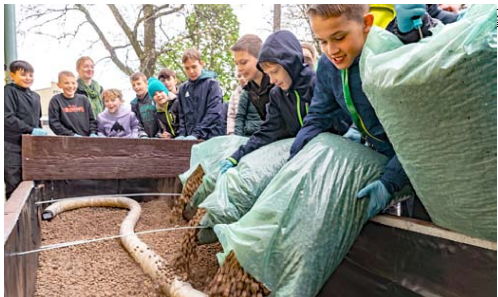
Uczniowie tyskiej „jedyńki” podczas tworzenia ogrodu deszczowego.