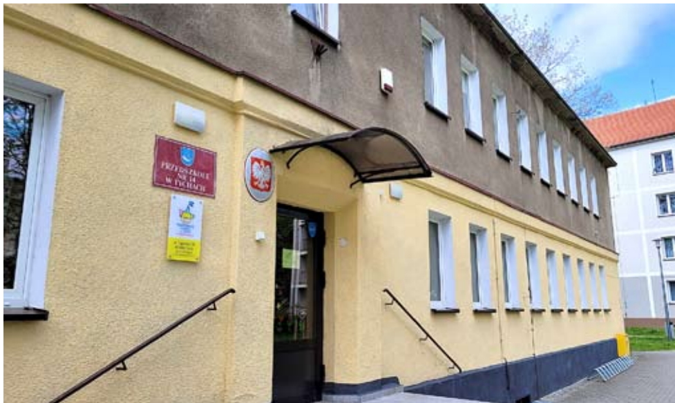
Budynek przedszkola przy ul. Cyganerii czeka gruntowna termomodernizacja.

W lipcu i sierpniu przedszkole nie będzie prowadziło dyżuru wakacyjnego, ponieważ w tym czasie zaplanowano największe prace budowlane. Zgodnie z umową remont potrwa 7 miesięcy. NS