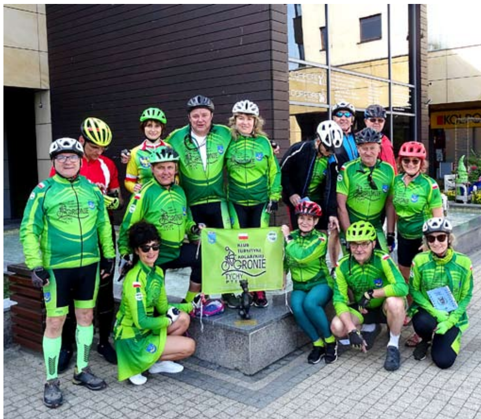
Ekipa kolarzy z KTK Gronie przy jednym z bebeków.