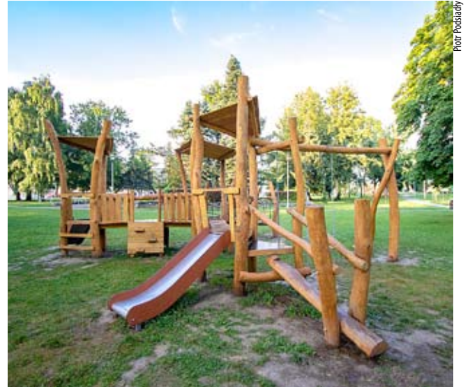
Plac zabaw na Skwerze Niedźwiadków.

– Place zabaw należące do placówek oświatowych (szkół i przedszkoli) są pod stałym nadzorem Państwowego Powia-