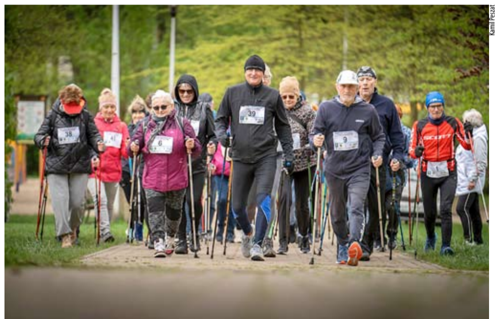
Najliczniej obsadzoną konkurencją ubiegłotygodniowej Tyskiej Spartakiady Seniorów był nordic walking.

JUŻ PO RAZ TRZECI TYSIĄCY SENIORZY MIELI OKAZJĘ WZIĄĆ UDZIAŁ W TYSKIEJ SPARTAKIADZIE SENIORÓW. PONAD 60 ZAWODNIKÓW-SENIORÓW WZIĘŁO DZIAŁ W TAKICH KONKURENCJACH JAK NORDIC WALKING, PCHNIĘCIE KULĄ CZY RZUTY DO KOSZA, ALE TEŻ... SZACHY. WYDARZENIE PATRONATEM HONOROWYM OBJĄŁ PREZYDENT MIASTA TYCHY.