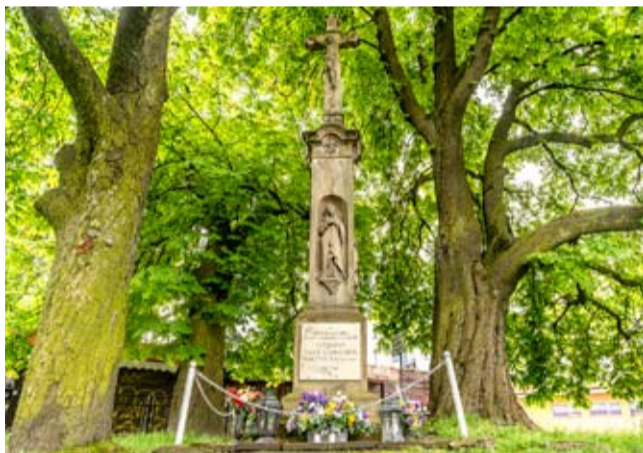
„Boża Męka” przy ul. Grota-Roweckiego dzisiaj.

Nowość Kolei Śląskich – strefa dla rowerów.