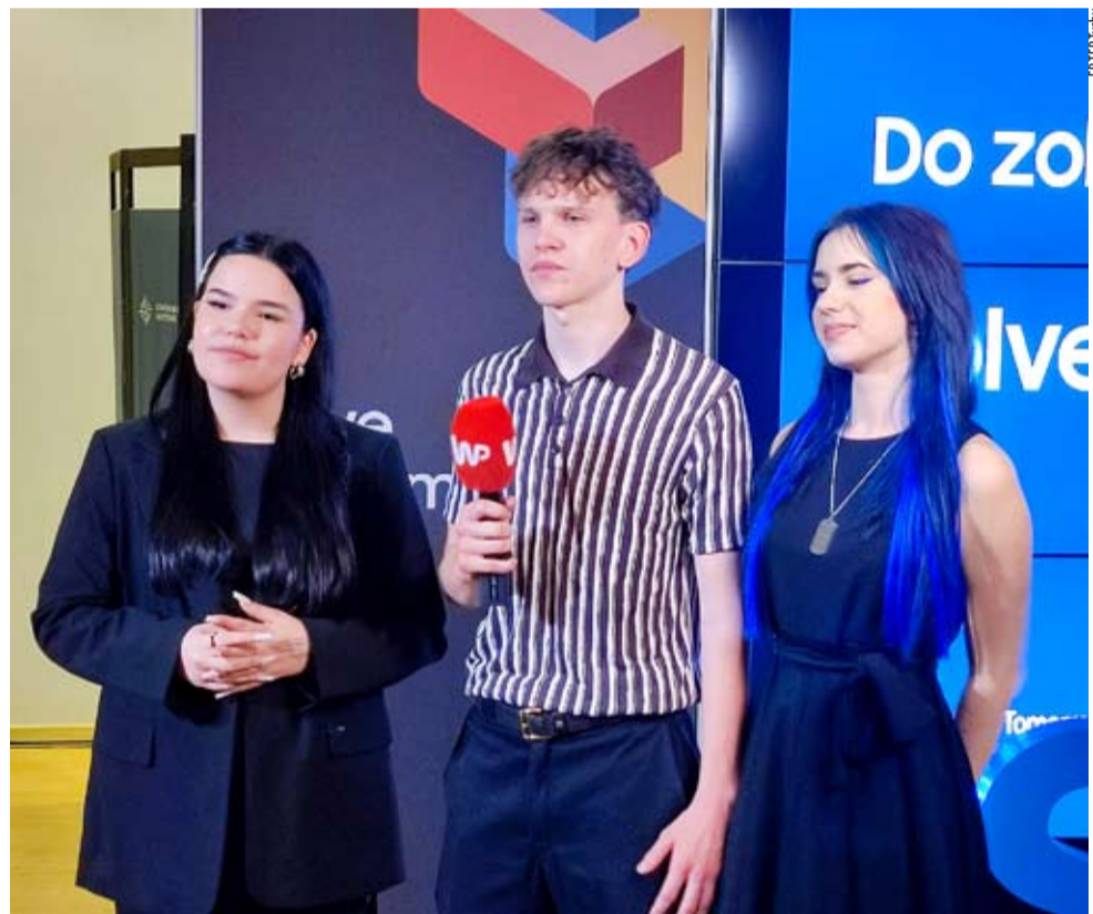
Laureaci konkursu z nagrodą za projekt.