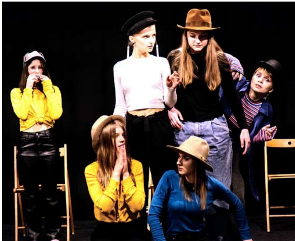
Fragment spektaklu „Sześć małych świnek”.

Spektakl rozpocznie się na scenie MCK przy ul. Bohaterów Warszawy 26 we wtorek (23.04) o godz. 18. Wstęp jest wolny, ale obowiązuje rezerwacja miejsc. WW ●