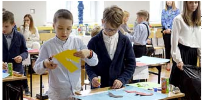
Zwycięski duet z SP nr 35 w Tychach.