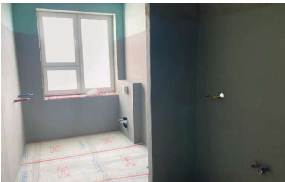
Oddział Chirurgii Rekonstrukcyjnej Narządu Ruchu w trakcie remontu