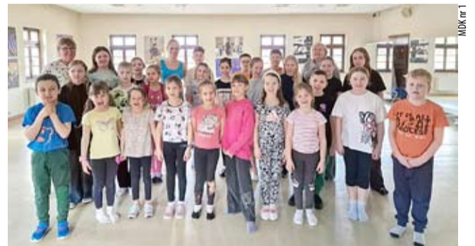
„Bąble” ze swoimi instruktorkami podczas wizyty w siedzibie ZPiT „Śląsk”.

nalnej i kulturalnej. Jednocześnie wychowankowie poznają wyjątkowe miejsca naszego regionu. Zespół „Bąble” za osiągnięcia w roku szkolnym 2022/2023 został nagrodzony podczas Tyskiej Gali Najzdolniejszych Uczniów. RN ●