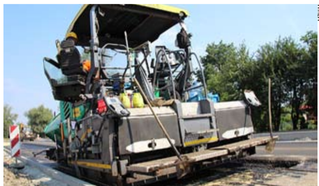
Na tyskich ulicach pojawił się sprzęt, służący do pozimowej naprawy dróg.

Dodajmy, iż w 2023 roku asfaltowe nakładki ułożono w ponad 29 miejscach, na odcinkach o łącznej długości 10,1 km. Koszt – 8,2 mln zł. LS