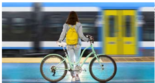
Velo Cugiem będzie można (wraz z rowerem) podróżować w góry już od najbliższej soboty.

– Podróżny posiadający taki bilet powinien zgłosić chęć przewozu roweru konduktorowi. W miarę możliwości, kierownik pociągu wskaże miejsce umożliwiające bezpieczny przewóz jednośladu, ale może także odmówić w przypadku szczególnie wysokiej frekwencji w pojeździe – wyjaśnia rzecznik prasowy Kolei Śląskich. LS