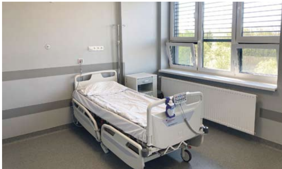
Wyremontowany Oddział Chirurgii Ogólnej i Onkologicznej