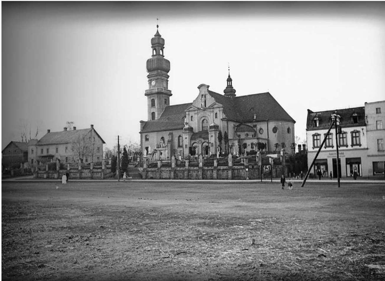
Kościół pw. św. Marii Magdaleny. 1936 r.

90 LAT TEMU TYCHY UZYSKAŁY TYTUŁ GMINY MIEJSKIEJ; NA PEŁNIĘ PRAW MUSIAŁY POCZEKAĆ DO 1951 ROKU.