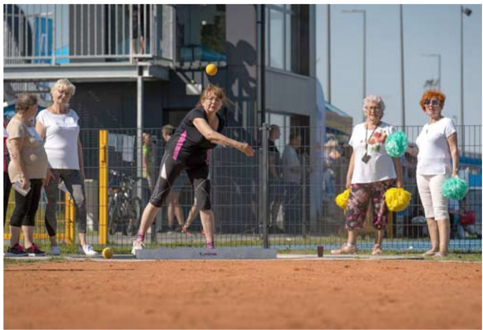
Seniorzy z Tychów będą mogli wykazać się tężyzną fizyczną już 16 kwietnia.