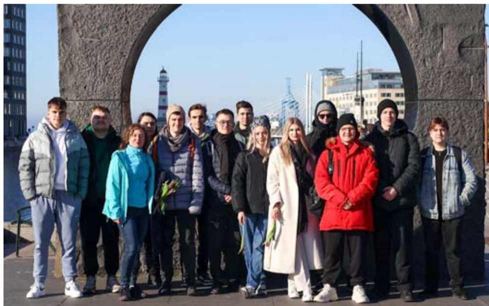
Uczniowie Zespołu Szkół nr 6 podczas praktyk w Malmö.