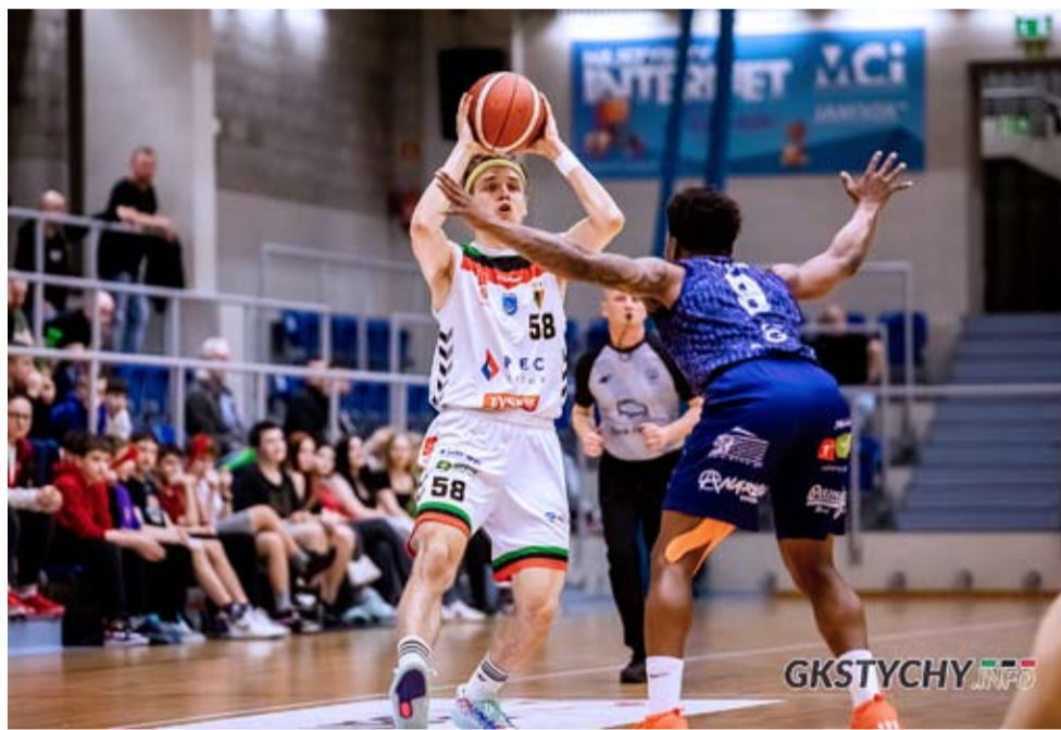
Mimo porażki tyszanom udało się wejść do fazy play off.