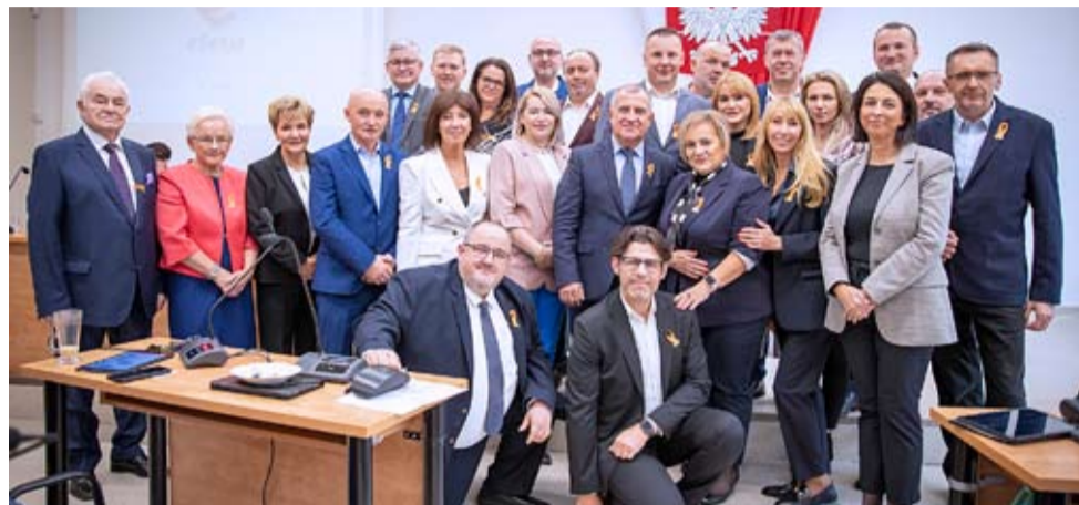
Rada Miasta Tychy w tym składzie zbierze się jeszcze tylko raz, w poniedziałek 15 kwietnia.