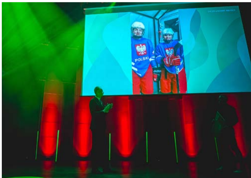
Nagrodzonych Atomówek nie było tego wieczora w Mediatece, ale z ekranu pozdrowili wszystkich z Rygi.