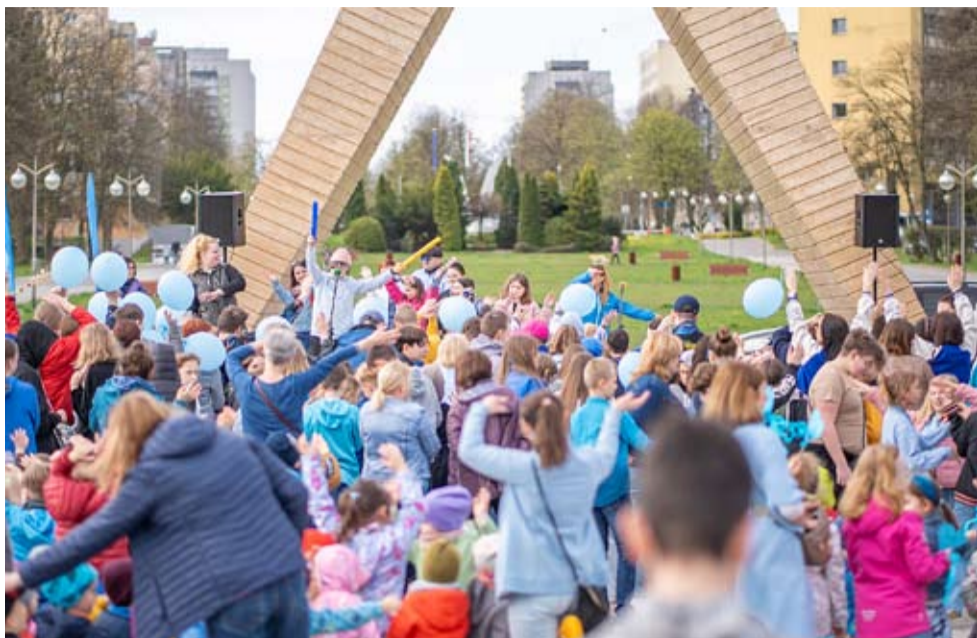
„Marsz w kolorze blue” zakończył pierwszy tydzień obchodów Światowego Miesiąca Świadomości Autyzmu.

2 kwietnia wypadł Światowy Dzień Autyzmu a kwiecień to Światowy Miesiąc Świadomości Autyzmu. W Tychach już 25 marca w Szkole Podstawowej nr 24 im. Himalaistów Polskich odbyła się konferencja „Rozmowy otwarte – spektrum autyzmu – różnorodność i moc!” pod honorowym patronatem pełniącego funkcję prezydenta Tychów Macieja Gramatyki.