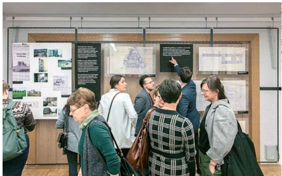
Wystawa prezentuje dokumenty, fotografie i makiety osiedla, które nigdy nie powstało.