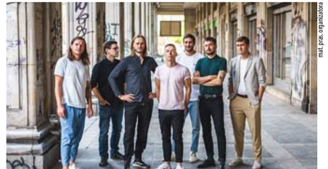
Kwieciową Tyską Galę Sportu uświetni występ Teatru Improwizowanego Klancyk.