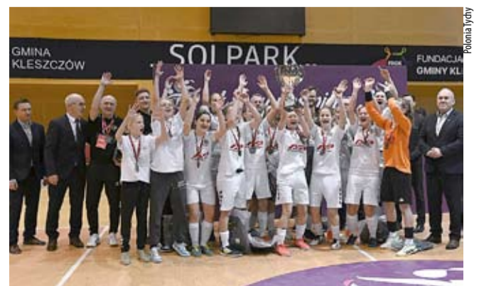
Drużyna Polonii Tychy odniosła pierwszy w tym roku piłkarski sukces.

– Wygraliśmy 11 meczów na 12 rozegranych i po rundzie jesiennej mamy trzy punkty straty do prowadzącego Rekordu Bielsko Biala. Szansa jest więc duża i walczymy dalej. LS ●