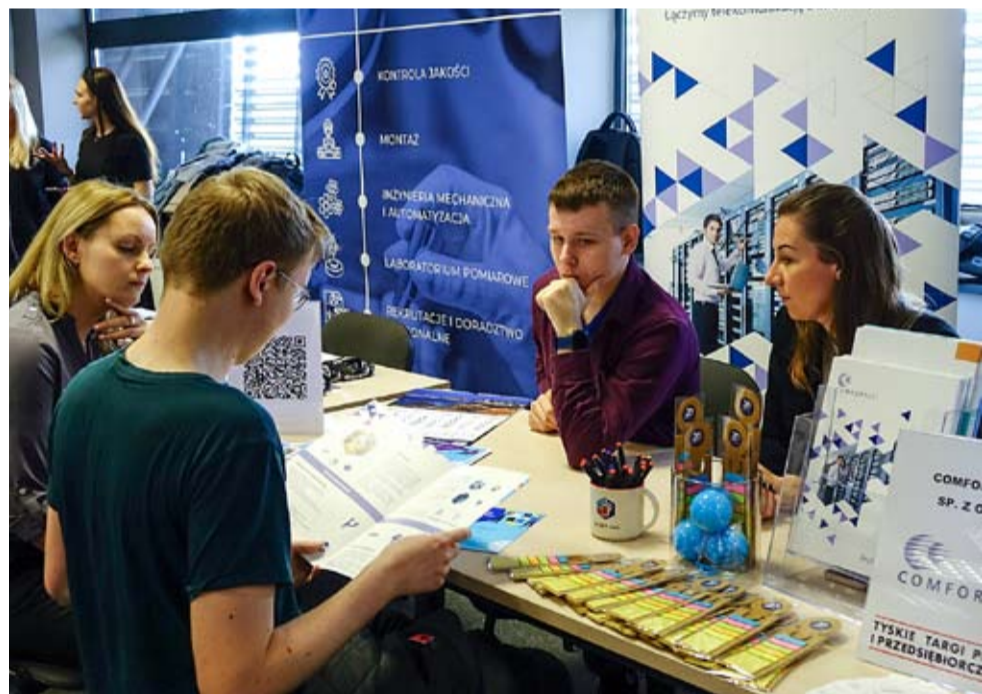
Ofertami pracy zainteresowani byli w dużej liczbie ludzie młodzi.