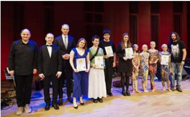
Laureaci kategorii scenicznej z jurorami i gospodarzami imprezy.

– Ten szczególny wieczór chciałbym rozpocząć od pewnej dygresji. Talenty są bowiem szczególną wartością w naszym życiu, a w starożytności stanowiły jednostkę miary masy i pieniądza o wartości nieco ponad 30 kg srebra. To taki przysłowio- wy grosz. Hans Christian Andersen napisał w jednej ze swoich bajek, że w życiu można stracić