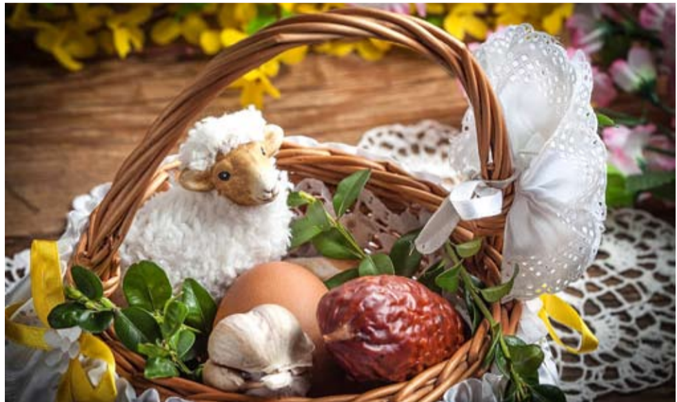
Tradycja święcenia pokarmów pojawiła się u nas stosunkowo późno.

Charakterystyczne dla Świąt Wielkanocnych jest tzw. chodzenie po dyngusie. Ma on dwie formy – elegancką, kiedy z butelką wody perfumowanej kawalerowie chodzą do swojej lipsty, by podkreślić głębię uczuć lub brutalną – kubłem wody. Zwyczaj ten związany jest z rytuałem oczyszczenia – w kontekście religijnym, polewanie wodą oznaczało obmycie z grzechu. Jednak początkowo był kojarzony z pogańskimi praktykami, potępianymi, a nawet zwalczanymi przez Kościół. W czasach Władysława Jagiełły synod diecezji poznań-