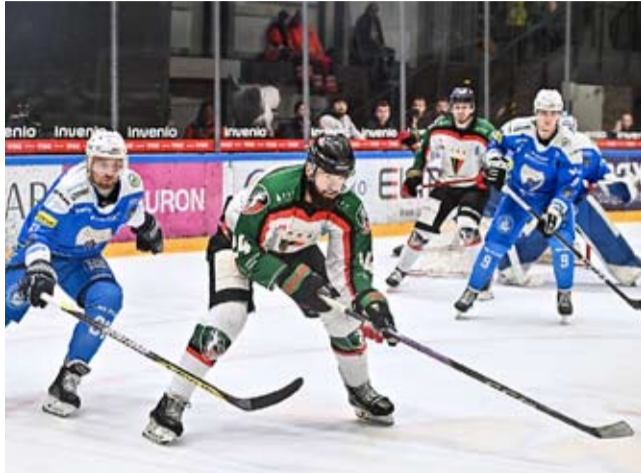
Po czterech porażkach z Unią hokeiści GKS zakończą sezon meczami o brązowy medal z JKH GKS Jastrzębie.