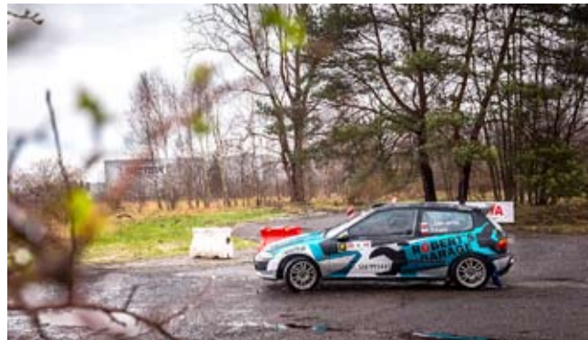
Na kolejną eliminację SMT poczekać do 28 kwietnia.

Kolejna runda SMT odbędzie się 28 kwietnia. Więcej informacji o SMT w 2024 r. i o kolejnych zawodach będzie można znaleźć na stronie www.azt.tychy.pl. (OPRAC. LS)