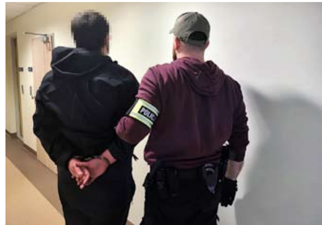
Podejrzany tyszanin w trakcie doprowadzania do aresztu.

Do zatrzymania podejrzanego tyszanina doszło po uprzednim zawiadomieniu o popełnieniu przestępstw o charakterze pedofilskim oraz zebraniu odpowiedniego materiału dowodowego. W czasie przesłuchania miejsca zamieszka-