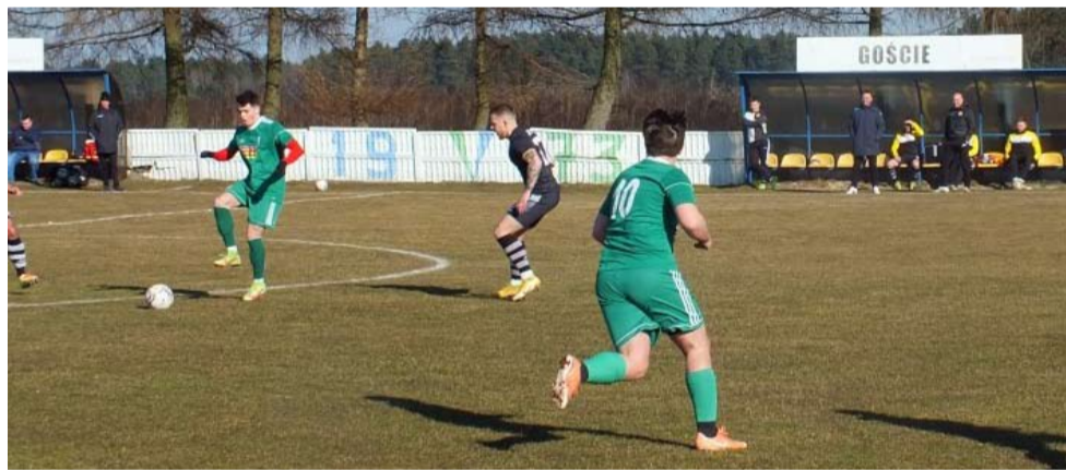
W najbliższy weekend piłkarze okręgówki i klasy A wrócą do walki o ligowe punkty.

Oto zestaw par pierwszej wiosennej kolejki: Unia Bieruń – Siódmka, Ogrodnik Cielmice – Studzienice, Gardawice – Czulołowianka, Krupiński -Rudołtówice, Bojszowy – Fortuna, Sokół Wola – Woszczyce, Wisła Wielka – LKS Łąka, Znicz – Leśnik. LS ●