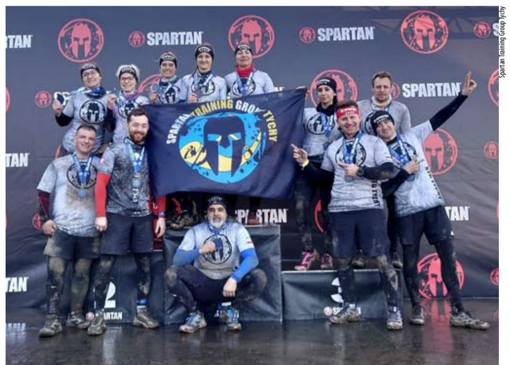
Po ukończonym biegu stroje tyskich Spartan nie są najczystsze, ale taka już specyfika tej dyscypliny.