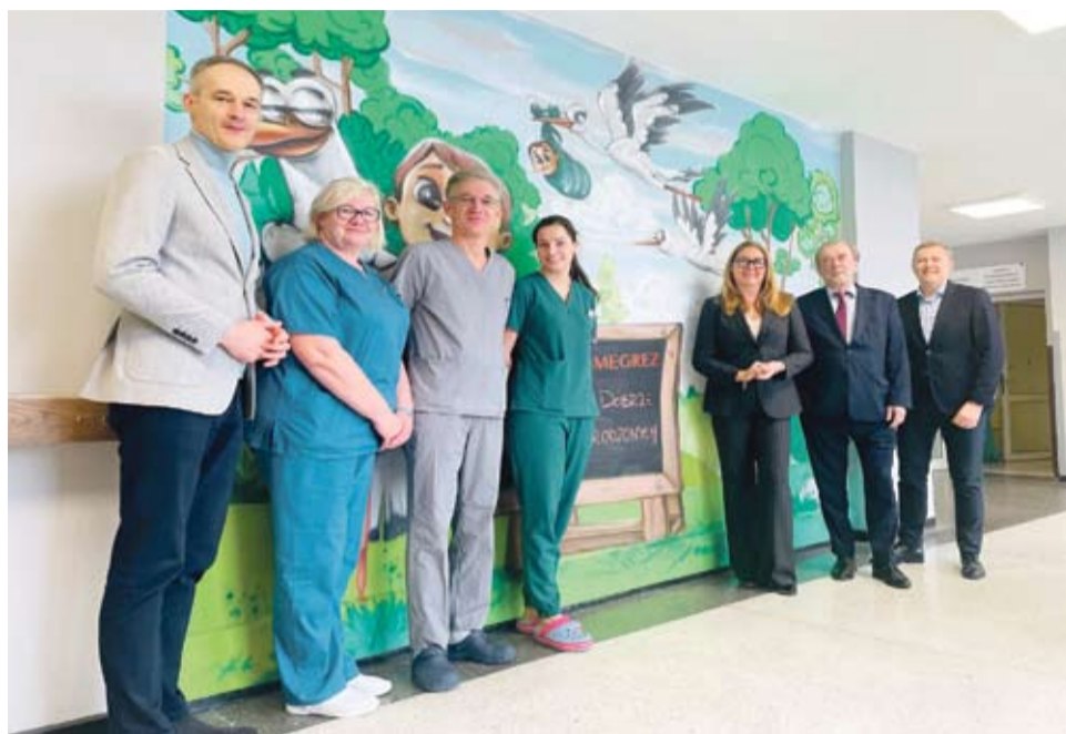
Oficjalne odsłonięcie muralu

Na środku malowidła znajduje się tabliczka namalowana specjalną farbą