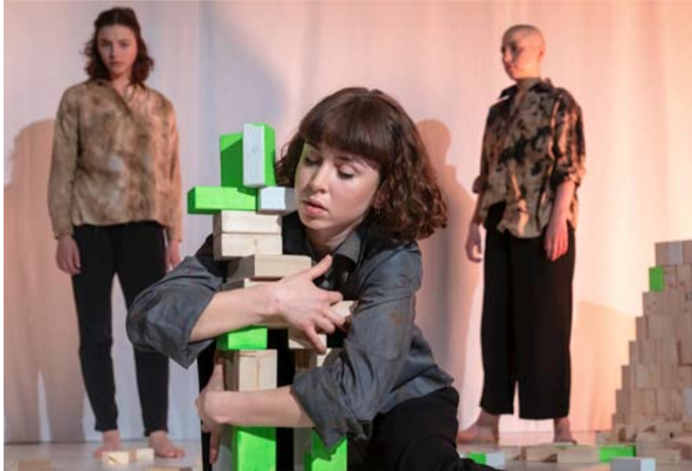
Fragment próby spektaklu „Pies, który jeździł koleją”.