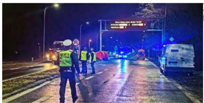
W wypadku na ul. Oświęcimskiej zginęła młoda kobieta.