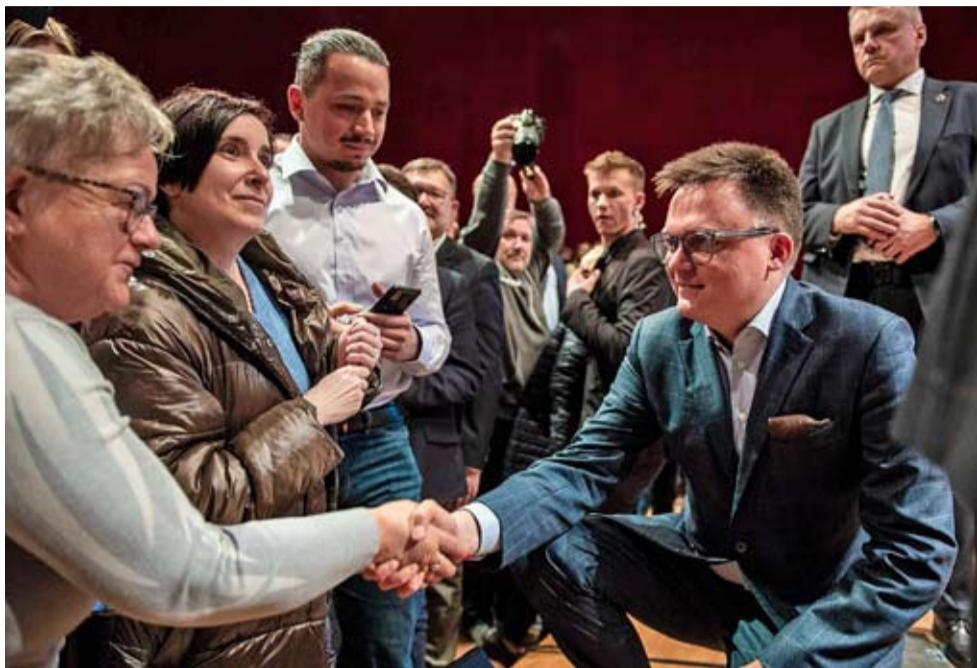
Możliwość spotkania z marszałkiem Sejmu RP Szymonem Hołownią przyciągnęła do sali koncertowej Mediateki nadkomplet publiczności.

W minioną sobotę 9 marca z przedwyborczą wizytą gościł w Tychach marszałek Sejmu RP i lider ugrupowania Polska 2050 Szymon Hołownia. W wypełnionej do ostatniego miejsca Mediatece spotkał się z kandydatami Trzeciej Drogi do okolicznych samorządów, swoimi sympatykami i mieszkańcami naszego miasta.