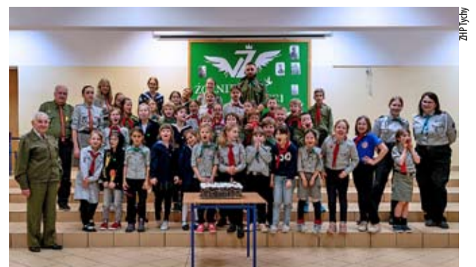
Takie imieninowe zdjęcie tyskich zuchów zdarza się raz na cztery lata.