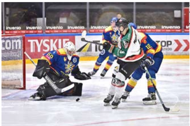
Kibice GKS mają nadzieję, że szósty mecz będzie rozstrzygający.