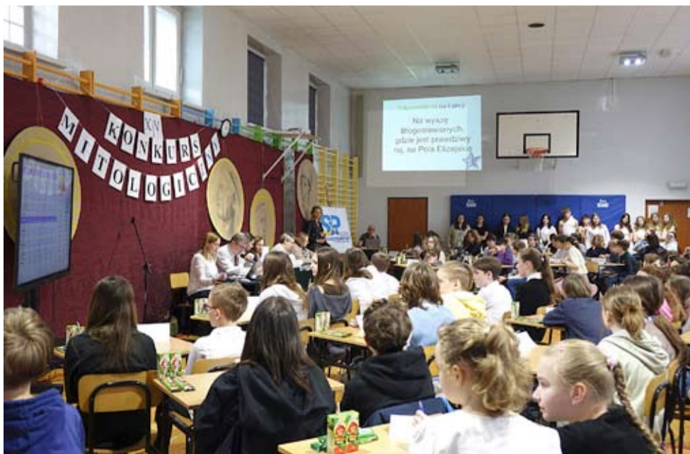
W tegorocznym konkursie mitologicznym wzięło udział 26 drużyn ze śląskich szkół.