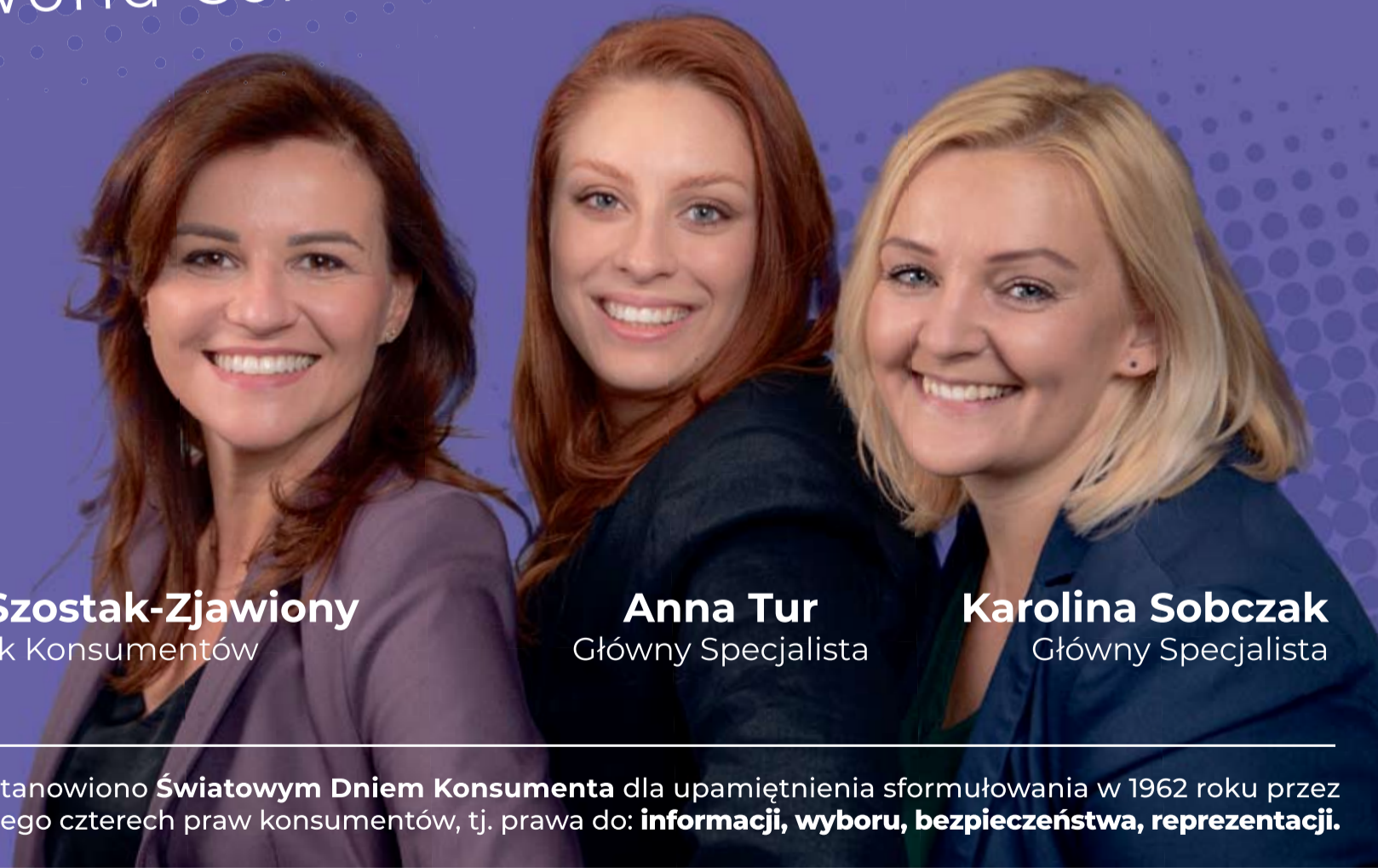
Katarzyna Szostak-Zjawiony Miejski Rzecznik Konsumentów

Światowy Dzień Konsumenta World Consumer Rights Day, WCRD