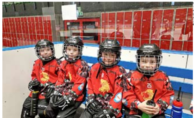
Najmłodszy hokeiści – reprezentanci Przedszkola nr 5.