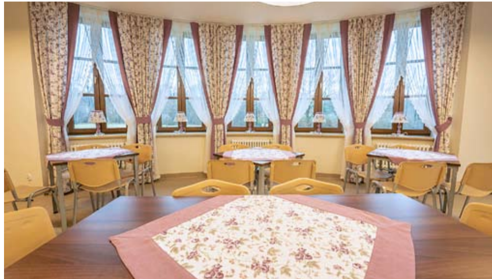
Pensjonariusze DPS „Dobre Miejsce” wreszcie będą mogli korzystać ze zlokalizowanej w Kobiórze placówki.

Droga do otwarcia DPS w Kobiórze była wyjątkowo długa, zważywszy, że w 2017 roku Tychy kupiły od Archidiecezji Katowickiej ponad 3-hektarową działkę wraz z dwoma budynkami w Kobiórze. Od początku miasto deklarowało, że przeznaczy nieruchomością na dom pomocy społecznej dla osób w podeszłym wieku. Prace adaptacyjne, dostosowujące obiekt do planowanej działalności zostały zakończone jesienią 2021 roku i Powiatowy Inspektor Nadzoru Budowlanego w Pszczynie wydał zawiadomienie o dopuszczeniu budynków do użytkowania.