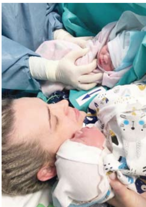
Tuż po jednym z porodów