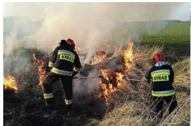
Pożary traw nie tylko absorbują strażaków ale i przyniosą wielkie straty.