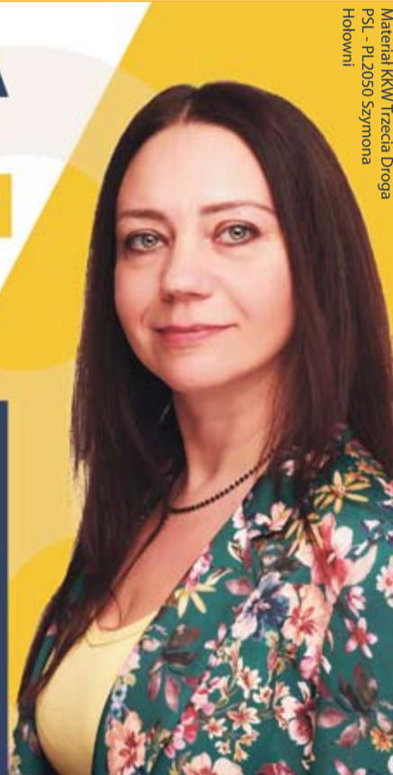
Materiał KKW Trzecia Droga PSL - PL2050 Szymona Hołowni