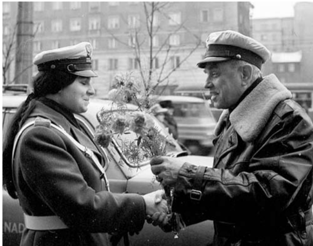
Tego dnia życzeniami i kwiatami zaskakiwane były nawet funkcjonariuszki na ulicach.

W 1959 roku zorganizowano w Tychach miejską akademię