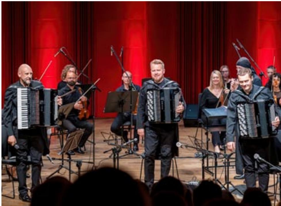
Poprzednim razem Motion Trio gościło w Mediatece w 2022 roku.

Choć do wydarzenia pozostało jeszcze nieco ponad dwa tygodnie, to jednak warto już je zapowiedzieć, gdyż zapowiada się niezwykle interesująco. Mowa o dorocznej Tyskiej Gali Kultury, którą zaplanowano na czwartek, 21 marca.