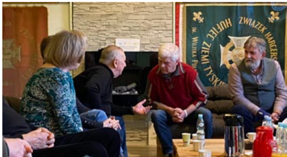
Dawni harcerscy aktywiści spotkali się, by wspominać historię ruchu.