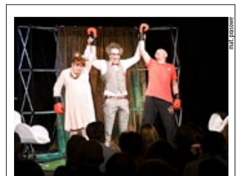
7 MARCA, GODZ. 19: „KONSERWA” – SPEKTAKL KOMEDIOWY TEATRU SCENA POCZEKALNIA, KLUB MCK WILKOWYJE

GODZ. 9 i 11 – „PIES, KTÓRY JEŹDZIŁ KOLEJĄ” – spektakl produkcji Teatru Małego (Pasaż Kultury Andromeda, pl. Baczyńskiego)