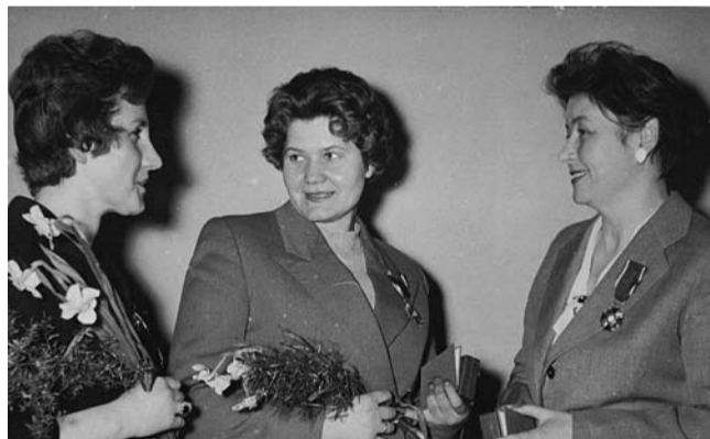
Dzień Kobiet był okazją do uhonorowania pań nie tylko goździkami, czekoladkami czy... rajstopami, ale także odznaczeniami państwowymi i resortowymi.

W latach 70. uroczyste akademie w Tychach organizował na osiedlu A Zarząd Miejski Ligi Kobiet. Panie obdarowywane były wiązkami kwiatów, upominkami, a nauczycielki i wychowawczynie przedszkoli – nagrodami pieniężnymi, ufundowanymi przez Wydział Oświaty UM. Z kolei Zarząd Ligi wręczał nagrody pieniężne dla emerytek i rencistek, kobiet samotnych i repatriantek. W innym roku „Echo” pisało: „przedstawicielki kobiecego aktywu regionu tyskiego, pszczyńskiego i Mysłowic, działaczki Frontu Jedności Narodu i organizacji społecznych spotkały się z władzami partyjnymi i państwowymi w klubie NOT (dziś: Kłoster Pub przy ul. Edukacji – przyp. red.). Nie zabrakło kwiatów i czekoladek, a potem wesołe spotkanie zorganizowało Koło Gospodyń Wiejskich z Kopciowic”.