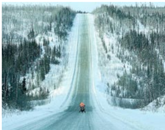
Kanada to przede wszystkim piękne, wielkie pustkowia.

do Prudhoe Bay, za co jestem im cholernie wdzięczny. Ostatnie tysiąc kilometrów było naprawdę trudne. Większość trasy jechałem z opuszczonymi płozami, co mocno nadwerżyło mi nogi, zwłaszcza stopy wystawione na temperatury rzędu minus 40 stopni C. Ostatni tydzień to walka głównie z samym sobą. Przyzwyczaiłem się nawet do tych 18-kołowych ogromnych ciężarówek, które, każdorazowo, gdy mnie mijają, wzbijają małe śnieżne tsunami... Gdy już osiągnąłem cel, poczułem spokój. Spokój, że wszystko jest na swoim miejscu, że jest takie, jak powinno być. Cele są po to, aby je osiągać. Ja osiągnąłem swój. Mogę wracać do domu. Taki jest sens podróży. MN ●