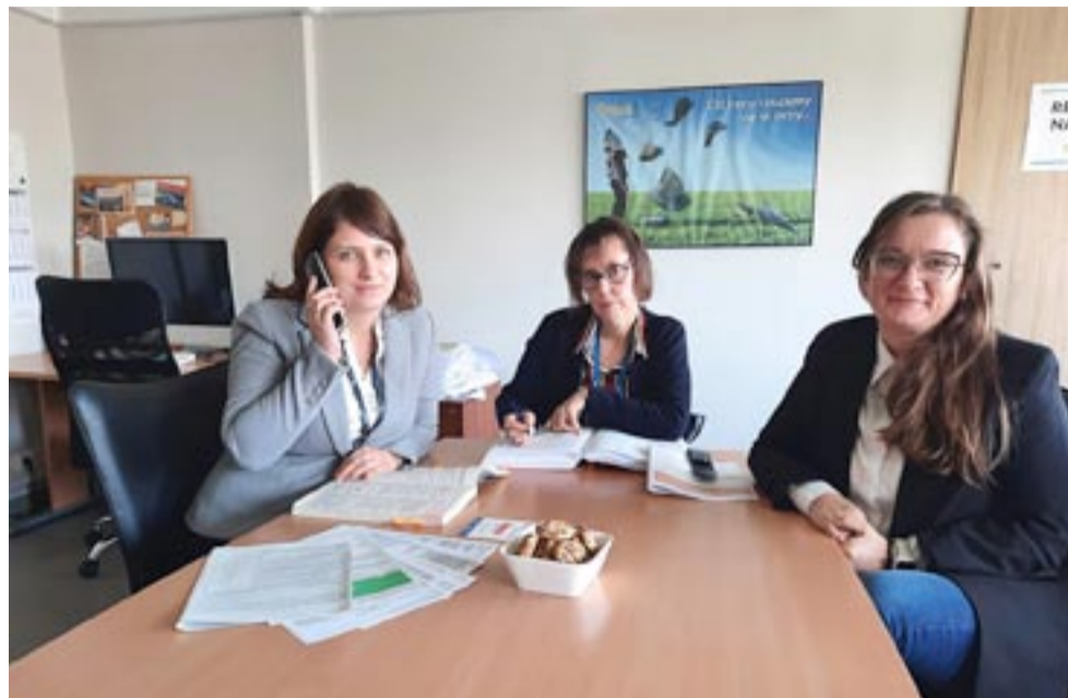
Ekspertki tyeskiego Urzędu Skarbowego przez dwie godziny doradzały naszym Czytelnikom w redakcji „Twoich Tychów”.

– Wysokość podatku jest zależna od łącznej kwoty dochodu rocznego. W pana przypadku u swojego pracodawcy może pan złożyć oświadczenie o niepobieraniu przez niego kwoty zmniejszającej podatek. Jest to istotne, gdyż w przypadku dwukrotnego naliczenia (praca i emerytura) w rozliczeniu rocznym trzeba ją będzie zwrócić. Może też pan złożyć oświadczenie w ZUS i u pracodawcy, w którym można wskazać, że chce pan, by panu potrącono po połowie tej kwoty. Jeśli sam pan się nie rozliczy, to zrobi to administracja skarbową 30 kwietnia. Jeśli natomiast chciał-