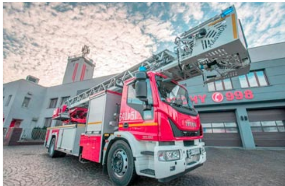
Tysiąc strażaków interweniowało w ub. roku rzadziej niż w roku poprzednim.

Dodajmy, iż w 2023 roku przeprowadzono 175 kontroli w zakładach, instytucjach, terenach itp., z czego 48 dotyczyło odbiorów obiektów. W sumie, w ramach tych kontroli sprawdzono stan bezpieczeństwa w 237 obiektach. W grupie 92 skontrolowa-