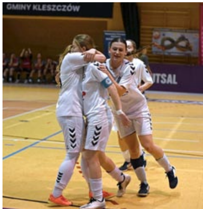
Takich powodów do radości miały w Kleszczowie piłkarki Polonii Tychy bardzo wiele.