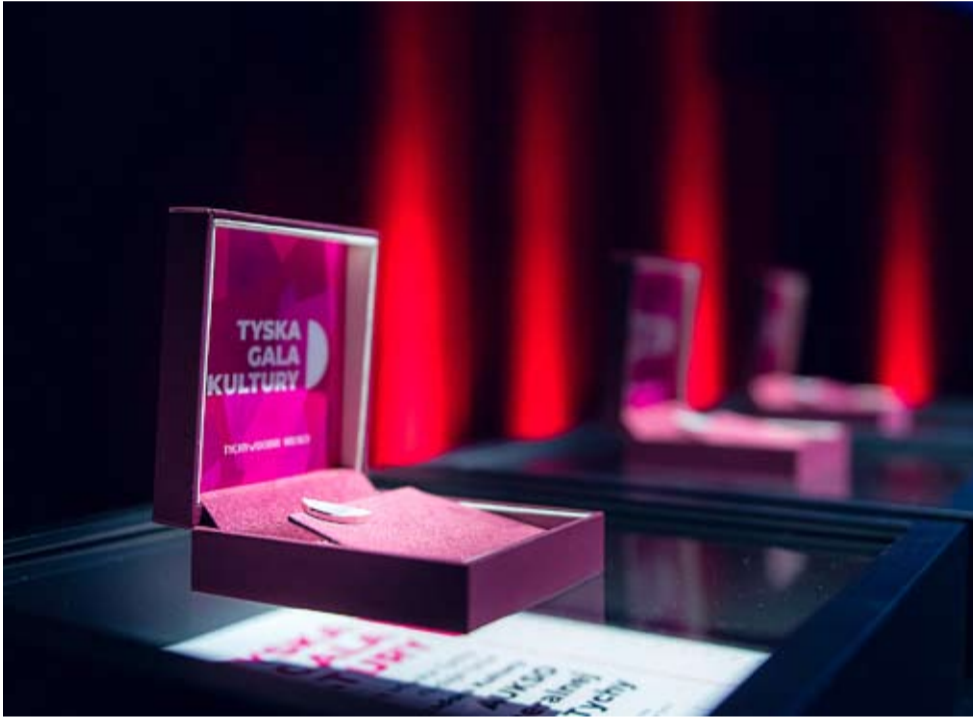
Tegoroczna Tyska Gala Kultury odbędzie się 21 marca w Mediatece.