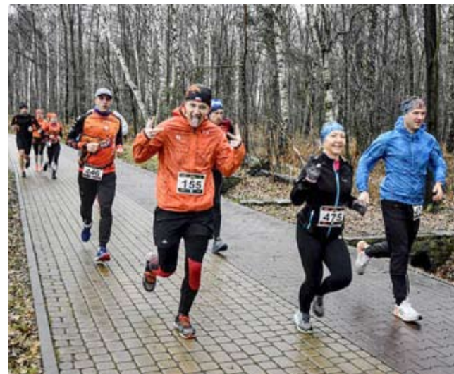
W inauguracyjnych XVII Grand Prix Tychów w biegach przełajowych zawodach w Paprocanach wzięła udział ponad setka zawodników.

Kolejny bieg cyklu zostanie rozegrany w niedzielę, 25 lutego, także w Paprocanach. WW ●