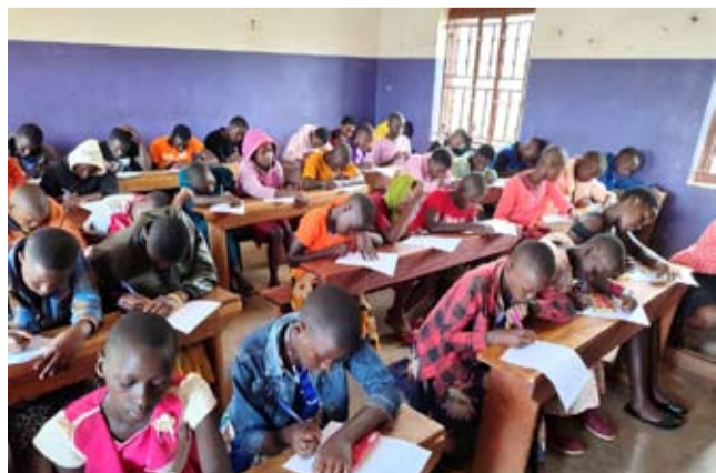
Polskie misje w Ugandzie prowadzą m.in. działalność w dziedzinie edukacji młodych pokoleń mieszkańców Afryki.