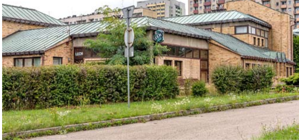
W zakupionej przez gminę dawnej siedzibie Telekomunikacji Polskiej powstaną mieszkania dla tyszan.

Przekształcenie budynku Telekomunikacji w przestrzeń mieszkalną to ważny krok w rozwoju infrastruktury miejskiej Tychów, który pozwoli zaspokoić rosnące zapotrzebowanie na mieszkania oraz przyczyni się do ochrony i wykorzystania dziedzictwa architektonicznego miasta. MN