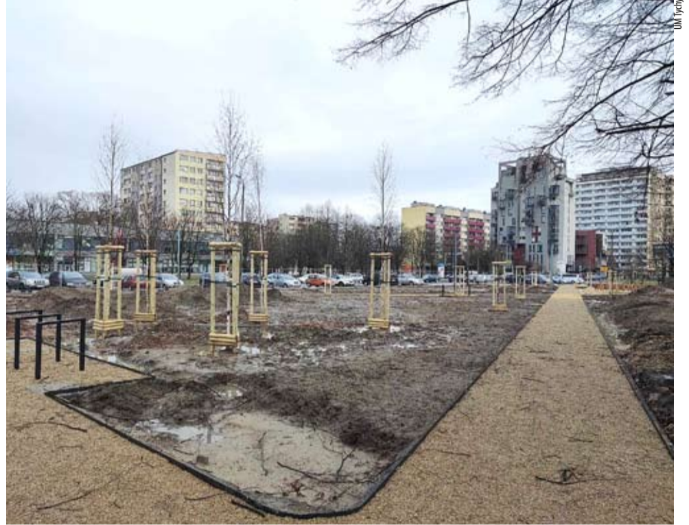
Na realizowanym aktualnie skwerze w pobliżu siedziby poczty przy ul. Dąbrowskiego posadzono już pierwsze drzewa.

Jeden z mieszkańców rozważał możliwość oddania omawianego terenu pod intensywną zabu-