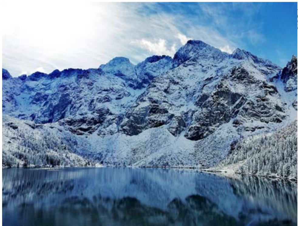
Rejon Morskiego Oka także zagrożony jest lawinami.

W przypadku pieszych wypraw fundamentalne kwestie to prognoza pogody, odpowied-