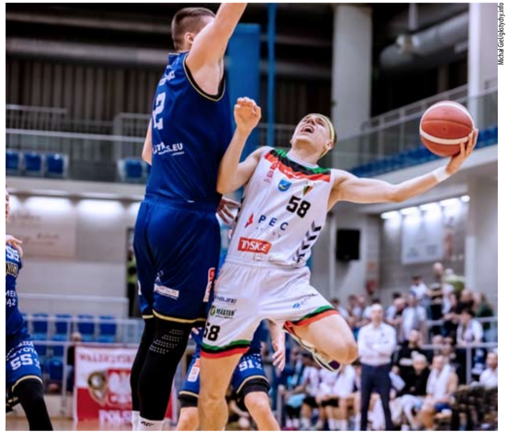
Choć tyszanie robili co mogli, lidera nie udało się pokonać.

I bieg tegorocznego Grand Prix Tychów za nami.