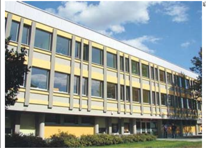
Dzień otwarty w ZSM przy al. Niepodległości 53 już w najbliższy piątek.