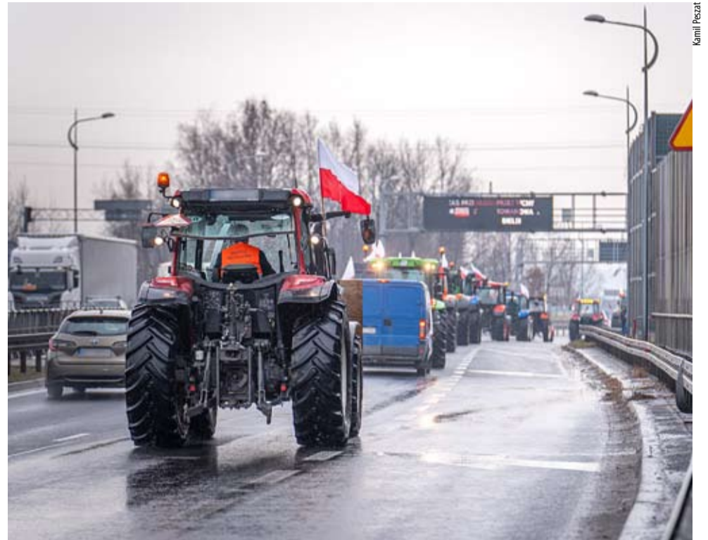
Protestujący rolnicy skutecznie spowalniają ruch m.in. na trasie z Katowic do Bielska-Białej. Było ich widać także na ul. Oświęcimskiej.

W MINIONY PIĄTEK W CAŁEJ POLSCE PROTESTOWALI ROLNICY. UTRUDNIENIA NIE OMINĘŁY TYCHÓW.