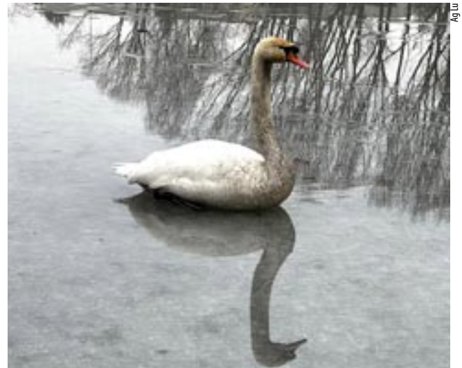
„Nakarmiony” przez ludzi ptak wyglądał bardzo źle i nie ruszał się z miejsca.

Jak relacjonowała później tyszaneczka na jednej z lokalnych grup w mediach społecznościowych: „Na miejscu zastałam wezwane przez przechodniów straż miejską oraz straż pożarną. Jeden z łabędzi odleciał na drugi staw, ten nie był w stanie się podnieść. (...) Ten staw, póki co, zamrożony całkiem, na tafli lodu rzucone bułki i spleśniały chleb. Pozbierałam wszystko, co mogłam i wyrzuciłam do kosza. Przyniosłam z domu narzędzia i odkułam przy brzegu dostęp do wody, ile dałam radę. Poprosiłam starszego pana, aby na chwilę postać na brzegu, bo chcę wejść na lód i spróbować nagonić łabędzia bliżej tego