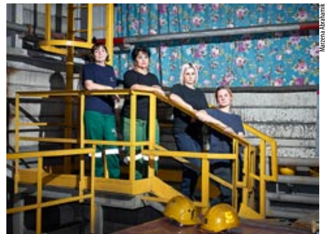
Zdjęcie przedstawiające pracownice Zakładu Górniczego „Janina” w Libiążu.

Czwartkowe spotkanie rozpocznie się o godz. 18; wstęp jest wolny. WW