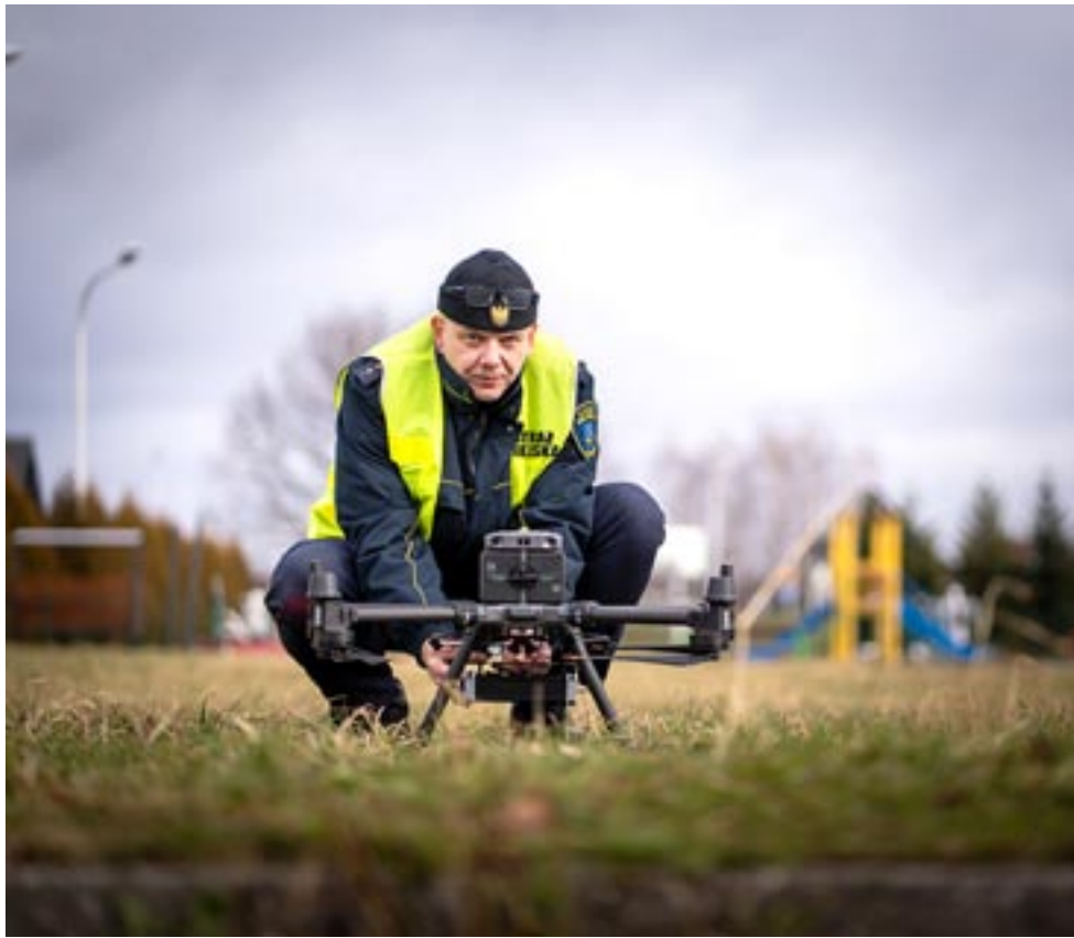
Dron ma pomagać w namierzaniu trucielei.

Czworo strażników miejskich przeszło szkolenia w obsłudze drona, jaki komenda Straży Miejskiej w Tychach pozyskała w ramach budżetu obywatelskiego. Możliwości wykorzystania tego urządzenia są ogromne. Zadania, jakie można dzięki niemu wykonywać, zależą od rodzaju podczepianej głowicy.