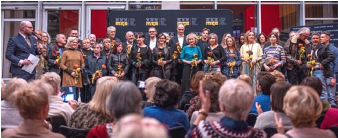
Zbiorowe zdjęcie tyskiego środowiska plastyków w Pasażu Kultury Andromeda.