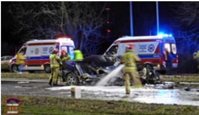
Samochód, którym podróżowała dwójka osób przedstawiał makabryczny widok.