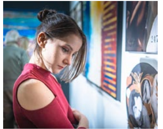
Wystawę można odwiedzać do połowy marca.