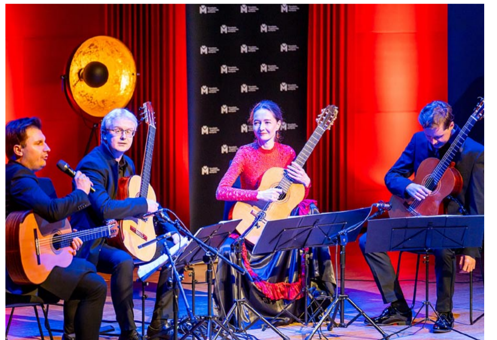
Galę zwińczył koncert Cracow Guitar Quartet.