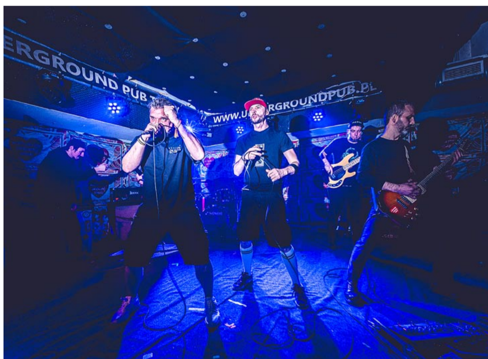
Jednym z wykonawców koncertu w Underground Pub był tyski zespół Kąkol.