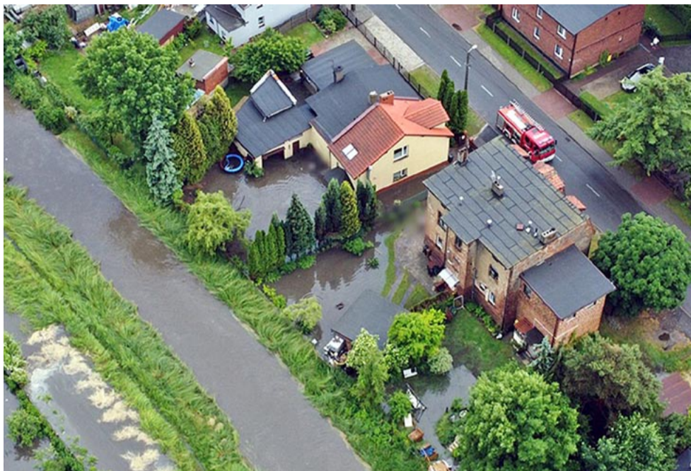
W czerwcu ubiegłego roku wody Potoku tyskiego podtopiły kilka posesji i ogródki działkowe.

PRZEDSTAWICIELE PAŃSTWOWEGO GOSPODARSTWA WODNEGO WODY POLSKIE SPOTKALI SIĘ Z RADNYMI, PRACOWNIKAMI UM I KOMENDANTEM KM PSP W TYCHACH