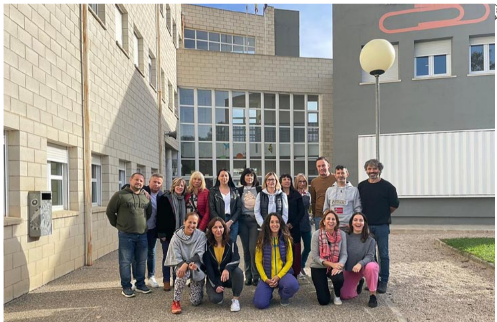
Polscy i hiszpańscy nauczyciele w Valderrobres.

Wspólnie z hiszpańską placówką szkoła liczy na kontynuację rozpoczętej współpracy, wymianę młodzieży i nauczycieli oraz realizację innych międzynarodowych projektów. Niebawem do Tychów zawita grupa kolejna grupa nauczycieli z Półwyspu Iberyjskiego. LS