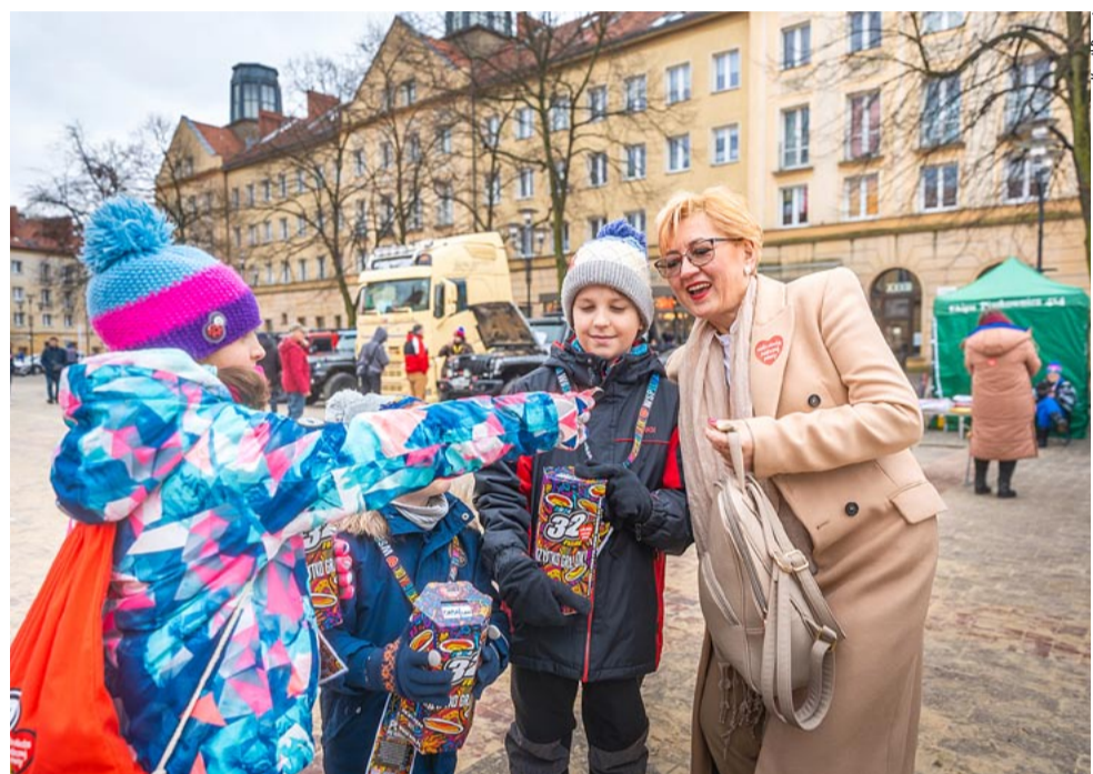
W Tychach dla Orkiestry fundusze zbierało 210 wolontariuszy. To o 10 więcej niż w zeszłym roku.