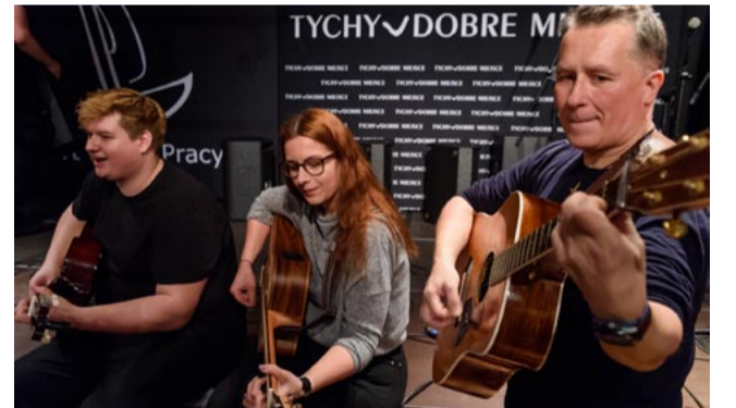
Zwykli ludzie wzięli udział w śpiewankach, czyli swoistym szantowym jam session.