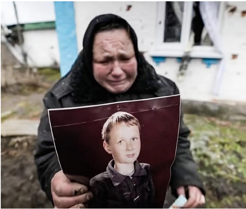
Wojna w Ukrainie nie oszczędza nikogo, jej ofiarami są także dzieci.