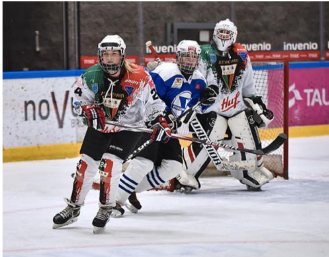
Na Stadionie Zimowym tyskie Atomówki stawiały mocny opór wicemistrzyniom Polski i zremisowały 2:2.

Mimo problemów kadrowych w 1/4 finału play off, tyski zespół zaprezentował się dobrze, choć cel nie został osiągnięty. Teraz Atomówki przystąpią do gry o 5. miejsce. LS ●