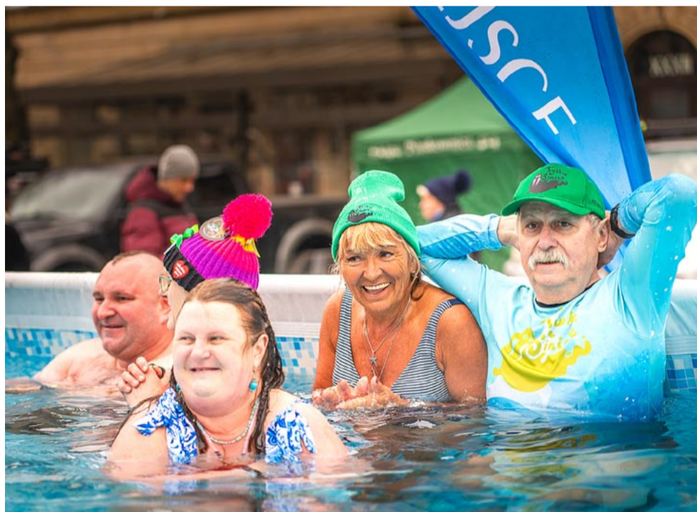
Tyskie Sinice, współorganizator 32. Tyskiego Finału WOŚP, jak co roku zorganizowały basen do morsowania.