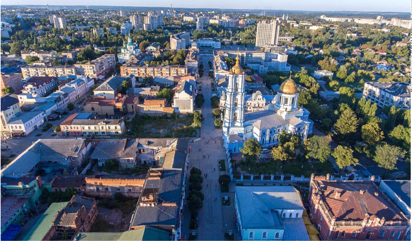
Liczące ponad ćwierć miliona mieszkańców miasto Sumy nie wygląda już tak pięknie jak przed wojną.