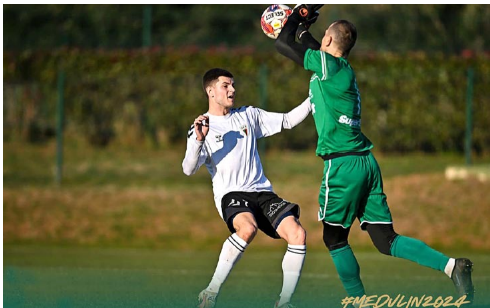
Piłkarze mają w Chorwacji okazję grać i trenować w słońcu i na zielonych boiskach.