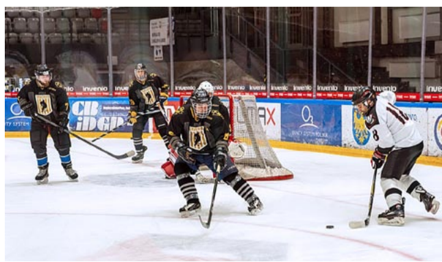
Mecz Wolves – Cracovia.

LEKKA ATLETYKA. 4.02 Pierwszy bieg XVII Grand Prix Tychów w Biegach Długodystansowych 2024 , organizowany przez MOSiR Tychy wspólnie ze Stowarzyszeniem Promocji Lekkiej Atletyki w Tychach. Zapisy i start na terenie KS Paprocany przy ul. Sikorskiego 110. Zapisy w godz. 9-9.45, start biegu o godz. 10. Kobiety i mężczyźni mogą startować na 5 km i na 10 km. LS ●