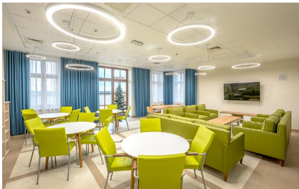
Salon dzienny służyć będzie wspólnemu spędzaniu czasu przez mieszkańców DPS.