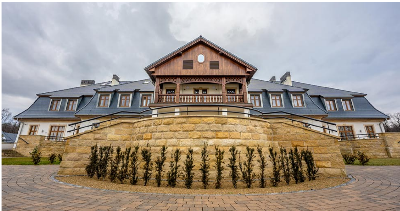
Po rekrutacji pracowników i naborze podopiecznych „Dobre miejsce” w Kobiórze ruszy wreszcie pełną parą.

Galimatias, do jakiego doprowadził, stał się powodem prawdziwej sądowej batalii. WSA w Gliwicach przyjął argumenty wojewody, natomiast miasto odwołało się do ministerstwa rodziny i polityki społecznej, które podtrzymało decyzję wojewody o niewpisaniu DPS do rejestru.