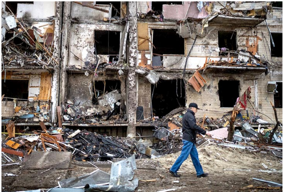
Zbombardowany przez Rosjan budynek w Buczy.

Lokalne władze poinformowały o zorganizowanej ewa-