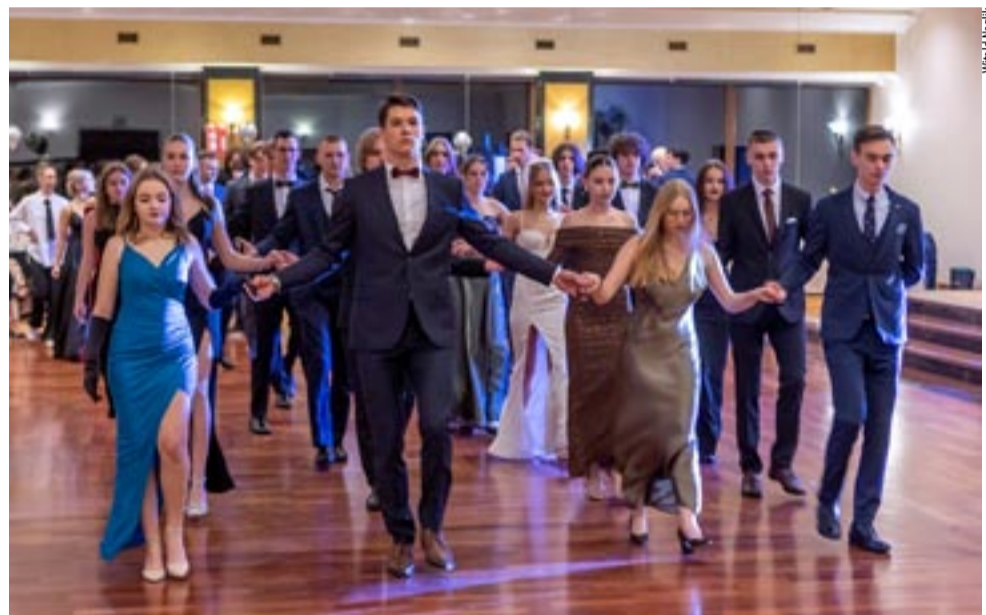
Studniówkowy bal zawsze rozpoczyna tradycyjny polonez. W ZS nr 1 zatańczono go aż siedem razy!

Studniówka to dobry zwyczaj, który zmieniał się przez lata i pewnie będzie się zmieniać. Kiedyś te pierwsze dorosłe bale organizowano w murach szkoły – były o wiele skromniejsze, nie tak wystawne jak obecnie. Ale zawsze towarzyszy im dobra zabawa, która na zawsze pozostanie w pamięci. Studniówka ma być czasem bez troski, bo poprzedza wiele tygodni intensywnych przygotowań do egzaminu dojrzałości, który oficjalnie istnieje w Polsce od 1932 roku. DW