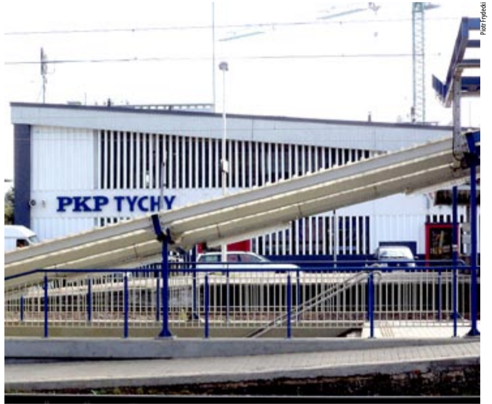
Minie jeszcze sporo czasu, zanim na perony dworca w Tychach będzie można dotrzeć bez „schodowych” problemów.

– PLK SA przewidują ogłoszenie przetargu na prace projektowe w I kwartale 2024 r. Prace projektowe planowane są do realizacji w latach 2024–2027, a prace budowlane w latach 2028–2031, po wcześniejszym pozyskaniu finansowania. Wniosek o dofinansowanie planowany jest do złożenia do końca stycznia 2024 r. – podsumowała Katarzyna Głowacka. NS