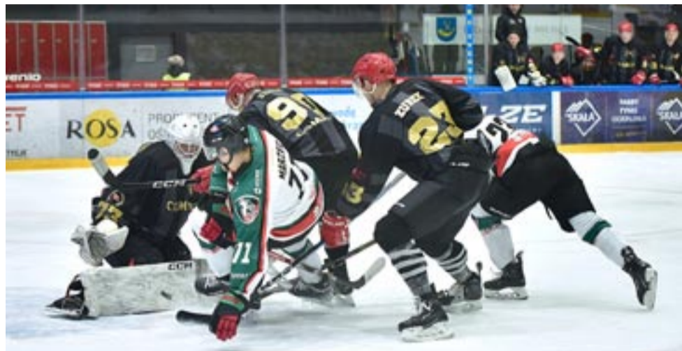
Mecze z Cracovią i JKH GKS Jastrzębie hokeiści GKS rozstrzygnęli w rzutach karnych.