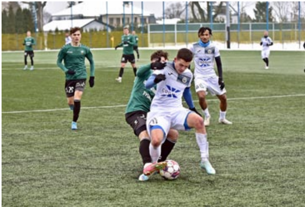
Tyszanie przegrywali już 0:3, ale dogonili rywala i ostatecznie zremisowali z Hutnikiem Kraków.