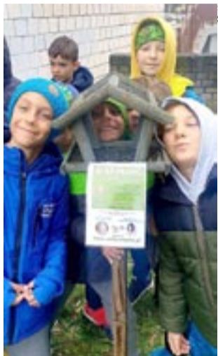
Dzieci z SP 40 z własnej inicjatywy ustawiły karmnik dla ptaków w pobliżu szkoły.

To nie tak, że zwierzętom można rzucić resztki z naszych stołów i jakoś to będzie. W dobie