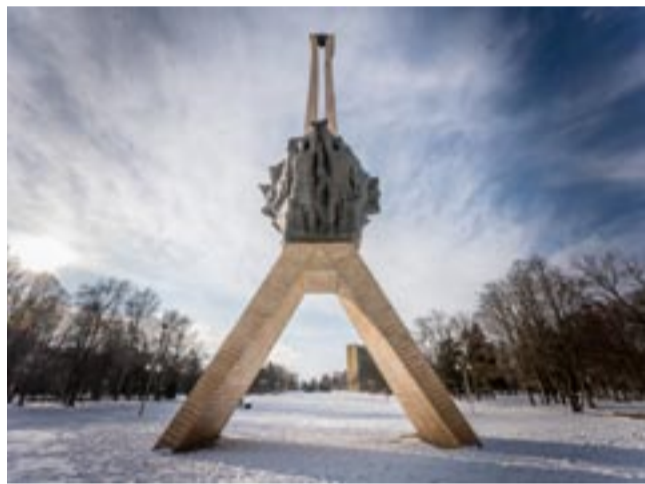
Przy pomniku w Parku Miejskim Solidarność najważniejsze prace zostały już zakończone.

W 2023 roku przygotowany został projekt „Rozszczelnienie nawierzchni Placu Baczyńskiego”, podpisano umowę na aranżację zieleni przy ul. Nałkowskiej, w trakcie realizacji jest utwardzenie terenu przy placu zabaw przy ul. Jaroszewickiej, zakup piaskownicy i obrzeży na skwer przy ul. Cienistej, a ponadto zaplanowano wymianę wzmocnień mechanicznych drzew (elastyczne wiązania zapewniające odpowiednią ochronę drzewom, pozwalając na zachowanie cennych okazów, eliminując zagrożenie dla bezpieczeństwa pieszych). To tylko niektóre z zamierzeń TZUK na 2024 rok. LS