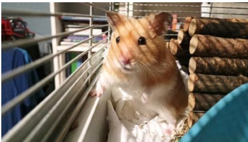
Chomikom trzeba stworzyć jak najbardziej naturalne warunki życia.