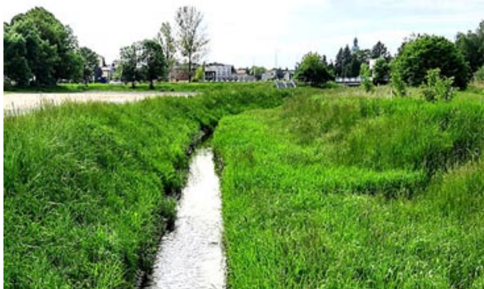
Są w Tychach miejsca, gdzie zarosnięte cieki utrudniają odprowadzanie wody po obfitych opadach.