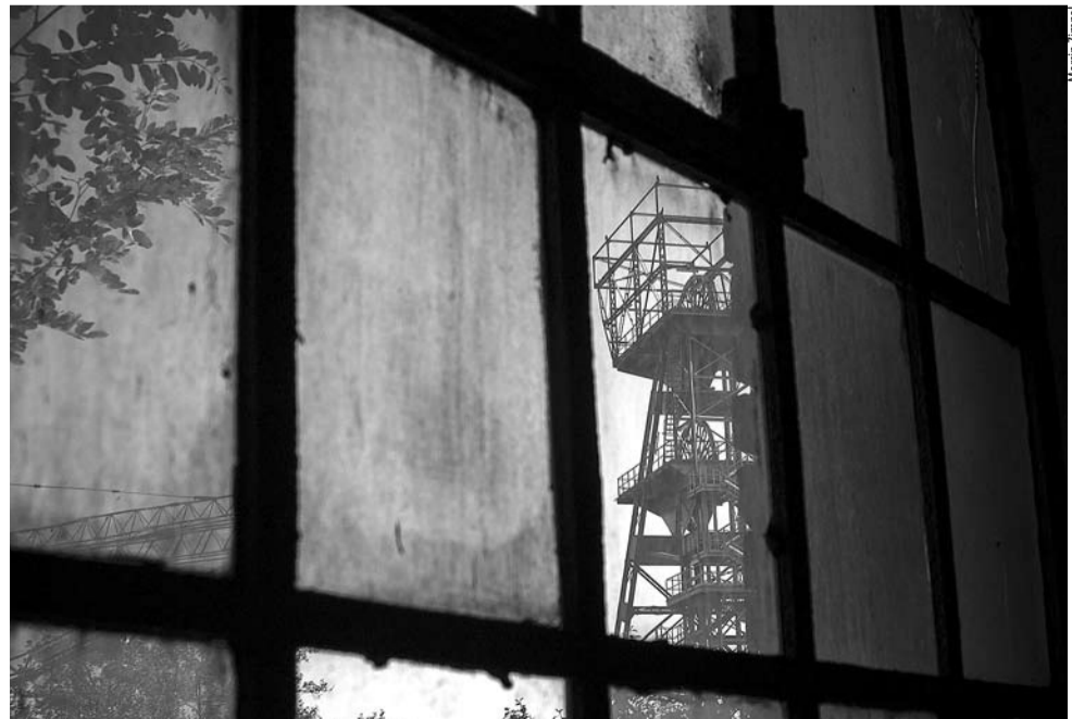
Jedna z fotografii dokumentujących budowę nowej siedziby Muzeum Śląskiego – zabytek „Warszawa II” dawnej kopalni węgla kamiennego „Katowice”, 2012 rok.

Wstęp na środowe oprowadzanie w „Tęczy” (al. Niepodległości 188) jest wolny. WW