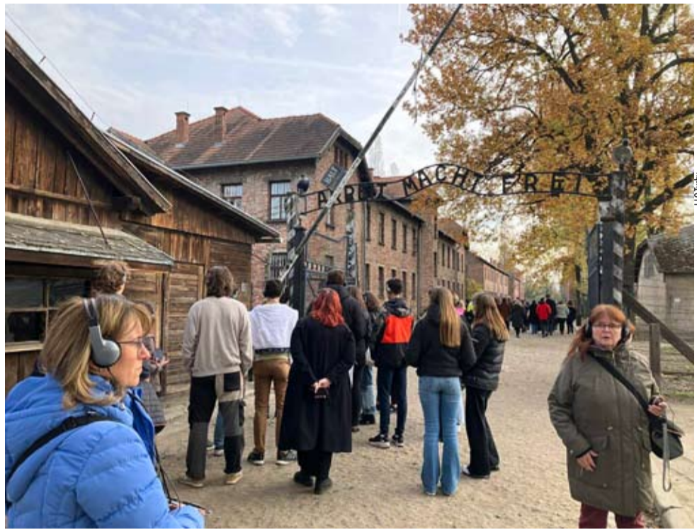
Delegacja z Niemiec przed historyczną bramą KL Auschwitz.