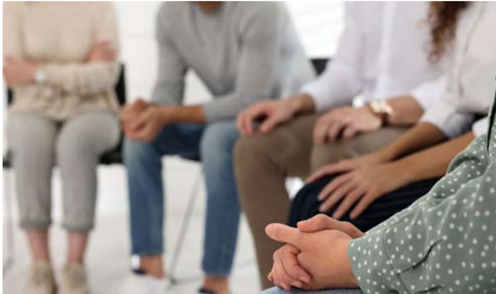
Ważnym elementem terapii są spotkania z ludźmi zmagającymi się z podobnym problemem.

CHOĆ MINĘŁO TYLKO LAT, TO NADAL PAMIĘTAJĄ JAK TO SIĘ ZACZĘŁO. LATA 80. WIĄZAŁY SIĘ Z PEWNEGO RODZAJU SPOŁECZNYM PRZYZWOLENIEM NA SPOŻYWIENIE ALKOHOLU, CHOCIAŻBY W TRAKCIE PRACY. BYŁA TO NIECHLUBNA NORMA, ELEMENT POLSKIEJ KULTURY PICIA, KTÓRY WIELU LUDZI SPROWADZIŁ W SZPONY NAŁOGU I CHOROBY ALKOHOLOWEJ. WÓWCZAS W TYCHACH POMOCY SZUKANO PRZED WSZYSTKIM W PORADNI PRZECIWKOHOLOWEJ. STAMTĄD MOŻNA BYŁO TRAFIĆ NA ODWYK. POZOSTAWAŁO PYTANIE – CO DALEJ?