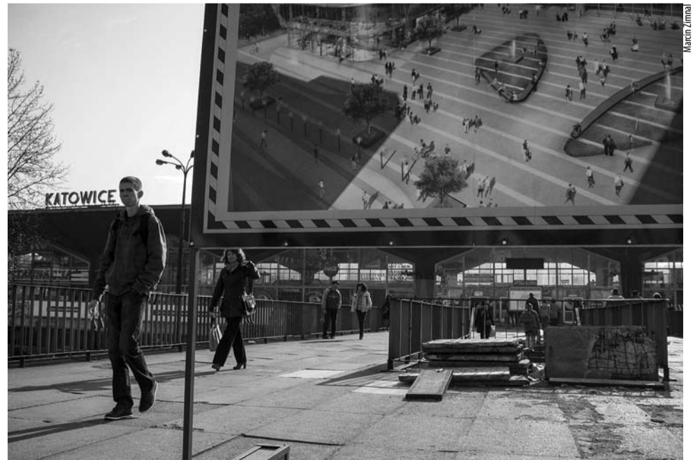
Jedna z fotografii Marcina Zimnala, przedstawiająca nieistniejącą już estakadę przy dworcu PKP w Katowicach.

Projekt realizowany jest w ramach konkursu Tyskie Inicjatywy Kulturalne. WW ●