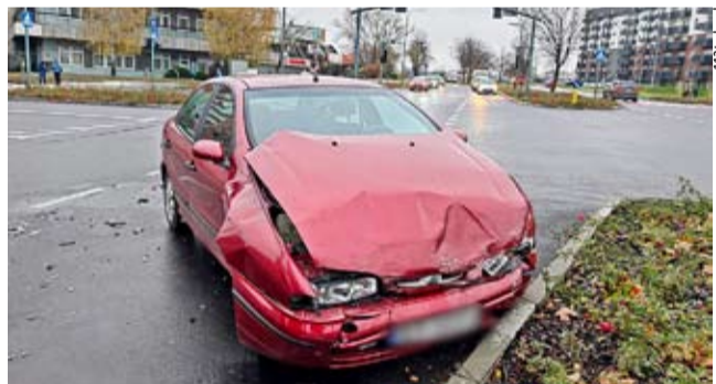
Na skrzyżowaniu al. Bielskiej i ul. Stoczniewców 70 kierująca volvo wymusiła pierwszeństwo na kierowcy fiata.

◆ DYŻURNY KMP TYCHY OTRZYMAŁ ZGŁOSZENIE, że 13.11 w autobusie komunikacji miejskiej na ul. Dmowskiego doszło do upadku pasażerki. Kobieta trafiła pod opiekę przybyłych na miejsce ratowników medycznych. Z ustaleń policji wynika, że pasażerka wstała z miejsca zanim autobus wjechał na zatokę przystankową i wówczas straciła równowagę i upadła. Pasażerka doznała urazów i została przewieziona do szpitala. LS ●