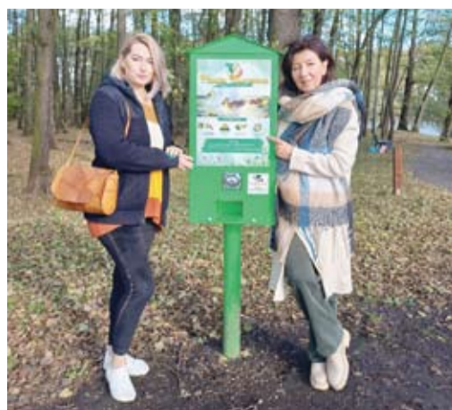
Takie oto automaty z ziarnami stoją w tyskich parkach. Zachęcamy do używania.