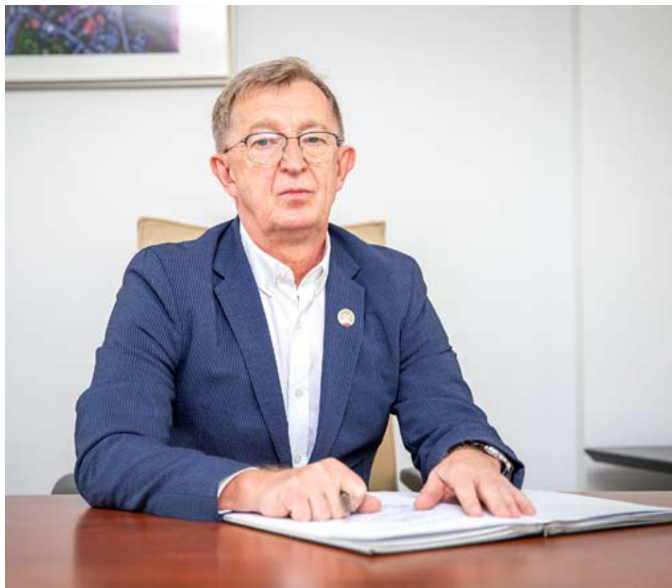
Bogdan Białowos przejął obowiązki prezydenta Tychów 14 listopada.