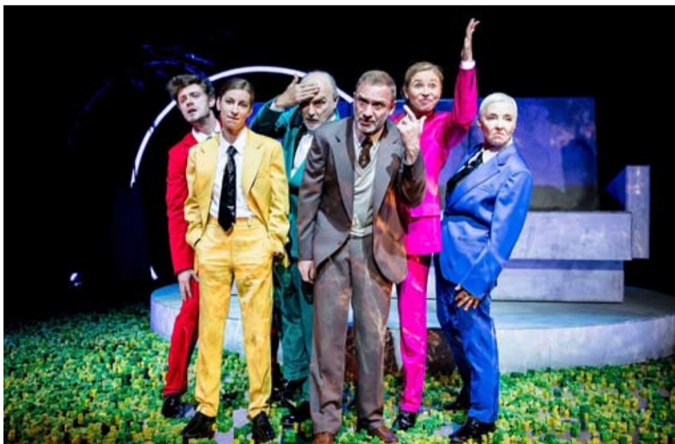
Obsada „Dnia świra” ze stołecznego Teatru Ateneum.

III Międzypokoleniowy Konkurs Tańca Amatorskiego.