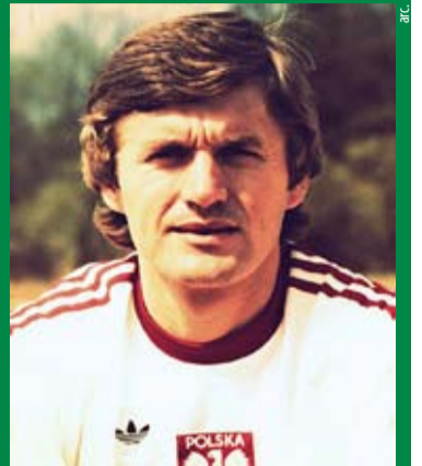
Włodzisław Lubański w koszulce z orłem na piersiach przywdziewał 75 razy.