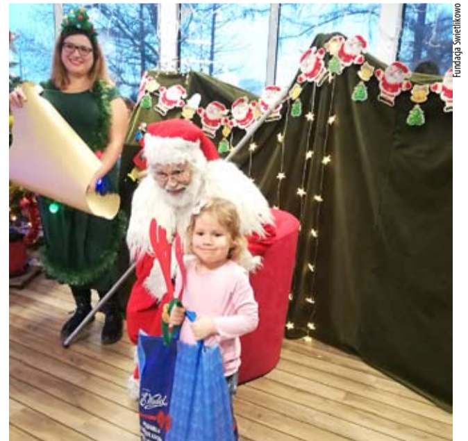
Podopieczni Hospicjum Świetlikowo jak co roku czekają na wizytę św. Mikołaja z prezentami.

opieczni otrzymują swój wymarzony i opisany lub namalowany prezent, a ich rodzeństwo – paczki ze słodyczami. Prezenty rozdawane są przez Mikołaja podczas przyjęcia, natomiast do dzieci, które ze względu na stan zdrowia nie mogą dotrzeć na spotkanie, przyjeżdża do domu Mikołaj, Elf i Aniołek. To wyjątkowa inicjatywa, która choć na chwilę pozwala zapomnieć o życiu z chorobą. NS