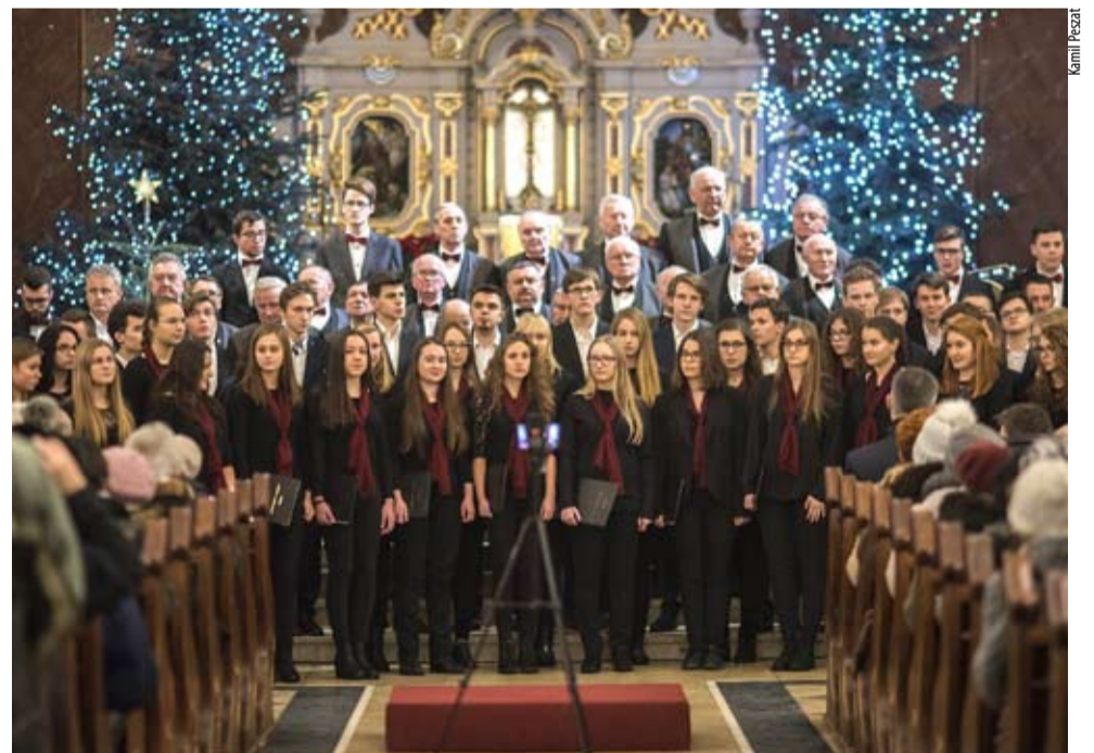
Każdego roku koncert galowy, podsumowujący Tyskie Wieczory Kołędowe, jest wielkim wydarzeniem, nie tylko muzycznym.