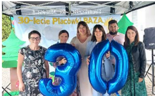
Szefowa Bazy (pierwsza z lewej) ze współpracownikami podczas jubileuszowego spotkania.

– Dzieci podzielone są na grupy wiekowe. W trakcie roku szkolnego zajęcia odbywają się po lekcjach, jednak jak co roku wychodzimy także w kierunku potrzeb naszych podopiecznych, którzy coraz częściej mają popołudniowe plany lekcji – mogą oni skorzystać z zajęć i pomocy w Bazie przed swoimi zajęciami w szkole. W placówce oprócz specjalistów, pedagogów, zatrudniony jest także psycholog, który zapewnia dzieciom indywidualne wsparcie w rozwiązywaniu bieżących trudności emocjonalnych. Organizujemy zajęcia w zakresie treningu umiejętności społecznych, arteterapii, socjoterapeutyczne, profilaktyczne, korekcyjno-kompensacyjne oraz wszelkie aktywności związane z ruchem, zabawą i kreatywnością dostosowane do wieku i zainteresowań. Rodzicom zwykle bardzo zależy na pomocy dzieciom w nauce i oczywiście – taka forma pomocy jest u nas dostępna. Część naszych podopiecznych to dzieci z konkretnymi diagnozami i opiniami poradni psychologicznych, które potrzebują więcej czasu na przyswojenie materiału ze szkoły, a Baza doskonale im to umożliwia. Co ważne, placówka jest otwarta również w czasie ferii zimowych i wakacji letnich. Organizujemy wówczas półkolonie, wyjazdy i wycieczki – wszystkie te aktywności są nieodpłatne, finansowane z budżetu miasta. Zwracamy uwagę na integrację grup z obu naszych filii. Pomagamy w rozwiązywaniu problemów rówieśniczych,