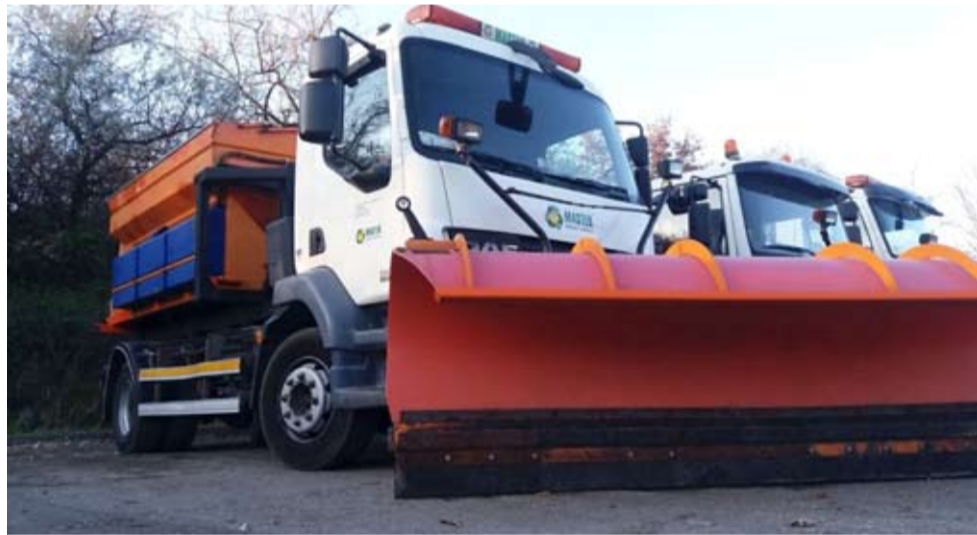
Specjalistyczny sprzęt już czeka w gotowości do zimy.

i gminnych w mieście (położonych na wschód od ul. Bielskiej) oraz utrzymanie chodników, ście-