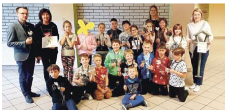
W SP 40 podczas warsztatów m.in. dzieci poznały 20 gatunków ptaków z ich okolicy, na koniec przekazałyśmy duży karmnik do szkolnego ogrodu.