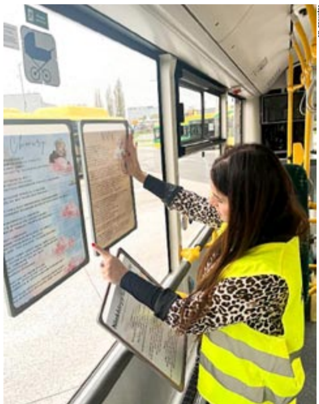
Pomysłodawczyni akcji umieszcza plakaty z wierszami w „dwójce”.

Młodzi tyszańscy w szkolnych korytarzach przechwalają się komu udało się trafić na „Autobus Szyborskiej”. Być może w tym roku uda się zrealizować jeszcze jedną inicjatywę poświęconą poetce – chodzi o „zamknięcie” wybranego wiersza (a właściwie jego interpretacji) w słoiku, poprzez umieszczenie w nim różnych przedmiotów. Celem akcji jest pokazanie poezji bez użycia słów. W końcu, jak pisała sama poetka – „niektórzy lubią poezję” i to wcale nie dlatego, że w szkole tak wypada. NS ●