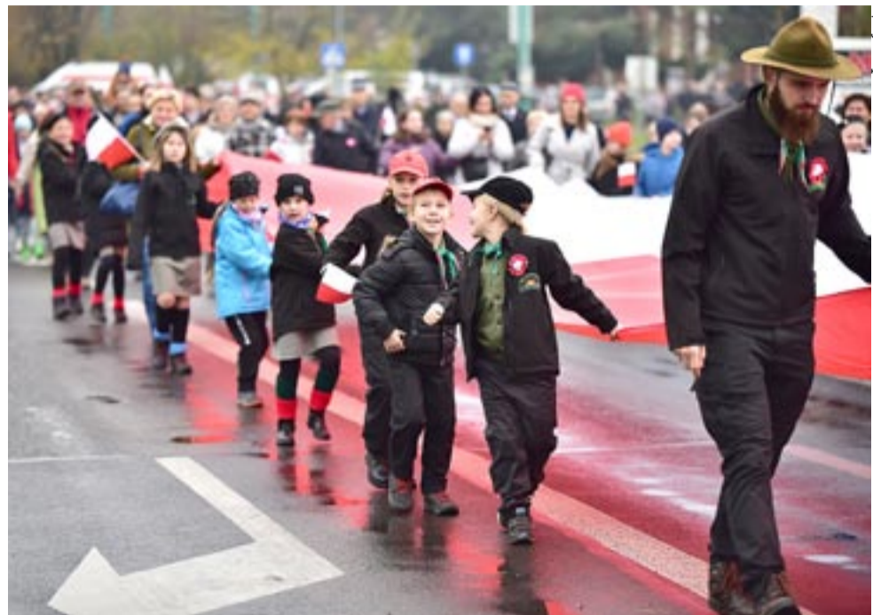
Stumetrową białą-czerwoną pomagali nieść m.in. najmłodsi tyscy harcerze.

O innych imprezach związanych z Narodowym Świętem Niepodległości piszemy także na stronie 8. MN ●