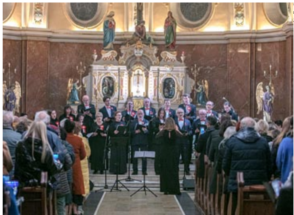
W koncercie wieńczącym obchody w kościele pw. św. Marii Magdaleny wystąpił chór Presto Cantabile.