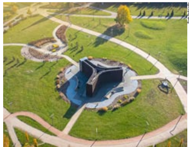
Kolejna okazja do inhalacji w parku przy parafii bł. Karoliny dopiero na wiosnę przyszłego roku.