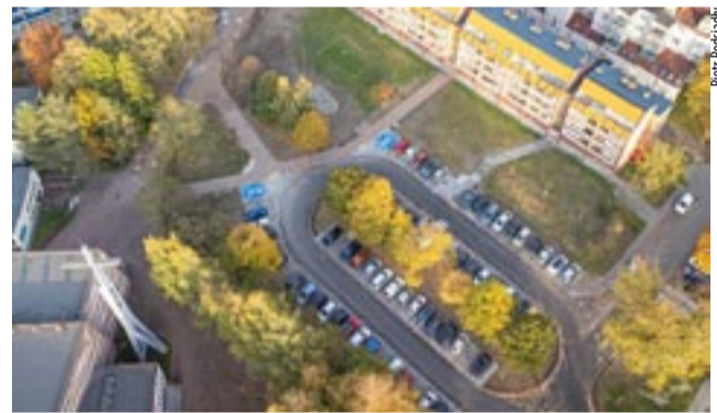
Plac przy kościele św. Jana Chrzciciela zyskał nowe miejsca parkingowe i bardziej ekologiczny wizerunek.

By teren inwestycji był kojarzony z nazwą jaką nosi – plac Konstytucji 3 Maja, umieszczone zostały stosowne tablice informacyjne. Dla podkreślenia charakteru miejsca oraz stworzenia przestrzeni do obchodów świąt państwowych na placu staną flagi maszt flagowy. MN ●