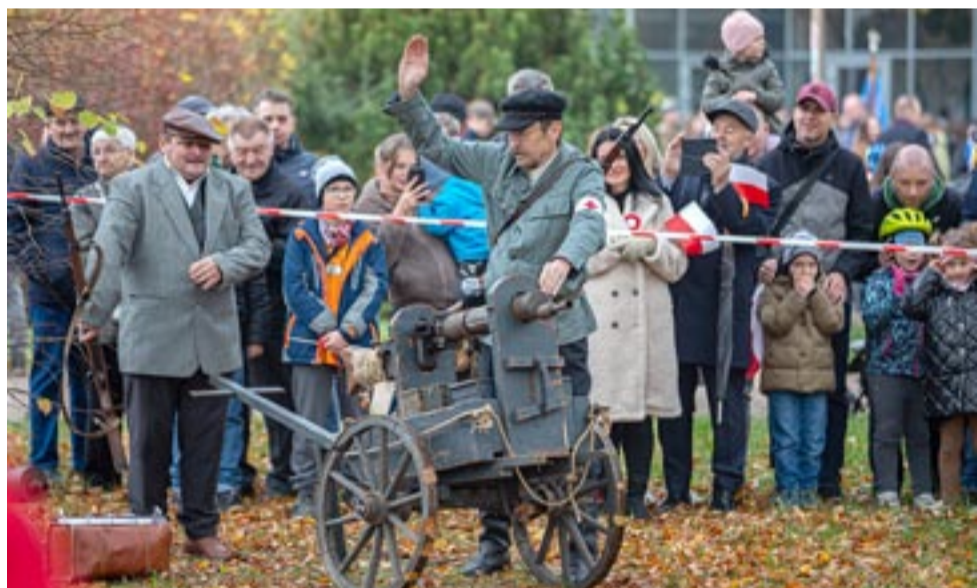
Uczestnicy uroczystości pod Pomnikiem Niepodległości zobaczyli rekonstrukcję potyczki powstańców śląskich z Grenzschutzem.