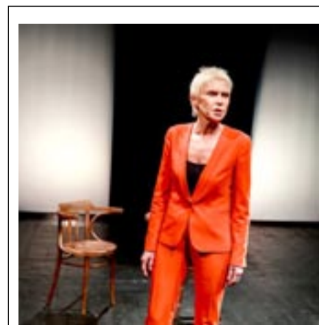
15 LISTOPADA, GODZ. 18: SPOTKANIE Z AKTORKĄ EWĄ BŁASZCZYK, MEDIATEKA