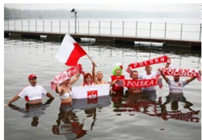
Morsy z klubu Tyskie Sinice rocznicę odzyskania niepodległości uczcili kąpielą w Jeziorze Paprocańskim.

lejny okazało się, że Święto Niepodległości to nie tylko okazja do patriotycznych uroczystości, koncertów, czy też wydarzeń kulturalnych, ale i do aktywności sportowej. AJ ●