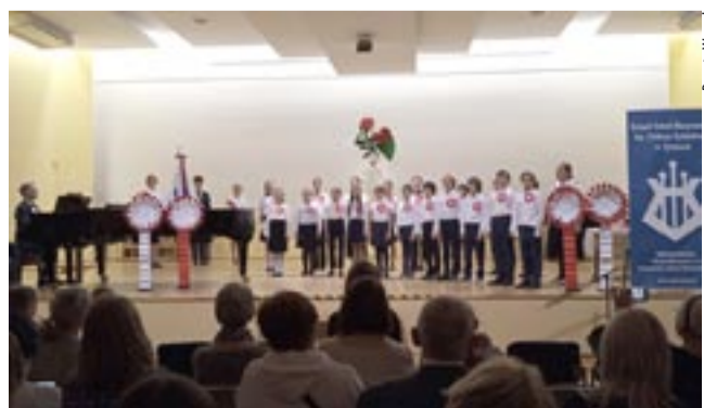
Jak przystało na szkołę muzyczną, Narodowe Święto Niepodległości uczczono koncertem.

Uniwersytetu Trzeciego Wieku. Wszyscy goście otrzymali na powitanie biało-czerwone kotyliony z orłem. DW