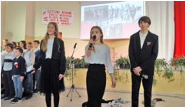
Fragment koncertu w Szkole Podstawowej nr 37.

Młodzież stanęła na wysokości zadania – było wyjątkowo i głośno, aż niejednemu ze słuchaczy zakręciła się łezka w oku. Tyscy uczniowie być może na co dzień