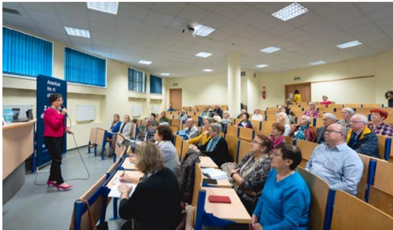
Spotkanie w Klubie Pacjenta cieszyło się sporym zainteresowaniem tyskich seniorów.

– Niewydolność serca to stan, w którym serce nie jest w stanie