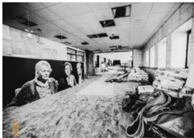
Na razie wnętrze Teatru Małego wygląda tak, ale już za rok będzie pięknie.

Koszt zadania „Termomodernizacja i modernizacja Teatru Małego w Tychach wraz z przebudową strefy wejściowej i zagospodarowaniem terenu” wynosi ponad 25,5 miliona złotych. Nieco ponad 21 milionów złotych to środki pozyskane z Rządowego Funduszu Polski Ład. NS