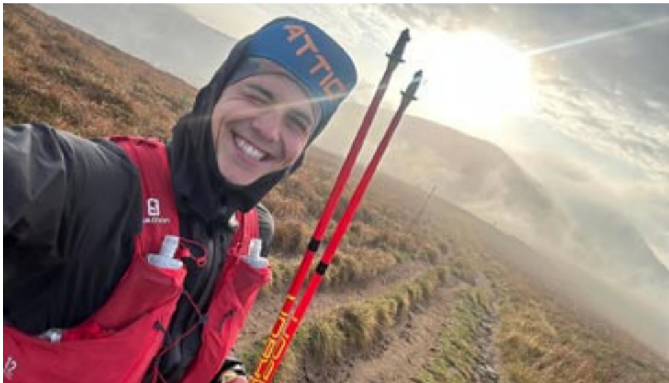
Dopiero co wrócił z górskich szlaków, a już czeka go kolejna, tym razem wodna przygoda.

TYSZANIN PRZEBIEGŁ GŁÓWNY SZLAK BESKIDZKI – PONAD 500 KM. CHWILĘ PÓŹNIEJ ZOSTAŁ POWOŁANY DO KADRY NARODOWEJ NA ZBLIŻAJĄCE SIĘ ZIMOWE MISTRZOSTWA EUROPY.