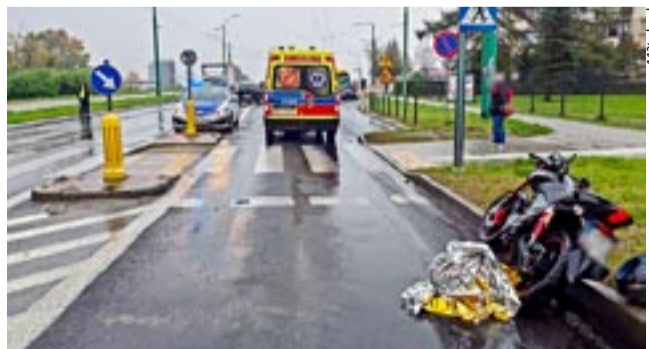
W piątkowym wypadku na ulicy Harcerskiej ucierpiał nieposiadający uprawnień motocyklista, w krwi którego stwierdzono obecność alkoholu.

głowcu oraz w Domu Parafialnym parafii św. Marii Magdaleny w Tychach. Zebrane środki zostaną przeznaczone na rzecz utrzymania Domu Hospicyjnego przy ul. Żorskiej 17, który powstał jako votum wdzięczności za Pontyfikat św. Jana Pawła II. 24. Kwstę Listopadową można wesprzeć również online wchodząc na stronę internetową www.hospicjum.tychy.pl w zakładkę – kwestuj online. MN