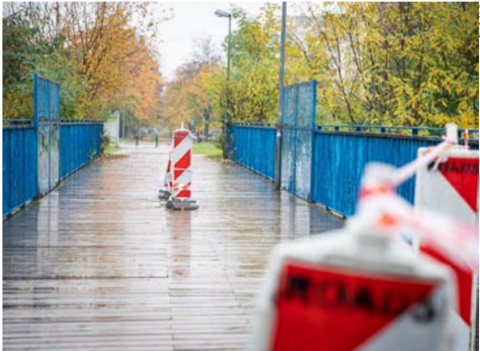
W miniony poniedziałek, 30 października kładka w ciągu ul. Darwinia została zamknięta dla ruchu.

Przypomnijmy, że w 2022 roku, w ramach modernizacji wiaduktu na ul. Grota Roweckiego, do użytku oddana została zupełnie nowa kładka pieszo-rowerowa. Obiekt znajduje się w bezpośrednim sąsiedztwie wspomnianego wiaduktu, po jego wschodniej stronie i może stanowić alternatywne przejście dla kładki, która została zamknięta. Infrastrukturę komunikacyjną w tym zakresie uzupełnią jeszcze wiadukt na ul. Wyszyńskiego. MN ●