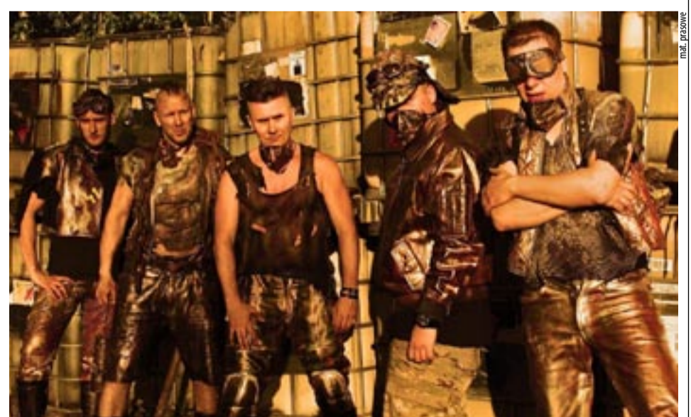
3 LISTOPADA, GODZ. 20: OBERSCHLESIEN – KONCERT, ART MUSIC CLUB

GODZ. 18 – ANDROMEDA – KINO, JAKIE ZNAMY: projekcja filmu „Nitram” (Pasaż Kultury Andromeda, pl. Baczyńskiego)