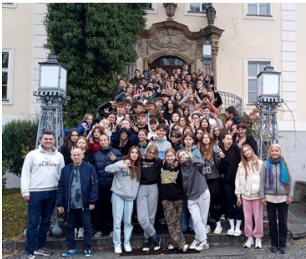
Wspólna fotografia młodzieży z Tychów i Stuttgartu.