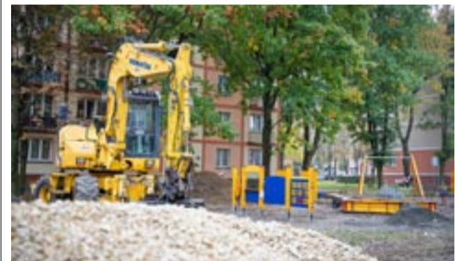
Plac zabaw powstaje w ramach Budżetu Obywatelskiego.

Zakończenie prac nastąpi do 30 listopada. Koszt inwestycji to 182 tysiące złotych. MN