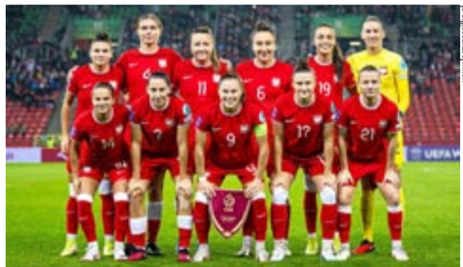
Reprezentacja Polski przed zwycięskim meczem z Serbią na stadionie w Tychach.

Po spotkaniu w Tychach reprezentacja Polski z kompletem 9 punktów przewodzi w swojej grupie, wyprzedzając Serbię (6 pkt), Grecję (3 pkt) i Ukrainę (0 pkt). WW