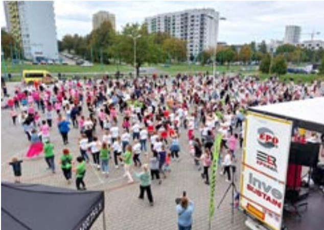
Próba pobicia rekordu Guinnessa w tańcu Jerusalema nie powiodła się, ale i tak kilkaset osób świetnie się bawiło.

– Cycki są fajne. Dbajcie o nie, drogie panie – rozpoczął radny ginekolog. – Rak piersi to najczęstszy złośliwy nowotwór u kobiet. W 2020 r. w Polsce zdiagnozowano go u 25 tys. osób czyli u co ósmej kobiety. Około 9 tys.