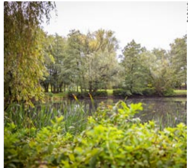
Park Łabędzi ma, według przygotowanej koncepcji rewitalizacji, zachować swój głównie przyrodniczy i rekreacyjny charakter.

Głosy mieszkańców wyraźnie zaznaczają, jak ważne są tereny rekreacyjne i spacerowe. Potrzeba odetchnięcia od zgiełku miasta to jeden z podstawowych postulatów miłośników aktywnego spędzania czasu. Kiedy inwestycja zostanie zrealizowana, na zielonej mapie Tychów na nowo będzie można zaznaczyć zapomniany Park Łabędzi. NS