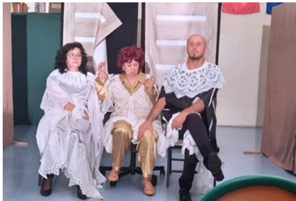
Fragment spektaklu „Chora z urojenia” w wykonaniu Zespołu Teatralnego DoRo z Urbanowice.