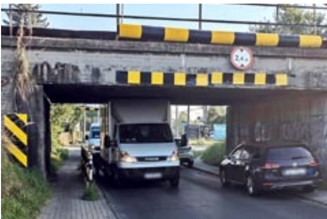
Jeden z wielu przypadków zaklinowania się auta pod wiaduktem na Glincańskiej.