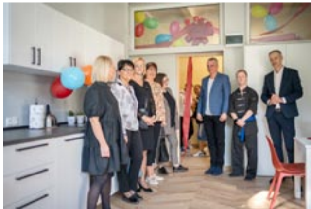
Przy okazji święta w Zespole Szkół Specjalnych nr 8 otwarto nową pracownię gospodarstwa domowego.

Dzień Edukacji Narodowej tradycyjnie nazywany jest Dniem Nauczyciela. Nazwa Dzień Edukacji Narodowej funkcjonuje od 1982 roku jako święto wszystkich pracowników oświaty. Wprowadzono je ustawą – Karta Nauczyciela z 1982 r. MN ●