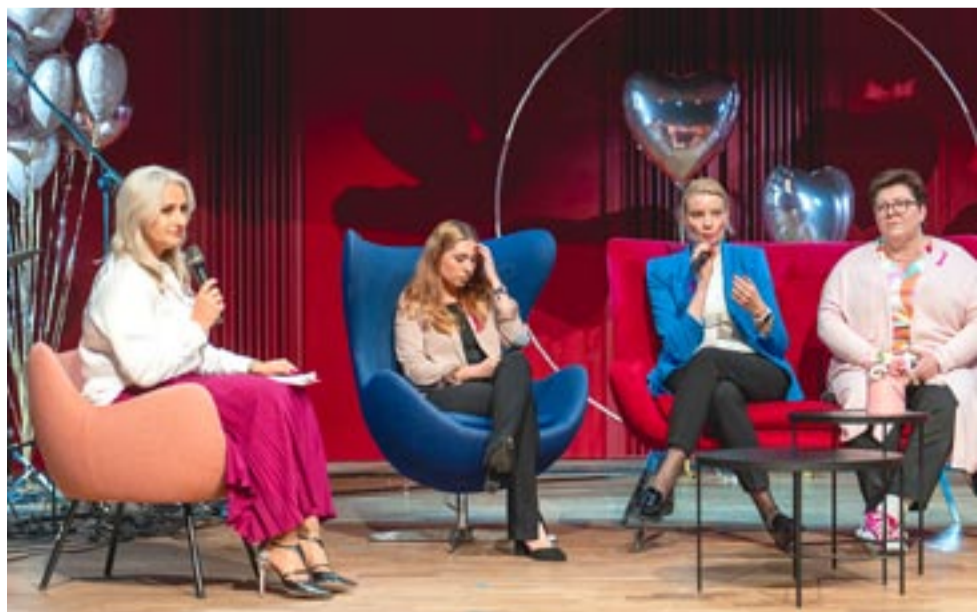
Podczas konferencji odbyły się liczne panele eksperckie, m.in. na temat ciała, umysłu i duszy pacjentek onkologicznych.

Spotkanie w Klubie Pacjenta rozpocznie się w piątek o godz. 11 w auli UTW przy ul. Ciasnej 3. Wydarzenie jest otwarte, wstęp wolny. WW