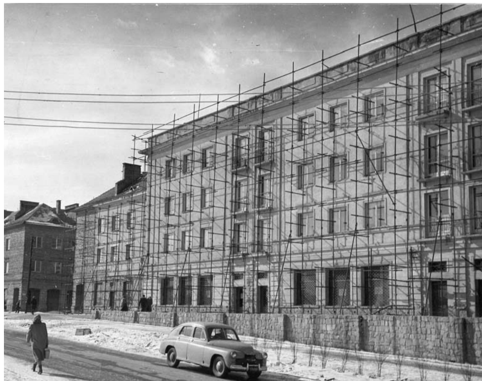
Budowa osiedla A, widok od strony ulicy Armii Czerwonej (obecnie ul. Arctowskiego), ok. 1955 r.

W piśmie Zarządu Gminy Tychy do Urzędu Śląskiego Wojewódzkiego w Katowicach z dnia 14 października 1949 roku wymienionych zostało wiele argumentów mających przemawiać za przyznaniem Tychom praw miejskich. Jako pierwszy argument podano przemysłowy charakter Tychów (sic!) będących wówczas jedną z największych gmin w powiecie pszczyńskim. Warto jednak zwrócić uwagę, że w piśmie tym zarząd odnosił się do ówczesnego obszaru