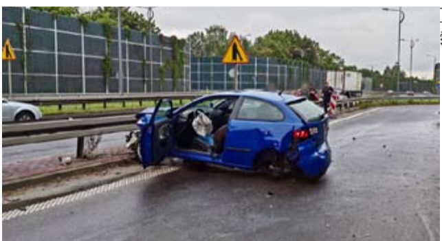
Kierująca seatem uderzyła w bariery energochłonne na DK 1.

24.09 DYŻURNY KOMENDY MIEJSKIEJ PSP OTRZYMAŁ ZGŁOSZENIE o pożarze na balkonie mieszkania (II piętro) w budynku wielorodzinnym przy ul. Edukacji 62. Jak się okazało doszło do pożaru doniczki na balkonie jednego z mieszkań i został on ugaszony przez lokatorkę mieszkania przed przyjazdem strażaków. LS