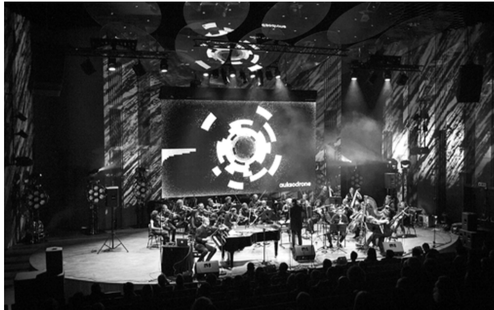
Festiwal Auksodrone odbędzie się w Mediatece od 6 do 8 października.

Nurt jazzowy wypełnią dwa koncerty orkiestry Aukso wraz