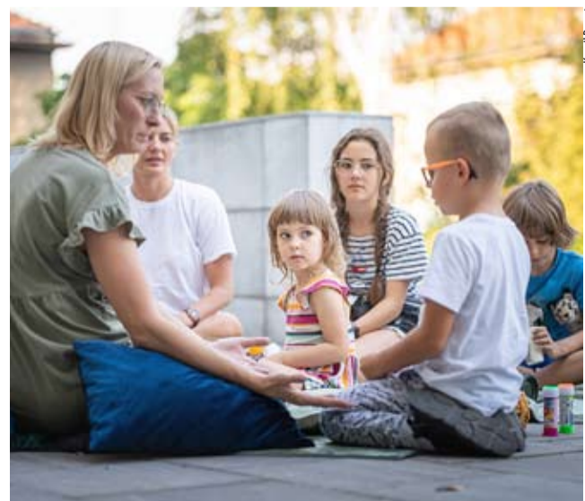
Organizowane przez fundację spotkania odbywają się w siedzibie Miejskiego Centrum Kultury.

Kolejne spotkanie odbędzie się 10 października i dotyczyć będzie trudności w dziecięcym rozwoju. 14 listopada poruszony zostanie temat autystycznego spektrum, podczas ostatniego grudniowego spotkania eksperci przyglądają się zaletom bajkoterapii. Warsztaty w MCK odbywają się w stałych godzinach 16.30-19.30. MN