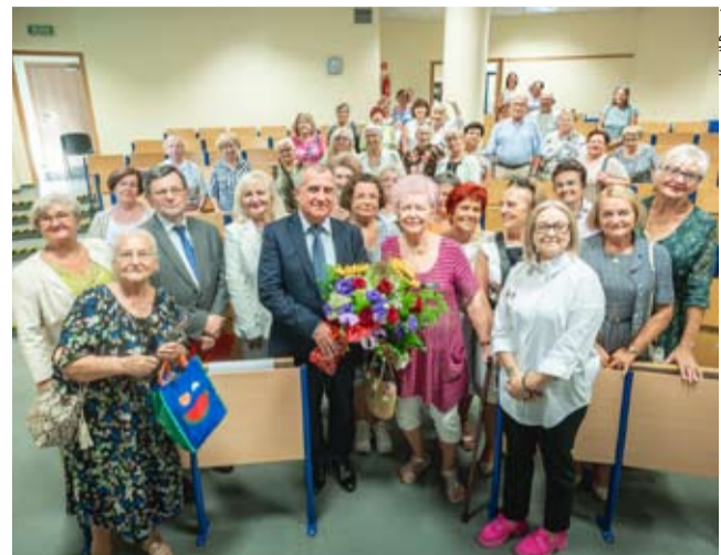
Pamiętkowe zdjęcie gości i słuchaczy tyskiego uniwersytetu.

samorządowi osiągnąć w Polsce, a zwłaszcza w Tychach. Dziś mamy najniższe bezrobocie w regionie, stabilną sytuację finansową, pomimo tego, że rząd, do czego ma prawo, cały czas uszczupla nasze źródła finansowe, a dodaje zadań. Założenia idei samorządności wciąż są aktualne jak nigdy, bo problemy w Tychach to nasze tyskie problemy i trudno, aby o sposobach ich rozwiązywania decydowała Warszawa. Dziura na drodze to jest nasza tyska dziura, a nie dziura PiS-u, Platformy czy innej aktualnie rządzącej partii. Niestety, samorządność jest zagrożona jak nigdy wcześniej, dlatego też za namową i poparciem kolegów samorządowców postanowiłem kandydować na senatora RP, by móc tam podzielić się swoim doświadczeniem – mówił prezydent.