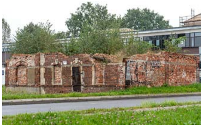
Miasto wykupiło teren i wkrótce rudera przestanie szpecić okolice Rynku.

Gala 25-lecia Samorządu Województwa Śląskiego.