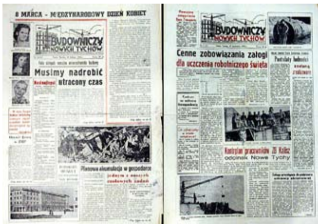
Archiwalne egzemplarze „Budowniczego Nowych Tychów”, przekazane do Muzeum Miejskiego.