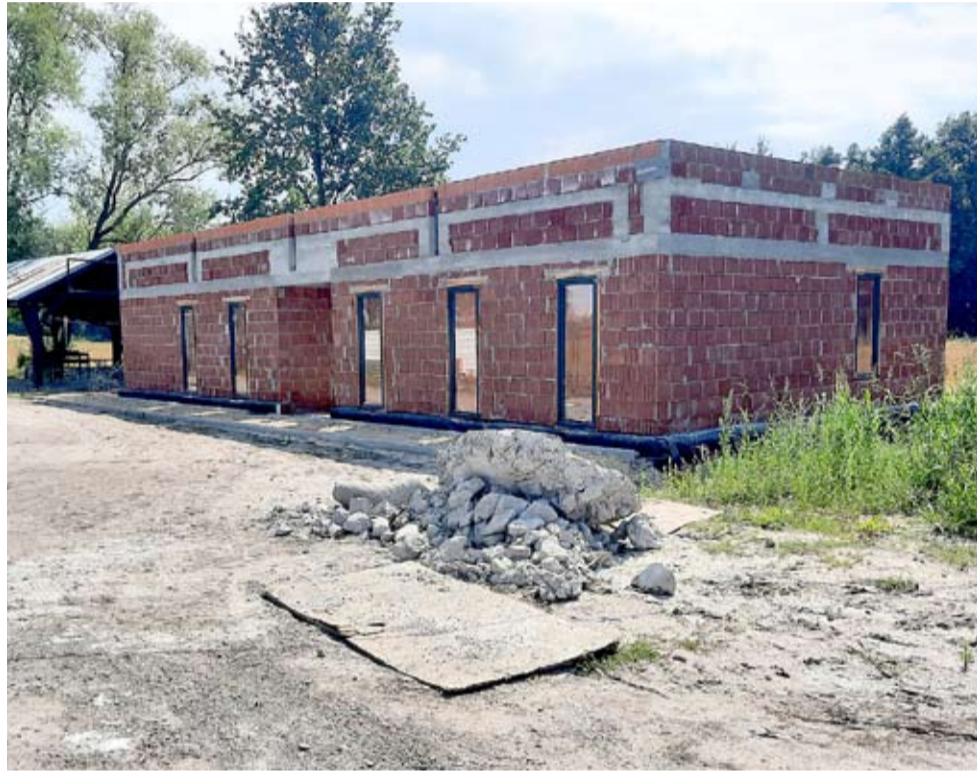
Jeszcze w tym roku piłkarze Ogrodni-ka mają się wprowadzić do nowego budynku klubowego.

Cielmiczanie czekają zatem na nowy obiekt, w którym znajdą się szatnie, pomieszczenie dla sędziów i zaplecze socjalne. LS