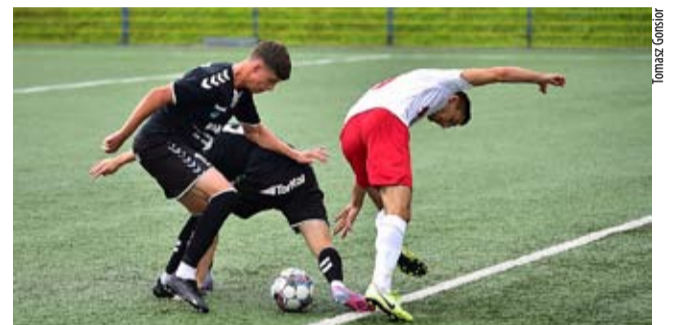
Gole w ostatnich akcjach obu części gry dały rezerwom zwycięstwo.