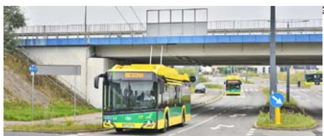
Przy ul. Sikorskiego dobudowano brakujący odcinek sieci pod wiaduktem.

– Przed nami kolejne modernizacje, których efektem będzie większa niezawodność komunikacji trolejbusowej oraz poprawa komfortu podróży – mówi dyrekcja TLT. MN ●