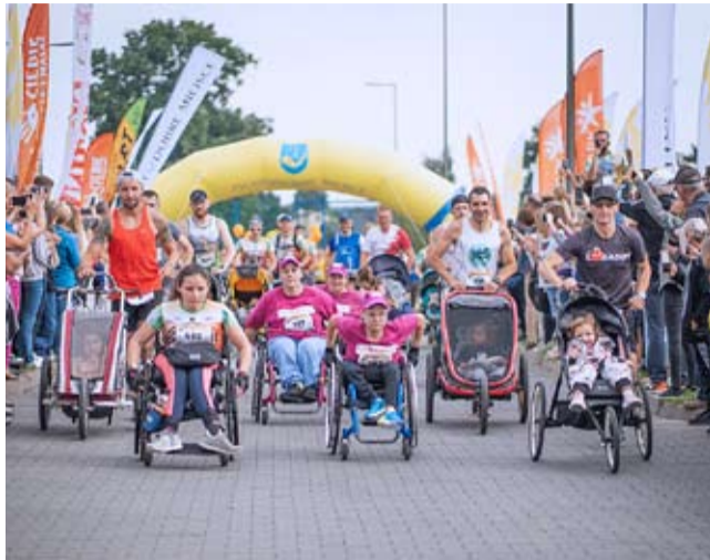
Jak co roku, na starcie Tyskiego Półmaratonu nie zabrakło sportowców na wózkach.