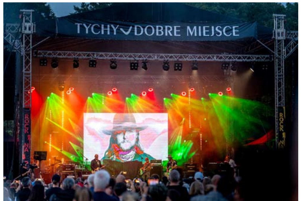
Podczas koncertu zespołu Cree, ale także i Dżemu, duch Ryska Riedla pojawiał się nie tylko na wielkim telebimie.

Imprezę wzorowo zorganizowało Miejskie Centrum Kultury, które zadbało m.in. o komfortowe miejsca dla niepełnosprawnych, gastronomię a nawet... kawałek plaży w centralnym tyskim parku. WW ●