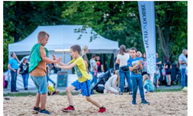
Aby przybliżyć klimat poprzednich, paprociańskich edycji Rocka na Plaży, do Parku Miejskiego Solidarności przywieziono kilkanaście ton piasku.