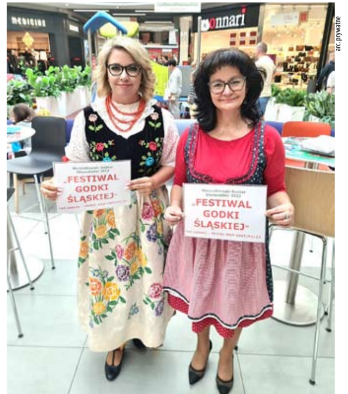
Na projekt Rady Osiedla Cielmice głosować można jeszcze tylko tydzień.

nią ciekawą imprezę. Festiwal będzie miał charakter festynu rodzinnego i prowadzony będzie po śląsku. Zaplanowano występ kabaretu w gwarze śląskiej oraz zespołów z powiatu bieruńskolędzińskiego, pszczyńskiego lub miasta Tychy. Ponadto zaproszone zostaną osoby które będą miały krótkie monologi – stand-upy. Będą też konkursy ze znajomości godki śląskiej, a festyn zakończy się wspólną zabawą taneczną przy muzyce biesiadnej. LS