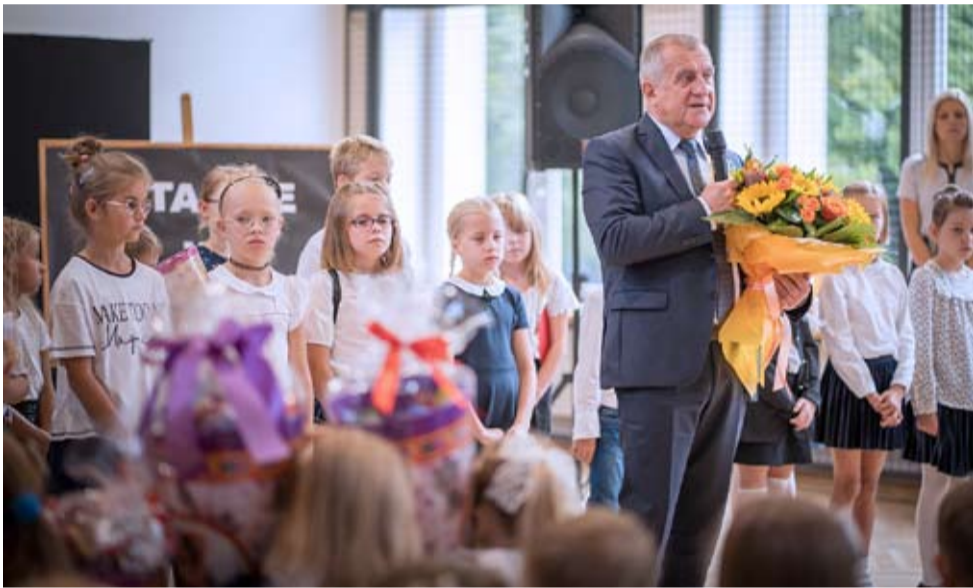
– Mamy dobre warunki w szkołach i znakomitą kadrę dydaktyczną – zapewniał prezydent Andrzej Dziuba.

W Tychach naukę rozpoczęło w poniedziałek 14.822 uczniów, niemal dokładnie tyle samo co przed rokiem. W gronie 9250 dzieci w szkołach podstawowych jest 1270 „pierwszaków”. Nowy rok przedszkolny rozpoczynają także maluchy z tyskich przedszkoli, których jest około 3070. MN ●