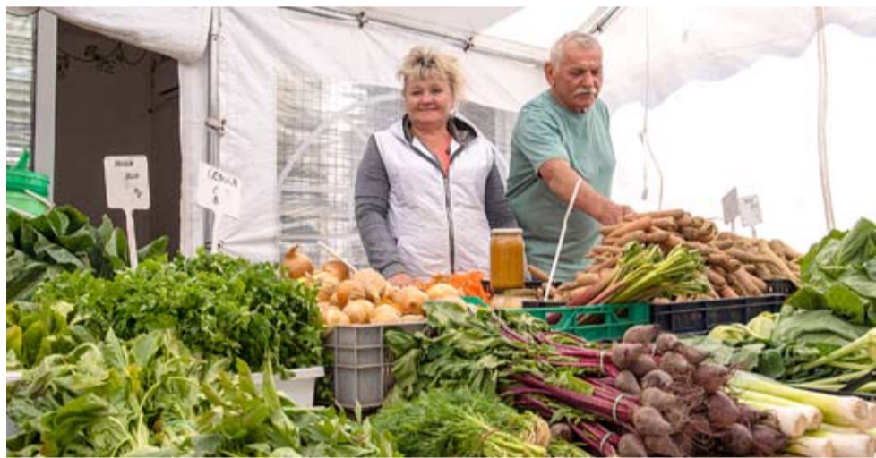
Produkty na stoisku państwa Binek zawsze są najwyższej jakości.