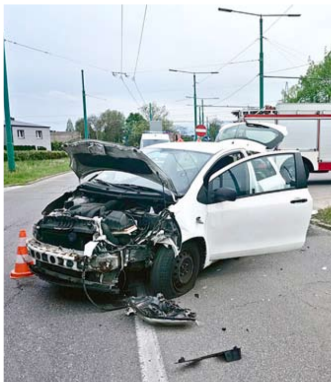
Tak wygląda jeden z dwóch samochodów, które zderzyły się na skrzyżowaniu ulic Sikorskiego i Paprocańskiej.