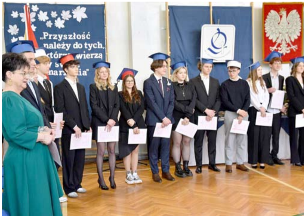
W popularnym „Kruczku”, czyli LO nr 1 dopiero co pożegnano tegorocznych absolwentów, a już szkoła gotuje się na przyjęcie nowych uczniów i uczniów.

Między 23 czerwca a 10 lipca trzeba będzie uzupełnić wniosek o świadectwo ukończenia szkoły podstawowej i zaświadczenie o wyniku egzaminu ósmoklasisty. Publikację list uczniów zakwalifikowanych zaplanowano na 18 lipca, zaś ostateczną listę uczniów przyjętych i nieprzyjętych (po potwierdzeniu przez kandydatów woli podjęcia nauki) każda szkoła średnia opublikuje 26 lipca o godz. 14. Wtedy każdy tegoroczny absolwent podstawówki będzie mógł ze spokojną głową i sercem kontynuować wakacje. WW ●