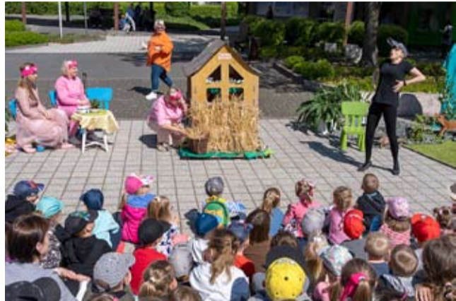
Przedstawienie o świnkach i wilku w wykonaniu tyskich bibliotekarek.