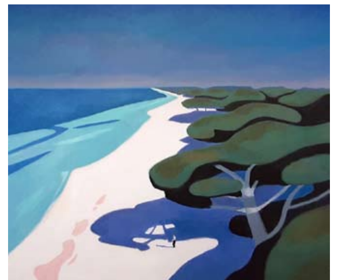
Jeden z obrazów z cyklu „Dreamscapes” Roberto Abta.