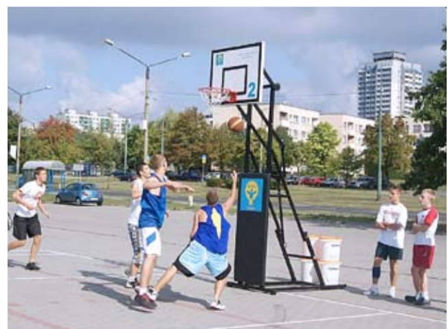
W tym roku rozegrana zostanie jubileuszowa 15. edycja zawodów w streetballu.

w następujących kategoriach: 2012 i młodszy, 2010–2011, 2006–2009 oraz open mężczyźni i open kobiety. W turnieju nie mogą brać udziału zawodnicy I i II ligi męskiej oraz zawodnicy, którzy uczestniczyli w rozgrywkach centralnych PZKosz od ćwierćfinału i wyżej. LS ●