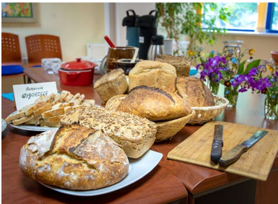
Pieczywo w przeróżnej postaci królowało tego popołudnia przy ul. Ciasnej.