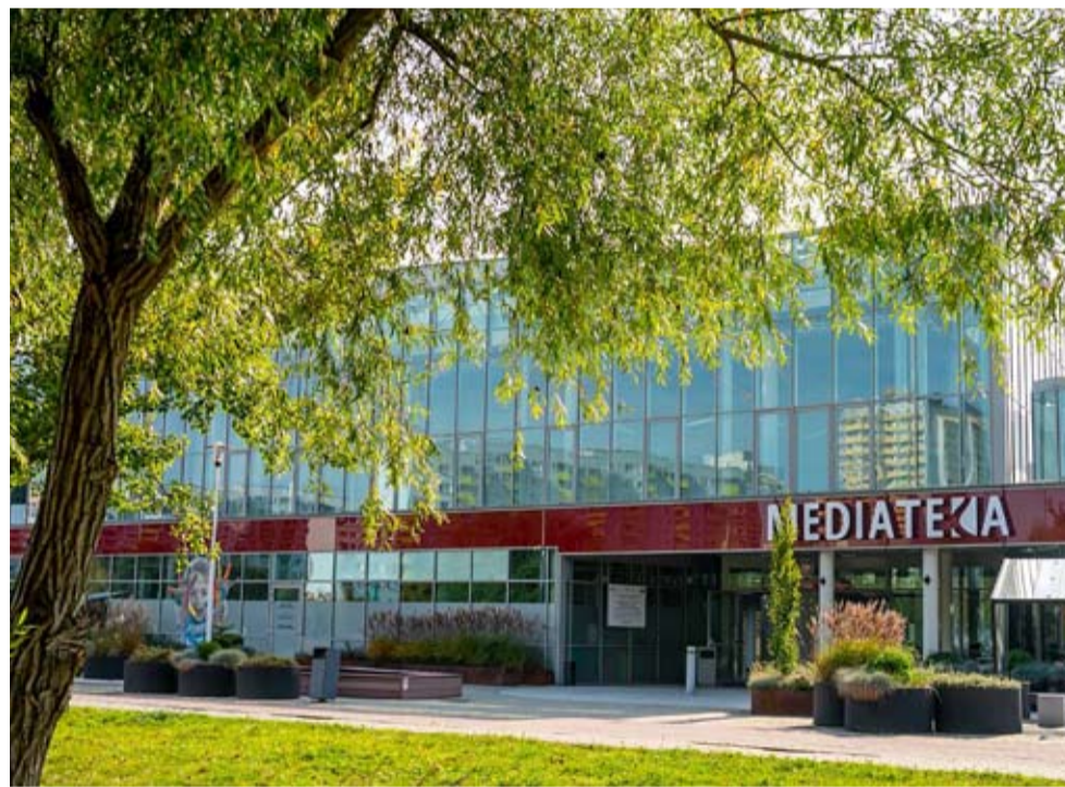
Liczba czytelników tyskiej MBP z roku na rok wzrasta.

Kwalifikację do wystawy pokonkursowej w ramach konkursu „Jakość” zdobyła też praca innego tyszana, Grzegorza Krzysztofika. Fotografie można oglądać do 2 lipca w Otwartej Pracowni Sztuki w Legnicy. WW