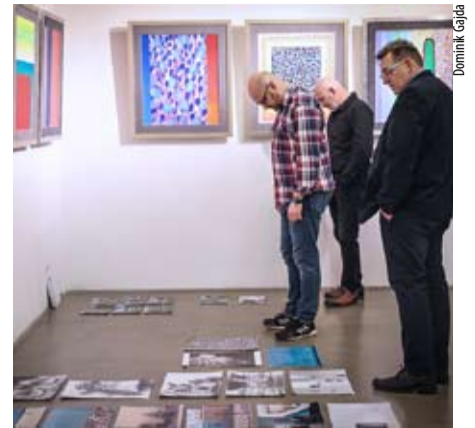
Jurorzy poprzedniej edycji Tychy Press Photo mieli niełatwy orzech do zgryzienia. Pewnie podobnie będzie w tym roku.

Prace można nadsyłać lub składać w Miejskiej Galerii Sztuki Obok w godzinach pracy gale-