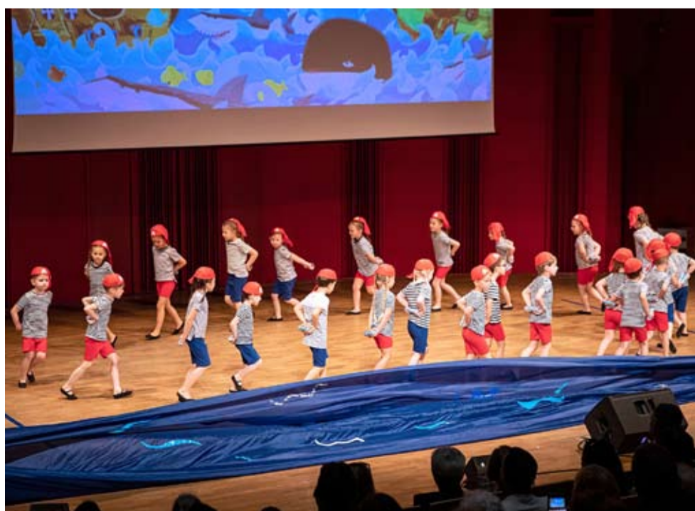
W tegorocznych prezentacjach wzięło udział ponad pół tysiąca przedszkolaków.