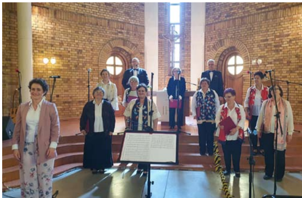
Chór Parafii Ewangelicko-Augsburskiej w Tychach.

Na zakończenie gospodarz przygotował piknik w ogrodzie parafialnym, podczas którego wystąpił tyski zespół Skrawki. Impreza była współorganizowana z Miejskim Centrum Kultury. MN