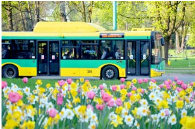
Po naszych ulicach jeździ coraz więcej klimatyzowanych, wyposażonych w internet, bezpiecznych autobusów komunikacji miejskiej.

Nowe umowy związane są także z podwyższeniem standardów przewozowych, bowiem do realizacji umów przewoźnikom potrzebne będzie w sumie ok. 40 nowoczesnych pojazdów. Warto dodać, iż od połowy przyszłego roku jazdy te