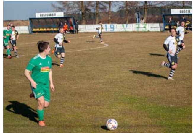
Drużyna Ogrodnika Cielmice awansowała na drugie miejsce w tabeli.