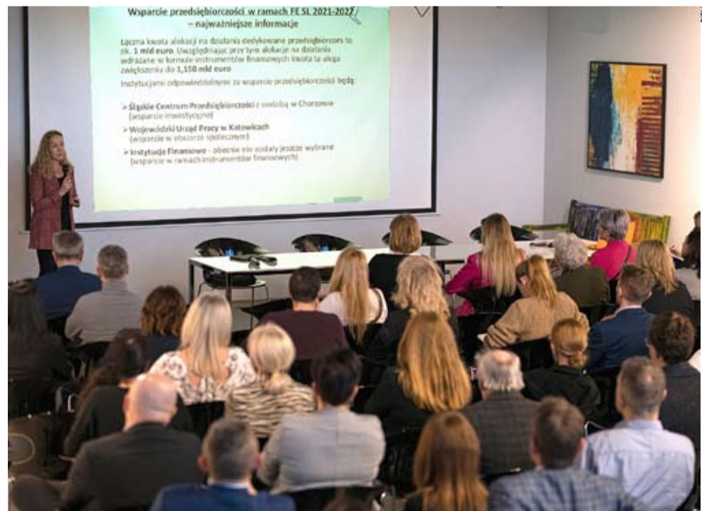
Biznesowe seminarium zorganizowano w galerii StrefART.