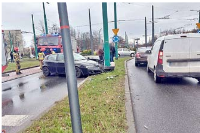
Na Rondzie Zesłańców Sybiru kierująca alfą romeo uderzyła w słup trakcji trolejbusowej.

10-letnia dziewczynka, poruszając się hulajnogą elektryczną uderzyła w osobowego vw. Trafiła pod opiekę przybyłych na miejsce ratowników medycznych, ale na szczęście po przebadaniu, pozostała na miejscu zdarzenia.