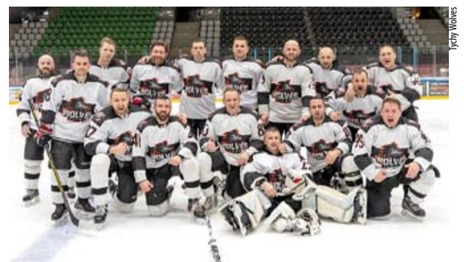
Mistrzowska drużyna Tychy Wolves.

DRAGONS TYCHY po fazie zasadniczej, zajęli w 2. lidze drugie miejsce. Oto wyniki Smoków: z Szerzeniami (3:3 i 1:3), z Bykami (0:1 i 8:3), z Zagłębiem (2:3 i 2:3), z Sielcem (7:4 i 8:3), z Baribals (5:1 i 7:1), z Chemikiem (12:1 i 10:5) W półfinałowym dwumeczu play off tyszanie wygrali 5:2 i przegrali 3:9 z Bykami, odpadając z rywalizacji o awans do 1. ligi. LS ●