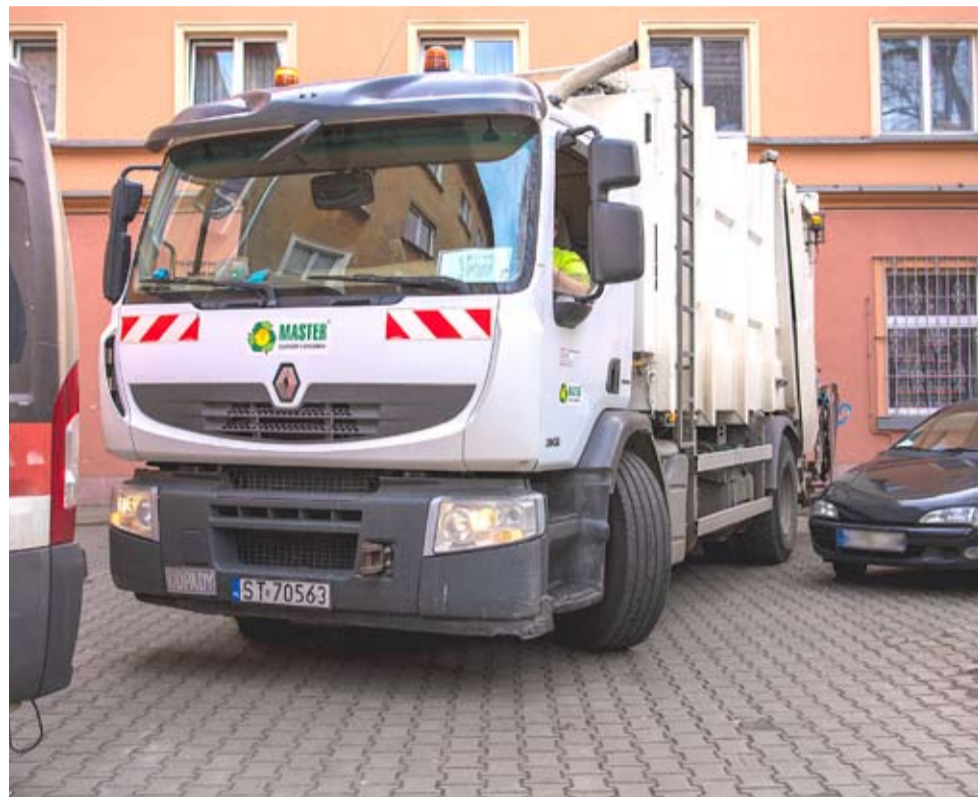
Aby dojechać do altany, kierowcy Mastera muszą wykazać się nie lada umiejętnością.

Do samochodu odbierającego odpady wsiadamy na ul. Wojska Polskiego. Od razu rzucają nam się w oczy lusterka. Jest ich dużo. – Aż tyle? To nie przesada? – pytam. – Sam zobaczysz – słyszę. Wybraliśmy os. A, gdyż na tym osiedlu sytuacja jest wyjątkowo trudna. Jeden źle zaparkowany samochód może spowodować kilkudziesięciminutowe opóźnienie. Póki co, jest nieźle. Droga przejezdna, aż w końcu skręcamy w uliczkę prostopadłą do ul. Arkadowej. Zaparkowany samochód na skrzyżowaniu ulic wymaga wjechania na teren zielony. – Niestety, to jest codzienność. Samochód ma swoje gabaryty. Nie przeskoczysz – mówi kierowca „śmieciarki”. Zanim wykonamy manewr, za wycieraczki niepoprawnie zaparkowanego samochodu trafia ulotka „Łatwy dojazd – czysta okolica”. Kolejny problem napotykały zaledwie kilkadziesiąt metrów dalej. Na zakręcie tłoczą się zaparkowane samochody. Trudno przejechać osobówką, my przejeżdżamy 26-tonowym kołosem. W tym momencie rozumiemy, po co są te wszystkie lusterka. Aby wykonać ten manewr, kierowca operuje na granicy błędów, który wynosi czasem 5 cm, chociaż wydaje nam się, że może to być nawet poniżej 1 cm. – Żyłki nie wciśniesz – żartuje pracownik Mastera i wyciąga plik ulotek.