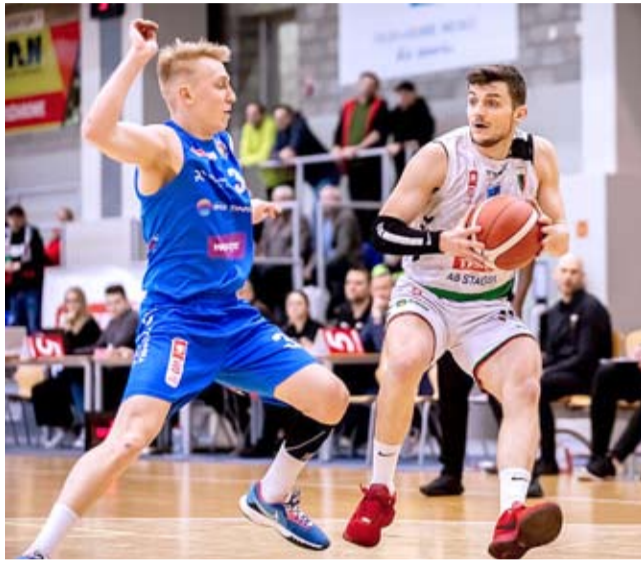
Rundę zasadniczą tyszanie zakończyli 22. zwycięstwem w sezonie. Pokonując AZS Politechniki Opolska GKS umocnił się na 4. miejscu w tabeli.

Lepiej w mecz weszli rywale, którzy uzyskali kilkupunktową przewagę. I choć potem tyszanie odrobili stratę, lepiej kwartę zakończyli goście, wygrywając 6 punktami. W drugiej odsłonie tyszanie złapali swój rytm, ustrzegli się błędów i po niespełna trzech minutach objęli prowadzenie. Do przerwy było 48:45 i wydawało się, że po zmianie stron tyszanie