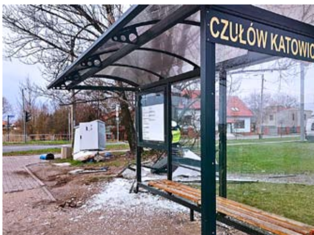
Zdemolowany przystanek autobusowy przy ul. Katowickiej.