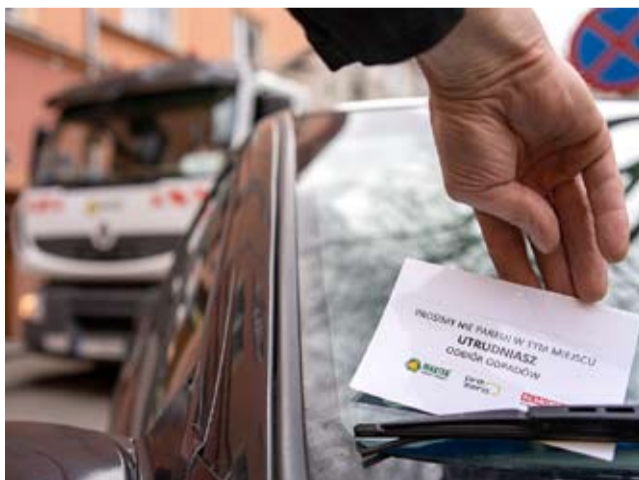
Kierowcy nieprawidłowo zaparkowanych samochodów otrzymują ulotki informacyjne.

ul. Zgrzebnioka 35A, 43-100 Tychy, tel/fax: 32 219 65 12 NIP: 646-001-04-05, REGON: 271050835