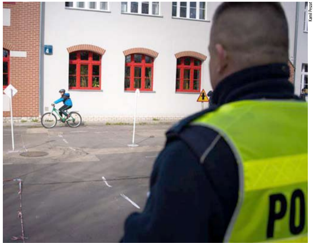
Drużyny musiały zaprezentować znajomość przepisów również w praktyce.

Konkurs składał się z czterech etapów: wiedzy teoretycznej, toru przeszkód, miasteczka ruchu drogowego oraz pierwszej pomocy. W rolę opiekunów i sędziów wcielili się funkcjonariusze straży miejskiej oraz policji. Do dalszego etapu zakwalifikowali się uczniowie ze Szkoły Podstawowej nr 7, Szkoły Podstawowej nr 9 oraz Szkoły Podstawowej nr 1. KP ●