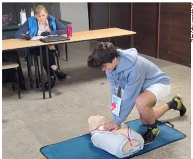
Komisja oceniała m.in. prawidłowość wykonania resuscytacji krążeniowo-oddechowej.