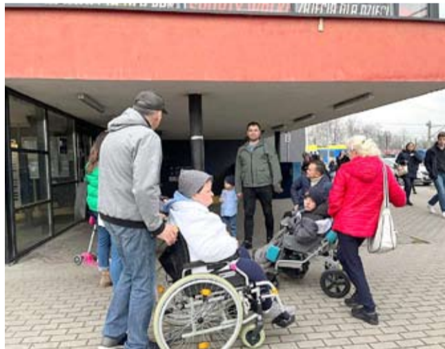
Największym problemem dla niepełnosprawnych jest korzystanie z dworca PKP.