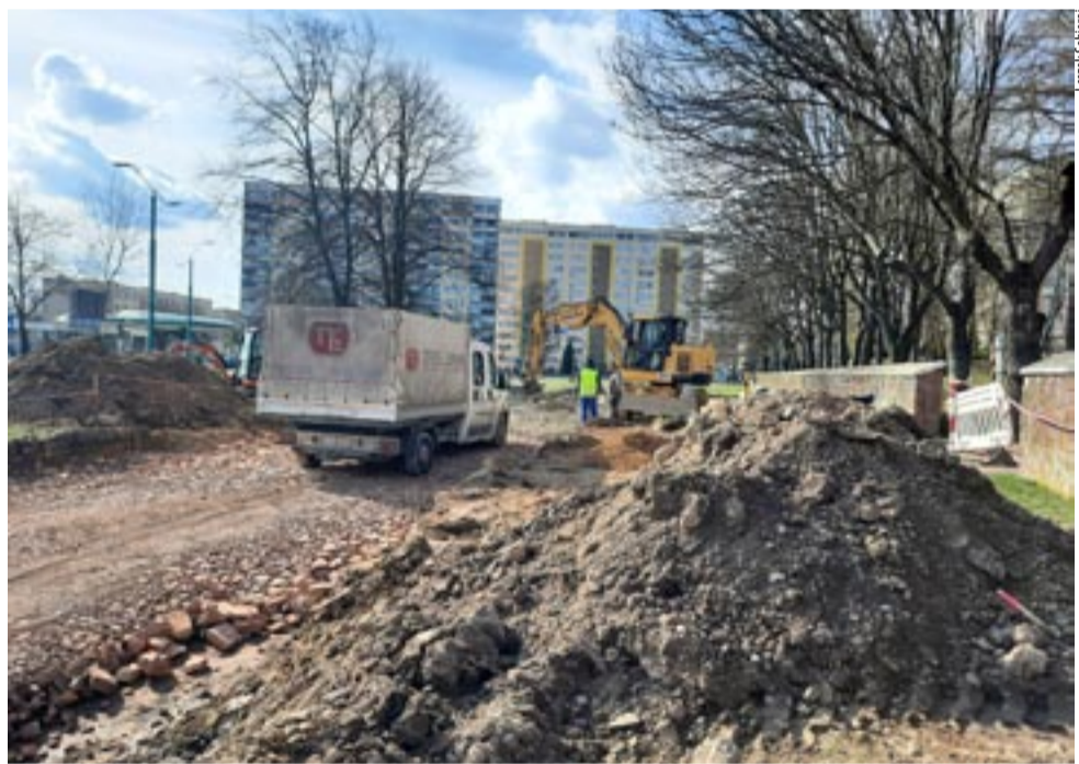
Modernizację placu Konstytucji 3 Maja rozpoczęto od budowy nowego parkingu przy ul. Żwakowskiej.