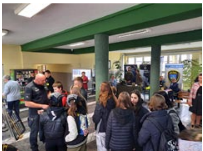
Dzień otwarty był okazją do spotkań z funkcjonariuszami.