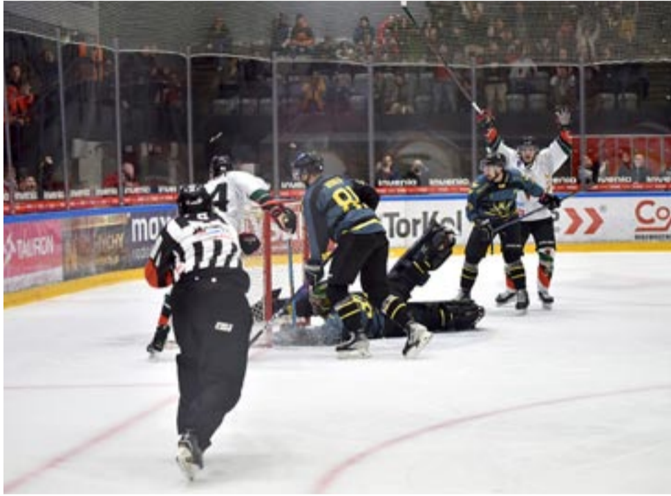
Po dwóch meczach w Tychach rywalizacja o mistrzowski tytuł przenosi się do Katowic.

Na początku ostatniej odsłony sędziowie po obejrzeniu wideo nie uznali bramki dla Katowic. Czas upływał, tyszanie dążyli do wy-