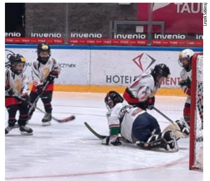
W pierwszym meczu MOSM Tychy zmierzył się z Zagłębiem Sosnowiec.

W meczach eliminacyjnych występująca pod szyldem MOSM Tychy drużyna zanotowała wyniki: 1:6 z Zagłębiem Sosnowiec, 1:1 z Ocelari Trinec