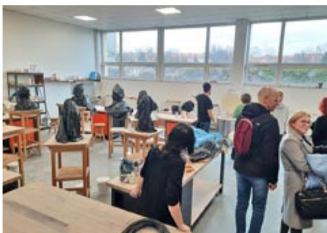
Jedna z nowych pracowni szkolnych – rzeźbiarska.