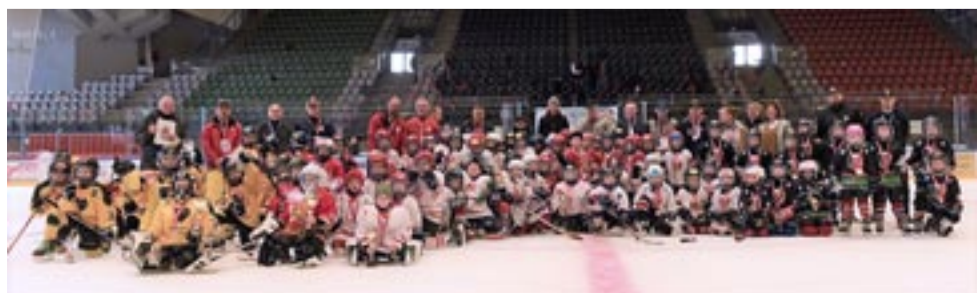
Uczestnicy I Międzynarodowego Turnieju Hokejowego Przedszkolaków obiecali spotkać się za rok.

Klasyfikacja końcowa: 1. Sportowe Katowice, 2. Minihokej Łódź, 3. Ocelari Trinec A, 4. Zagłębie Sosnowiec, 5. MOSM Tychy, 6. Ocelari Trinec B, 7. Polonia Bytom, 8. Naprzód Janów. LS