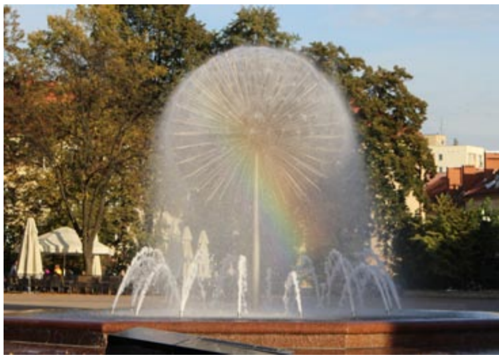
Wiosna nadeszła, czas zatem na uruchomienie miejskich fontann.