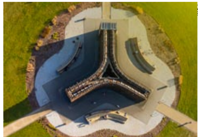
Z tężni w Parku Południowym korzystać będziemy od 1 kwietnia.

Koleje Śląskie potwierdziły, że od 1 kwietnia dostępne będą bilety za złotówkę, dzięki którym pasażer będzie mógł przejechać jedną stacją np. z Tychy Lodowisko do Tychy Grota-Roweckiego. Przewoźnik uruchomi pilotażo-