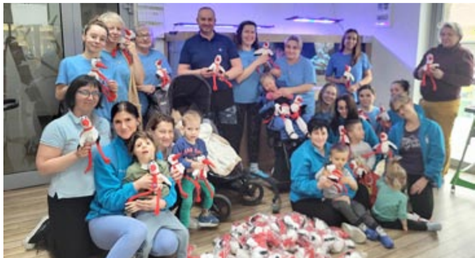
Opiekunowie i podopieczni Świetlikowa z bocianami, które „przyfrunęły” dzięki uprzejmości jednej z firm budowlanych.

„ŚWIETLIKOWO” OPIEKUJE SIĘ NIEULECZALNIE CHORYMI DZIEĆMI, A HOSPICIJUM IM. ŚW. KALIKSTA – DOROSŁYMI.