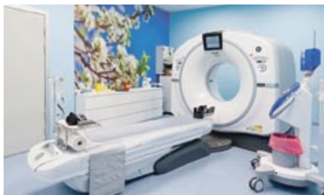
Na wyposażeniu m.in. nowoczesny tomograf komputerowy, aparat USG oraz densytmometr.

ne. Badanie trwa około 20 minut i nie trzeba się do niego specjalnie przygo-