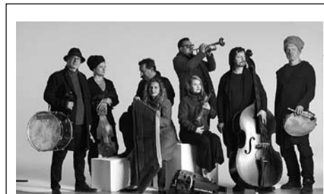
1 KWIETNIA, GODZ. 19: AUKSO X KAPELA ZE WSI WARSZAWA – KONCERT, MEDIATEKA

GODZ. 17 – WIANKI WIOSENNO-WIELKANOCNE – warsztaty artystyczne (Klub MCK Wilkowyje, ul. Szkolna 94)