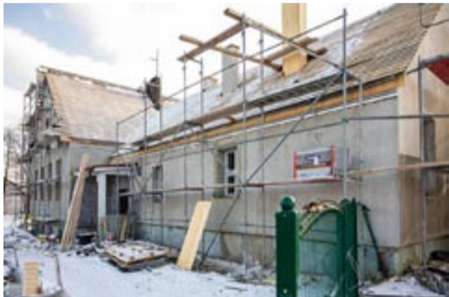
Budynek przy ul. Szkolnej 70 przechodzi gruntowną modernizację.

Całkowity koszt projektu to 1.354.432,10 zł, a dofinansowanie wynosi: 797.353,15 zł. W ramach prac wykonane zostanie m.in.: docieplenie ścian zewnętrznych, stropodachu oraz stropu nad piwnicą, izolacje prze-