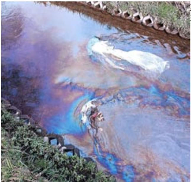
Tak wyglądał zanieczyszczony Potok Tyski.

W zależności od wyników przeprowadzonych działań kontrolnych w sytuację może zostać zaangażowany Wojewódzki Inspektor Ochrony Środowiska. Więcej szczegółów poznamy 31 marca. KP ●