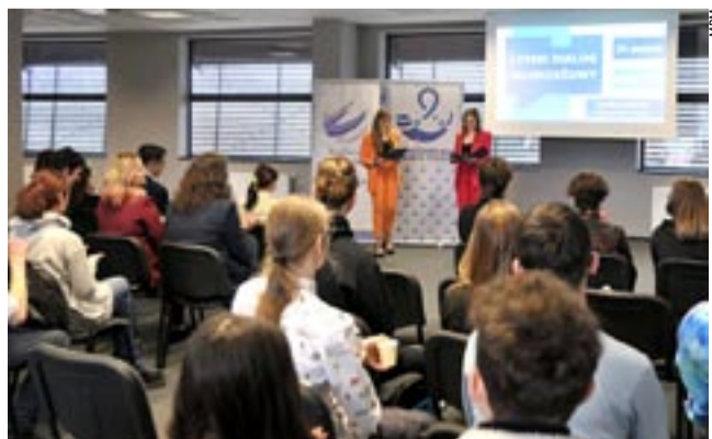
Pierwsza edycja Tyskiego Dialogu Młodzieżowego cieszyła się dobrą frekwencją. Organizatorzy planują kolejne.

Goście I Tyskiego Dialogu Młodzieżowego zagraли w interaktywną grę dotyczącą naszego miasta, która była formą podsumowania rozmów, a osobom z najlepszymi wynikami wręczono vouchery do Wodnego Parku Tychy. OPAC. KP ●