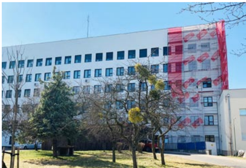
Trwa termomodernizacja Szpitala Megrez.

Podczas odwiedzin obowiązują następujące zasady: pacjenta może odwiedzić jedna osoba pełnoletnia, po uprzednim wypełnieniu ankiety epidemiologicznej oraz pomiarze temperatury; czas odwiedzin powinien trwać maksymalnie 15 minut i ograniczać się do sali, w której przebywa pacjent. Odwiedzający są także zobowiązani do zachowania dotychczasowych środków ostrożności, takich jak dezynfekcja rąk, prawidłowo założona maseczka oraz utrzymanie dystansu. Zaleca się także, aby pacjenta odwiedzała ta sama osoba. Szpital prosi również o ograniczenie rzeczy dostarczanych pacjentom. Szczegółowe informacje dotyczące zasad odwiedzin można znaleźć na stronie internetowej szpitala: www.szpitalmegrez.pl .