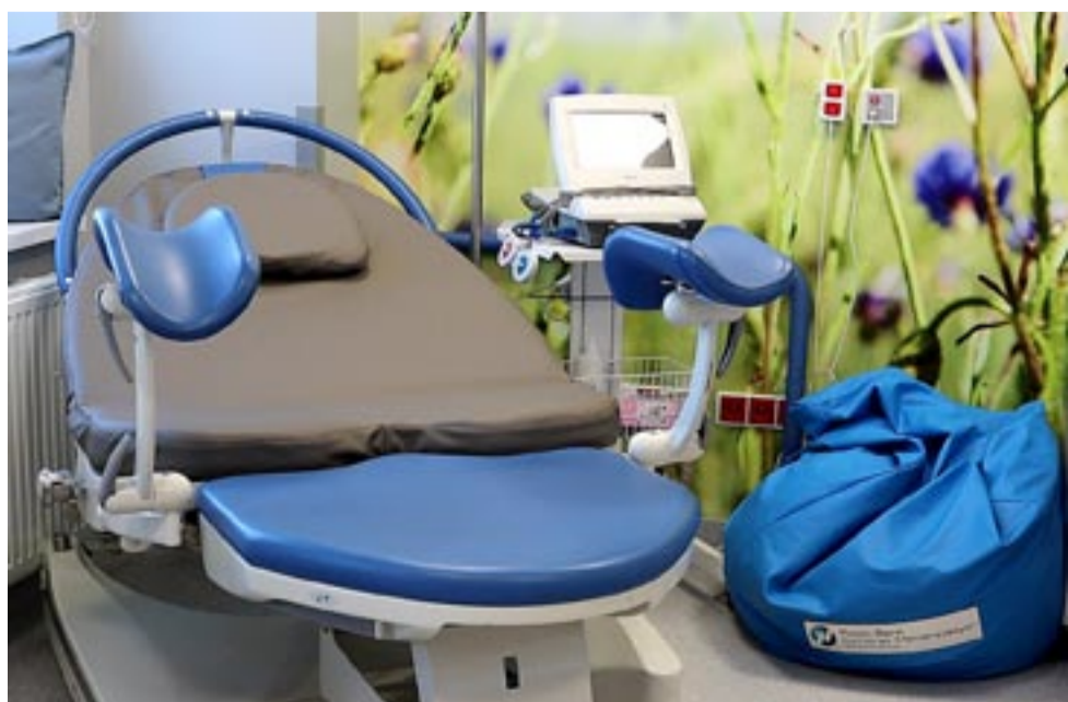
Jedna z komfortowych sal porodowych, służąca przyszłym mamom.