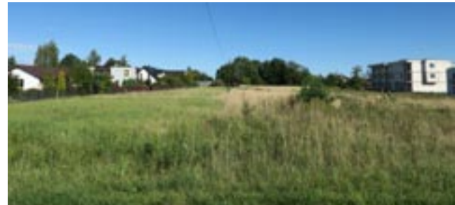
Działki budowlane w Czulowie. Wojewoda zaakceptował uchwałę radnych, a mieszkańcy protestując wystąpili z pozwem do sądu.

WOJEWÓDZKI SĄD ADMINISTRACYJNY W GLIWICACH UNIEWAŻNIŁ CZĘŚĆ PLANU ZAGOSPODAROWANIA PRZESTRZENNEGO DOTYCZĄCEGO M.IN. TERENU W CZUŁOWIE, W REJONIE UL. BRZOSKWINIOWEJ. WŁADZE MIASTA ZAPOWIEDZIAŁY ZŁOŻENIE KASACJI W TEJ SPRAWIE.