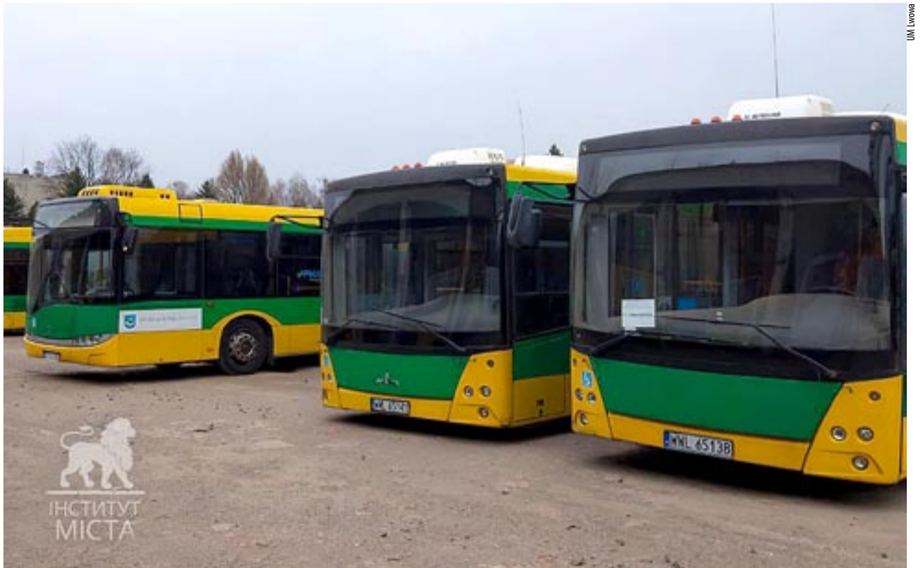
Na razie autobusy z Tychów stoją we lwowskiej zajezdni i czekają na rejestrację, ale już w drugim tygodniu kwietnia wyruszą na trasy.

Niestety, od rozpoczęcia inwazji Federacji Rosyjskiej na Ukrainę większość taboru realizuje kursy z Lwowa do granic z Polską. – Codziennie 70 naszych autobusów kursuje na granicę i są one wyłączone z obsługi transportu publicznego. Trzeba podkreślić, że do Lwowa w ostatnich dniach przyjechało ponad 200 tys. przesiedleńców z innych rejonów Ukrainy i strumień ten wciąż płynie. To powoduje ogromny paraliż w komunikacji miejskiej. Musimy zapewnić alternatywną opcję transportu, stąd mer miasta Andrij Sadowy zwrócił się z prośbą o pomoc. Na tę prośbę odpowiedzieli prezydenci polskich miast i na tę chwilę otrzymaliśmy 27 autobusów w tym sie-