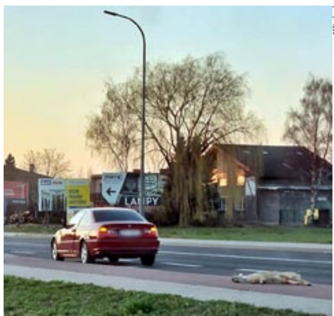
Przebiegający przez ul. Oświęcimską jeleń nie przeżył, niestety, zderzenia z samochodem osobowym.

◆ 26 NA ŚCIEŻCE ROWEROWEJ WZDŁUŻ AL. BIELSKIEJ (na wysokości Zespołu Szkół nr 4) doszło do nieszczęśliwego wypadku. Jadący na hulajnodze mężczyzna utracił nad nią panowanie i wyrzucił się. Z pomocą poszkodowanemu pospieszyli świadkowie zdarzenia oraz wezwali na miejsce pogotowie. Mężczyzna trafił pod opiekę ratowników medycznych. LS ◆