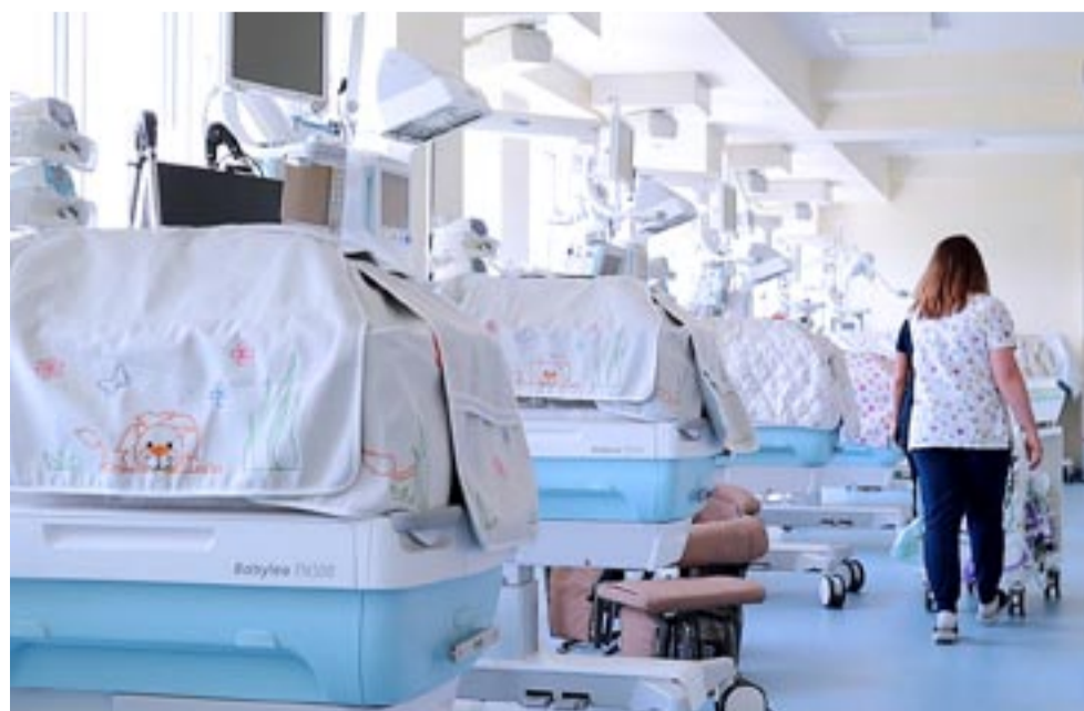
Oddział Neonatologiczny wyposażony jest w najnowocześniejszy sprzęt medyczny.