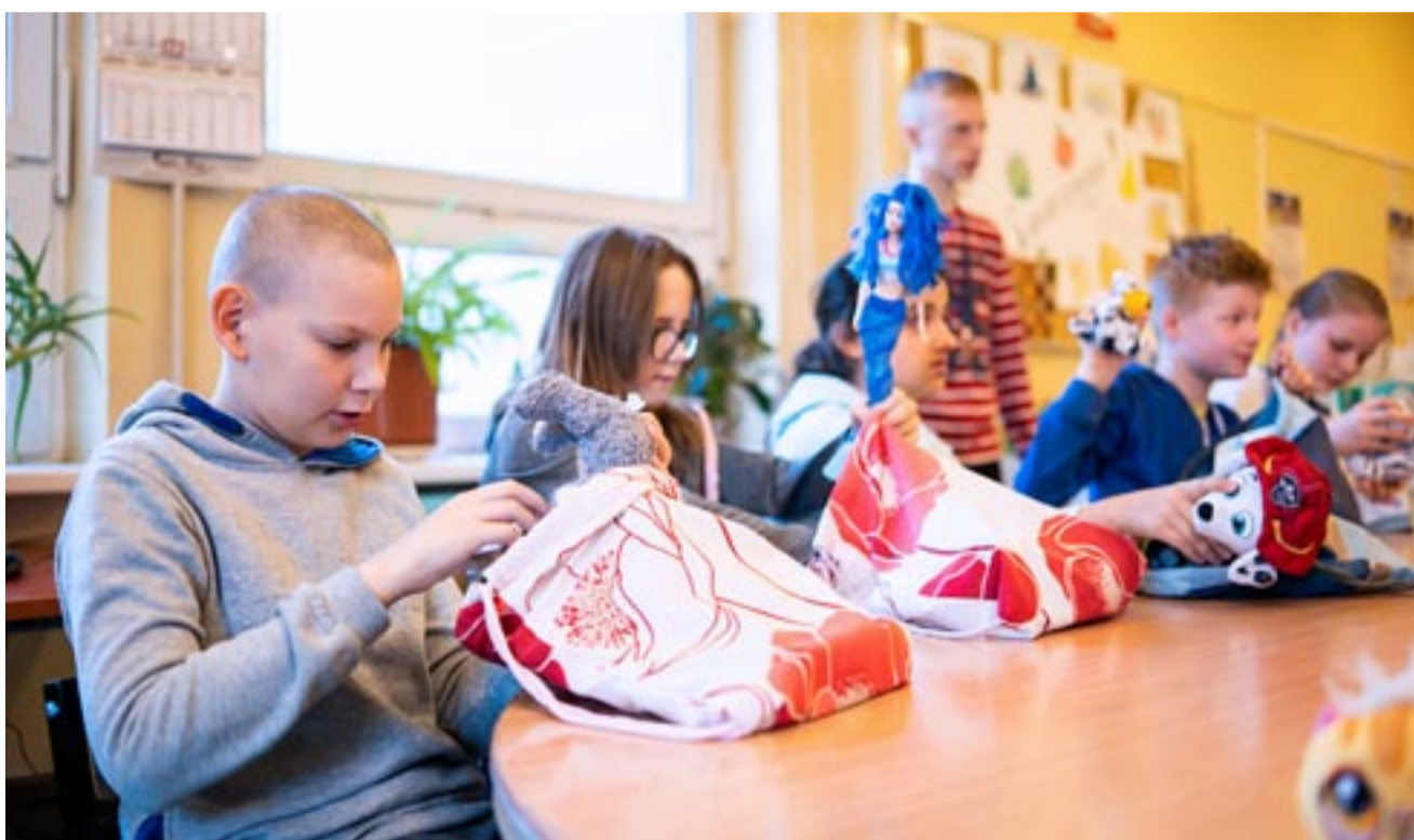
Dzieciaki z Zespołu Szkół Specjalnych nr 8 podczas przygotowania paczek dla uchodźców.

UCZNIOWIE I NAUCZYCIELE ZESPOŁU SZKÓŁ SPECJALNYCH NR 8 POMAGAJĄ UCHODŹCOM.