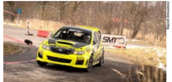
W niedzielę, 3.04 na torze FCA rozegrano drugą w tym roku eliminację Samochodowych Mistrzostw Tychów. Wystartowało 75 załóg. O imprezie napiszemy więcej w kolejnym wydaniu „TT”.

W finale JKH GKS Jastrzębie pokonało Niedźwiadki Sanok 5:4 w dogrywce. LS ●