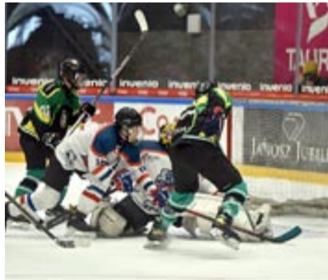
Kolejna hokejowa drużyna MOSM na podium MP.

W meczu o trzecie miejsce MOSM Tychy zagrał w składzie: Chabior (Chmiel) – Słomian, Ja-