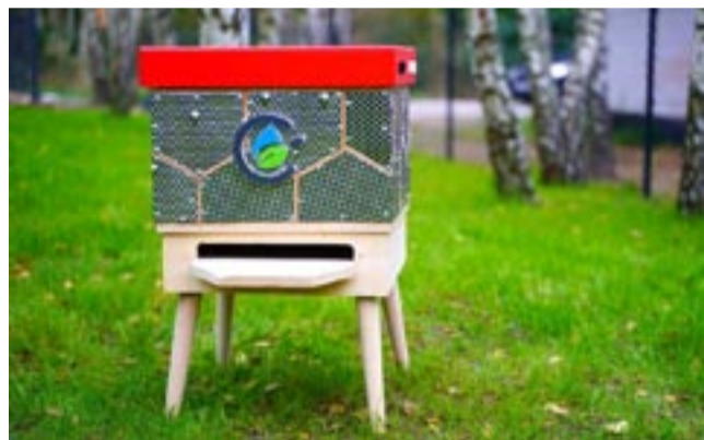
Takie ule, które powstały z tyskich elektrośmieci, zdbią 10 pasiek w całej Polsce.