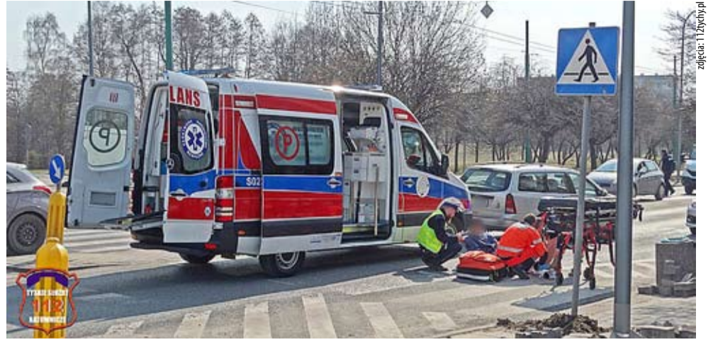
Na ulicy Armii Krajowej samochód potrącił 69-letnią kobietę.

◆ 16.03 NA OZNAKOWANYM PRZEJŚCIU DLA PIESZYCH skoda fabia potrącił 23-letniego mężczyznę. Na szczęście pieszy nie odniósł poważnych obrażeń. 55-letni kierowca ukarany został mandatem w wysokości 2,5 tysiąca złotych oraz 10 punktami karnymi.