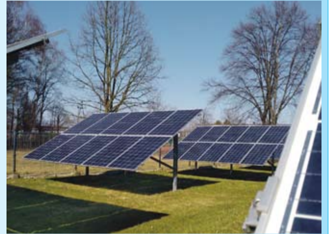
Nowoczesna farma fotowoltaiczna Przedsiębiorstwa.

Skutkiem niedoboru wody w organizmie jest odwodnienie. Utrata około 2% wody ustrojowej, fizjologicznie, zwykle, kompensowane jest w ciągu 24 godzin. Pierwsze objawy odwodnienia to: zaburzenia termoregulacji, spadek apetytu i zmniejszenie wydolności fizycznej.