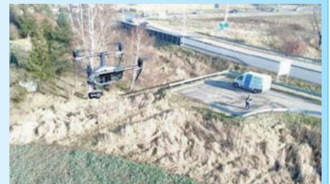
Dron „Tyskich Wodociągów” w działaniu.

Od wielu już lat Wodociągi Tyskie realizują proekologiczny tryb działania. Ze swoich zasobów Przedsiębiorstwo usunęło już praktycznie wszystkie przewody azbestowo-cementowe. Stosowane dzisiaj na nowe wodociągowe materiały, są najwyższej klasy, certyfikowanymi materiałami dla wody pitnej. Sukcesywnie też wymieniane są na nowe, wysłużone stalowe fragmenty sieci wodociągowej tak, by standard jej funkcjonowania odpowiadał najwyższym wymaganiom