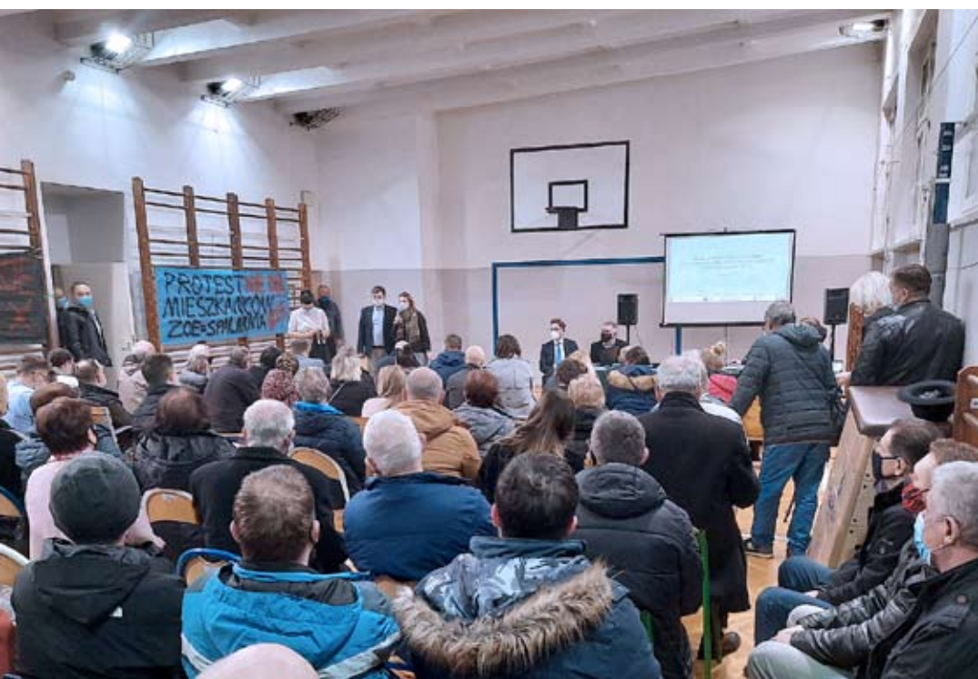
Na spotkanie w wilkowskiej szkole przybyli dziesiątki mieszkańców dzielnicy.

– Ciepło systemowe jest grą zespołową i podłączanie jednego domku jest nieekonomiczne. Jeżeli mieszkańcy danego osiedla chcą się przyłączyć, to taka inwestycja może być zrealizowana.