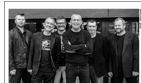
4 MARCA, GODZ. 19.30 – „30 LAT JAK JEDEN KONCERT” – KONCERT ZESPOŁU RAZ, DWA, TRZY, TEATR MAŁY

GODZ. 17 – DZIEŃ KOBIET w Klubie Wilkowyje: Zdrowie i pielęgnacja z natury – warsztaty pielęgnacyjne (Klub MCK Wilkowyje, ul. Szkolna 94)