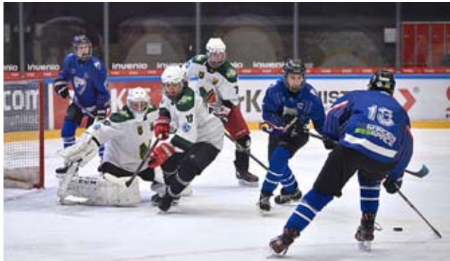
W finale MP Sokoły (niebieskie stroje) pokonały Naprzód 3:2.

W meczu o brąz Unia Oświęcim przegrała w dogrywce z Pod-