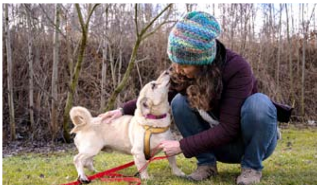
Abby adoptować psa czy kota, trzeba przede wszystkim mieć serce do zwierząt.