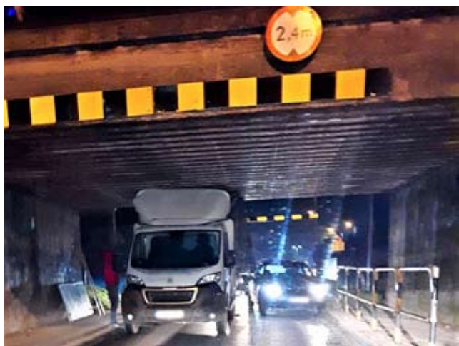
Niekończący się serial z wiaduktem na ul. Glincańskiej.

cy o wysokości pod wiaduktem do 2,4 m i najpierw uderzył w bramownicę, a następnie zaklinował się pod wiaduktem. Ruch w miejscu zdarzenia został zablokowany, a po kilkunastu minutach został wprowadzony ruch wahadłowy. LS ●