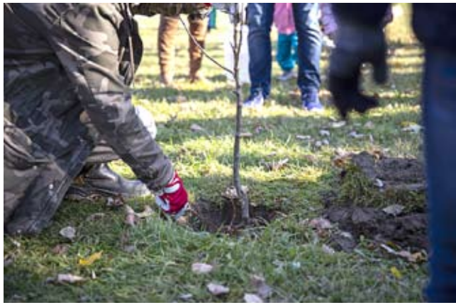
Posadzone przez rodziców drzewko będzie rosło razem z ich dziećmi.

Posadzenie drzewa upamiętniającego narodziny dziecka jest całkowicie bezpłatne, a o udziale w akcji decyduje kolejność zgłoszeń. W dniu nasadzenia organizatorzy przygotowują niezbędne narzędzia i wyposażenie. Na miejscu