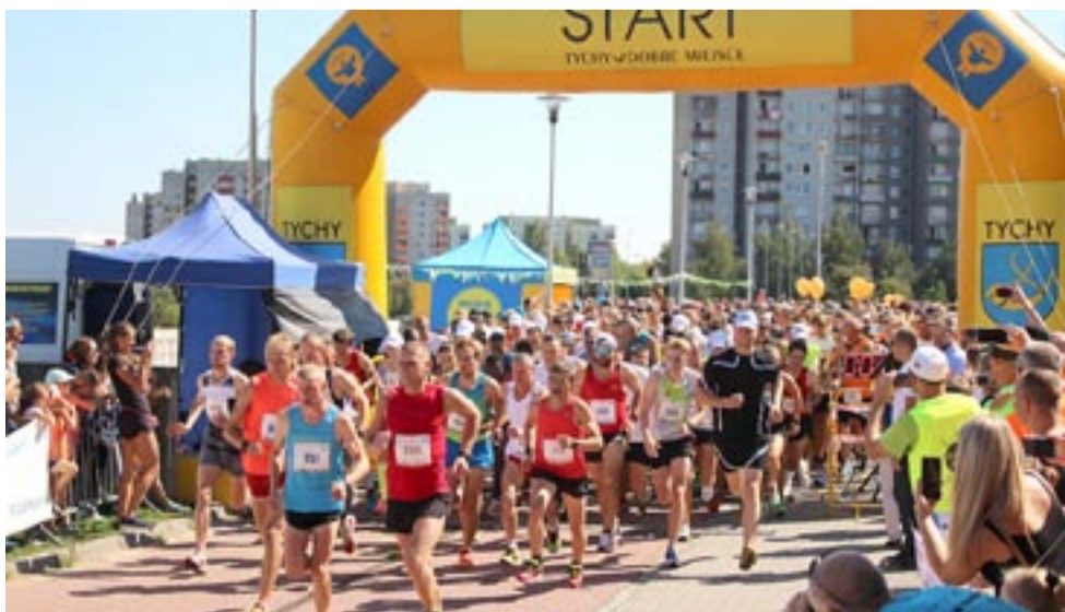
Jednym z przykładów masowego uprawiania sportu w Tychach jest coroczny bieg uliczny.

Jeśli chodzi o strategię sportową na najbliższe lata, to wytyczono trzy zasadnicze cele: kontynuacja wspierania sportu wyczynowego, utrzymanie istniejącej i rozwój infrastruktury sportowo-rekreacyjnej oraz promocja i wspieranie rozwoju sportu amatorskiego i rekreacji. Najważniejszym zadaniem w sporcie wyczynowym stanie się wzrost wielkości zaangażowania prywatnego kapitału w finansowanie strategicznych dyscyplin, awans o co najmniej jedną klasę klubów dyscyplin strategicznych lub utrzymanie aktualnego poziomu oraz organizacja co najmniej 5 imprez sportowych o randze międzynarodowej. W planach związanych z rozwojem infrastruktury sportowej znalazły się m.in. budowa marina żeglarskiej, boiska z murawą naturalną przy ul. Edukacji, drugiego lodowiska, strzelnicy sportowej, basenu otwartego, systematyczne wyposażanie obiektów sportowych, generalny remont Krytej Pływalni, hali przy al. Piłsudskiego oraz przeznaczenie większych kwot na remonty i utrzymanie innych obiektów. Ważnym zadaniem będzie także utrzymanie wsparcia z budżetu miasta dla organizacji imprez masowych, popularyzujących różne formy aktywności ruchowej mieszkańców (jazda na rolkach, bieganie, jazda na rolkach, itp.), a także z udziałem osób niepełnosprawnych. LESZEK SOBIERAJ