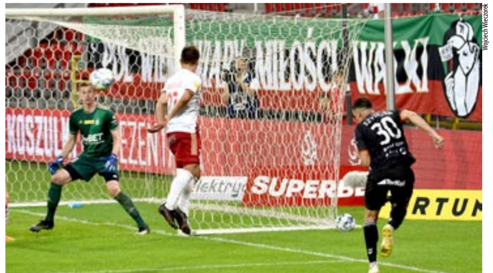
Obok hokeja i koszykówki piłka nożna pozostaje najpopularniejszym sportem wyczynowym w mieście.

– Jeśli chodzi o dotację miasta na sport, to nie mamy się