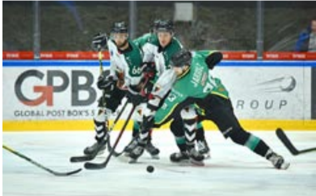
Hokeiści GKS w meczu z Jastrzębiem „przespali” dwie tercje i dopiero w ostatniej rozpoczęli odrabiać straty

SPORĄ DAWKĘ EMOCJI PRZYNIOSŁY TRZY OSTATNIE MECZE Z UDZIAŁEM TYSKICH HOKEISTÓW. NAJPIERW BYŁ „PIŁKARSKI” WYNIK MECZU Z UNIĄ, POTEM NA STADIONIE ZIMOWYM OGLĄDALIŚMY PORYWAJĄCĄ POGOŃ GKS ZA JASTRZĘBIAMI I WRZESCIE MECZ W KRAKOWIE, W KTÓRYM PADŁO 11 GOLI, A O JEDNEGO WIĘCEJ ZDOBYŁ GKS.