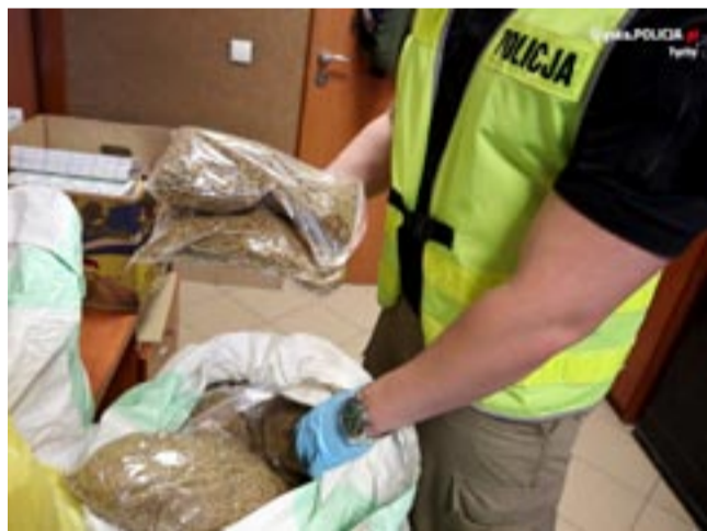
Łączna wartość kontrabandy wyniosła 40 tys. zł.

◆ 4.02 OKOŁO GODZINY 17.30 POINFORMOWANO OFICERA DYŻURNEGO PSP W TYCHACH O POŻARZE PUSTOSTANU – domu jednorodzinnego przy ul. Batorego. W zdewastowanym budynku często przebywali bezdomni i już wcześniej dochodziło tutaj do pożarów. Wezwani na miejsce strażacy szybko poradzili sobie z zagrożeniem i po około trzydziestu minutach działania Cyganerii zasnęła nastolatka (16