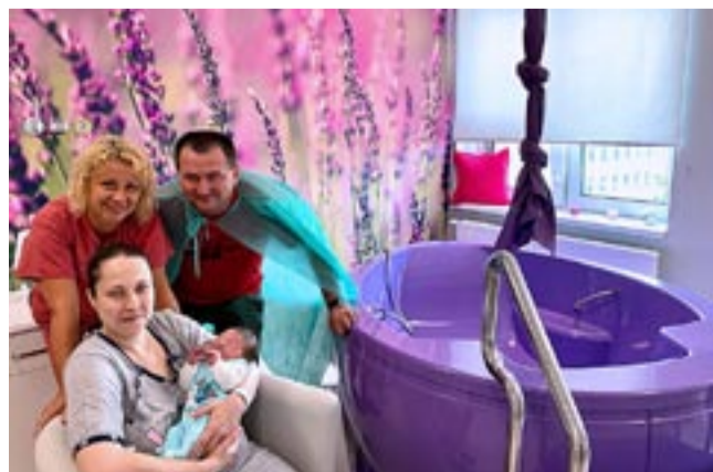
Porody w wodzie cieszą się coraz większą popularnością.