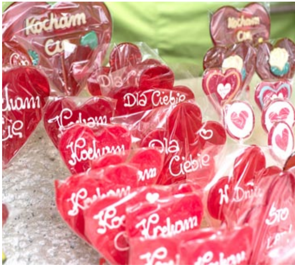
Na bieruńskim odpuszcie u św. Walentego zawsze można znaleźć mnóstwo okolicznościowych wyrobów.