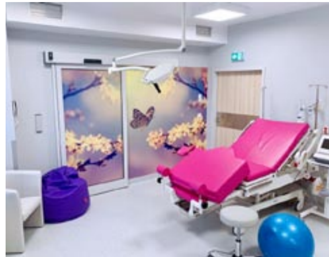
W takim otoczeniu poród wydaje się być przyjemniejszym wydarzeniem w życiu kobiety.

Tyska porodówka stale się rozwija i podejmuje kolejne działania, w trosce o jak najlepszą opiekę dla pacjentek oraz ich dzieci. W działalności oddziału bardzo istotną jest również szeroko pojęta edukacja przyszłych rodziców. Z inicjatywy położnych na profilu na Facebooku Szpitala Megrez w Tychach powstał specjalny cykl pod nazwą „Z Tych dobrze urodzonych”. Raz w tygodniu, w piątek, zespół Oddziału Ginekologiczno-Położniczego publikuje zagadnienia dotyczące edukacji okołoporodowej, porady ciąży i porodowe, a także informacje o przygotowaniu się