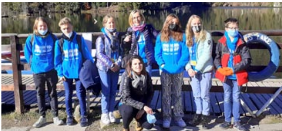
Uczniowie i nauczyciele SP nr 10 w Tychach nad Lakul Rosu w Rumunii.

GYNCENTRUM – punkt mobilny na parkingu przy Auchan (foto), tel. 32/506-50-86, codziennie w godz. 15-21. LS