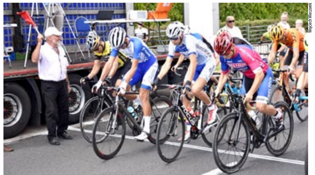
Kryterium Fiata to wyścig, na którym pojawia się czołówka polskich kolarzy, a także zawodnicy z zagranicy.