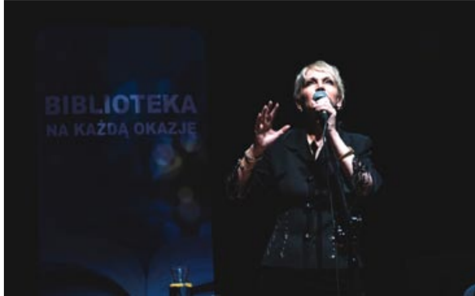
Adrianna Biedrzyńska sprawdziła akustykę sali koncertowej w Mediatece.