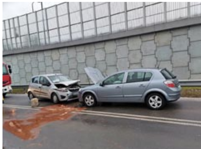
Czołowe zderzenie na ul. Kościelnej.

wykazało badanie 28-letniego kierowcy ford mondeo. Nietrzeźwy kierujący zjechał na przeciwny pas ruchu, doprowadzając do czołowego zderzenia. Na szczęście nikomu nic poważnego się nie stało. Teraz, oprócz spowodowania kolizji, odpowie także za kierowanie w stanie nietrzeźwości, za co kodeks karny przewiduje karę do 2 lat więzienia.