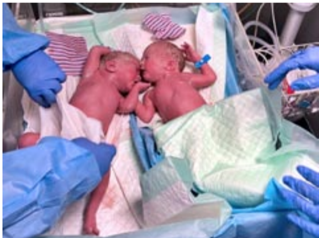
W ubiegłym roku w tyskim szpitalu przyszły na świat cztery pary bliźniaków.

Aby zapoznać się z tymi materiałami, wystarczy wejść na stronę internetową szpitalmegrez.pl, a następnie kliknąć w zakładki: Komórki organizacyjne – Oddziały – Ginekologiczno-Położniczy z Pododdziałem Ginekologii Onkologicznej – Trakt Porodowy. RS