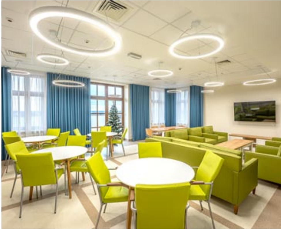
Z powodu uporu wojewody kompletnie wyposażone pokoje i sale nie mogą przyjąć podopiecznych DPS.

NADAL NIE MA ROZSTRZYGNIECIA W SPRAWIE DOMU POMOCY SPOŁECZNEJ „DOBRE MIEJSCE”