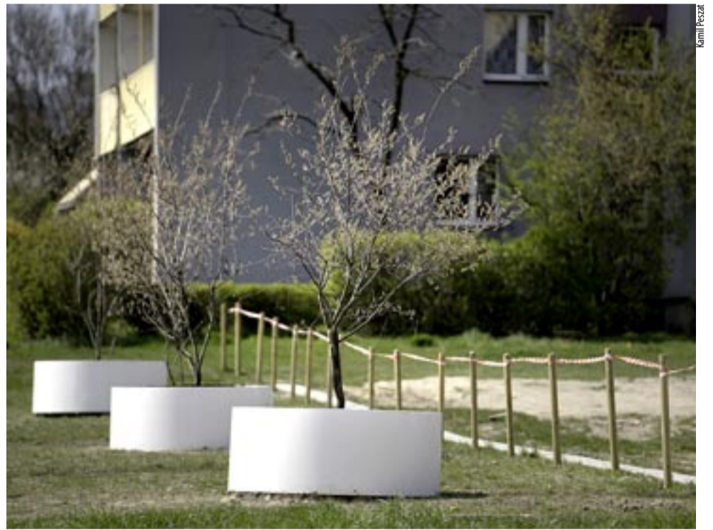
Z inicjatywy mieszkańców TZUK zainstalował donice, które uniemożliwiają niszczenie trawy przez samochody.

tonowe z obsadą drzewną, aby uniemożliwić dalsze rozjeżdżanie tego terenu. Wspomniane drzewa w najbliższych latach osiągną określone wymiary, ale też nie będą mieszkańcom przeszkadzać. Takie rozwiązanie pozwala, w razie czego, na szybkie przesunięcie, bądź znalezienie innego miejsca, jeżeli już nie będzie takiej potrzeby, aby zabezpieczyć ten teren. Na tę chwilę przyglądamy się innym terenom zielonym, które są systematycznie rozjeżdżane przez kierowców. Planujemy, zamiast tradycyjnych słupków, stawiać właśnie zielone donice zabezpieczające, aby uniemożliwić wjazd na teren zieleni. Jesteśmy w stałym kontakcie z Miejskim Zarządem Ulic i Mostów, który również otrzymuje zgłoszenia dotyczące parkowania w niedozwolonych miejscach i razem koordynujemy nasze działania – dodaje dyrektor Lyszcok. Koszt donicy to 1200 zł plus obsadzone roślinnością. KAMIL PESZAT ●