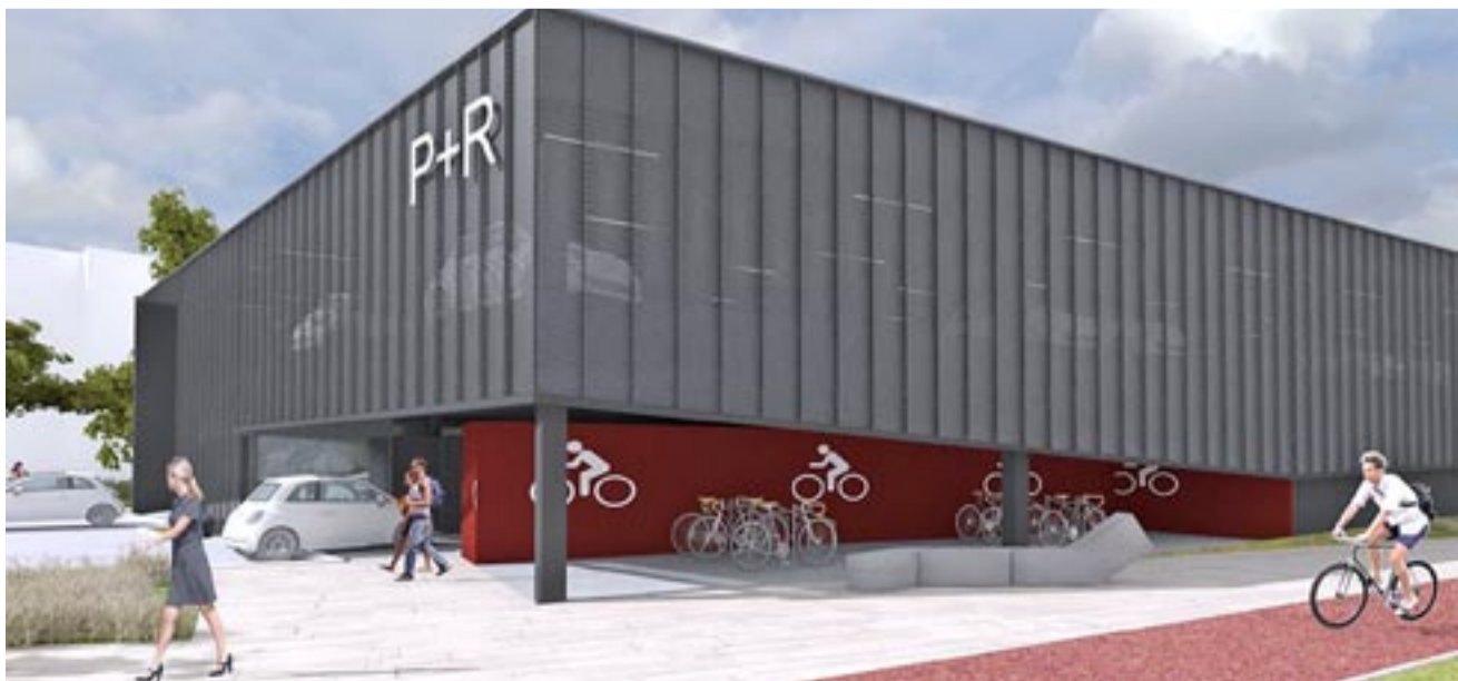
Tak, po zakończeniu budowy w końcu czerwca 2022 roku, będzie wyglądać nowy parking przy szpitalu.

Całkowita wartość projektu wynosi blisko 15 mln zł z czego dofinansowanie z Regionalnego Programu Operacyjnego Województwa Śląskiego stanowi ponad 81 procent (11,5 mln zł). RM