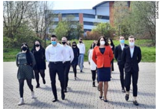
Zamiast na studniówce, maturzyści z TEB Edukacja zatańczyli poloneza na parkingu.

W Technikum Zespołu Szkół nr 6 maturę zdają 92 osoby i będzie ona przebiegała podobnie jak w ubiegłym roku, w poszczególnych salach również będzie pisało egzamin mniej uczniów. Do budynku wchodzić będą czterema wejściami, o różnych godzinach. Oddzielne dla grup są szatnie i ubikacje, a poszczególne grupy się nie stykają ze sobą, bo znajdować się będą w różnych częściach szkoły. Tutaj także najczęściej uczniowie wybierali jak dodatkowe język angielski rozszerzony oraz geografię. Jak w każdej szkole, w sytuacji alarmowej obowiązują określone instrukcje i procedura postępowania, odbyło się też spotkanie z policjantem.