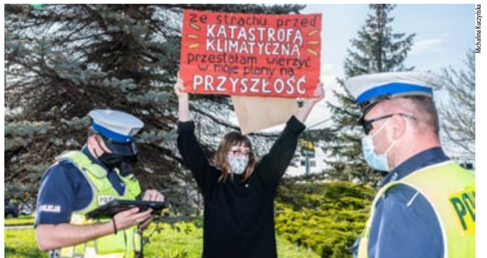
Tyska aktywistka została usunięta z ulicy, wylegitymowana i pouczona.

lowym zakłóceniu ruchu drogowego przez samotnych aktywistów. Chodzi o zwrócenie uwagi