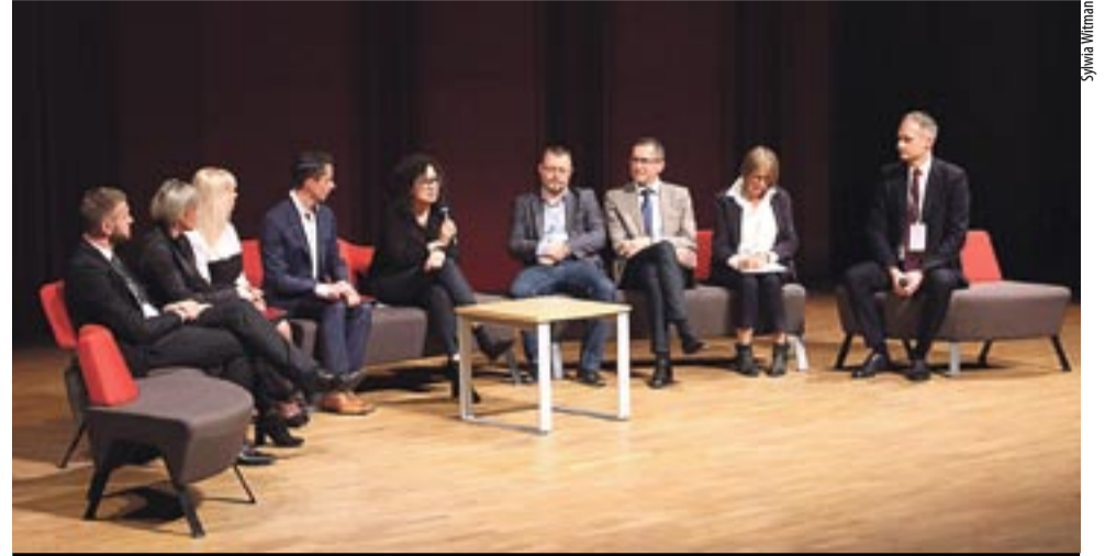
PRELEGENCI KONFERENCJI „UCZENIE PRZEZ DZIAŁANIE”: