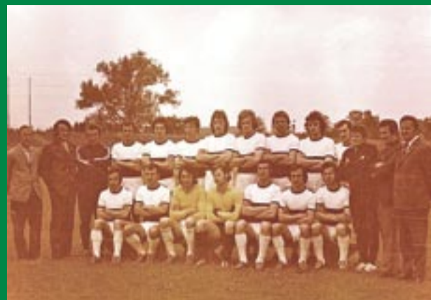
Drużyna GKS-u Tychy w sezonie 1973/74.