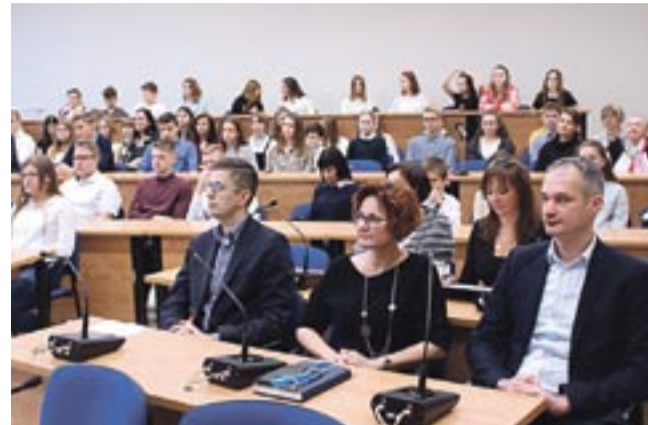
Kilkudziesięciu uczniów tyskich podstawówek wzięło udział w spotkaniu w urzędzie miasta.

W jaki sposób te pomysły mają się „przebić”? Wiceprezydent mówił m.in. o budżecie partycypacyjnym (w którym każdy może zgłosić swój projekt, bo nie ma ograniczeń wiekowych), a także o Młodzieżowym Budżecie