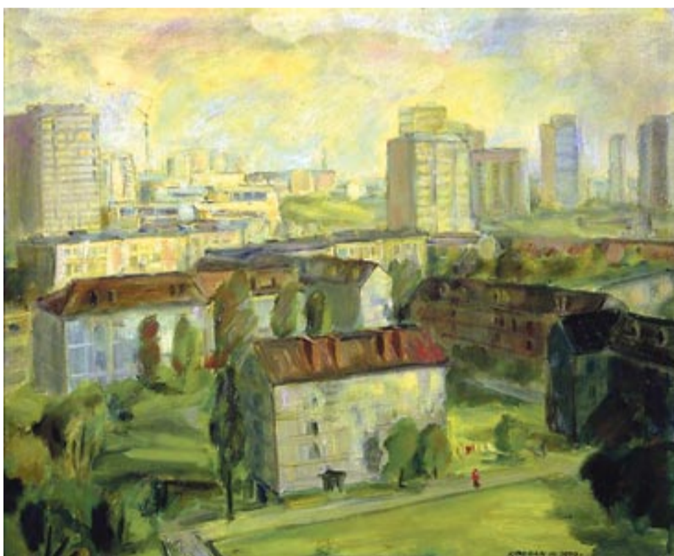
„Tychy. Widok z wieżowca” (olej na płótnie). Powstała w 1979 roku praca Witolda Kołbana - ze zbiorów Muzeum Miejskiego w Tychach.

Witolda Kołbana pożegnaliśmy w miniony czwartek, 28 listopada, mszą żałobną w kościele pw. Świętej Rodziny w Tychach. WW