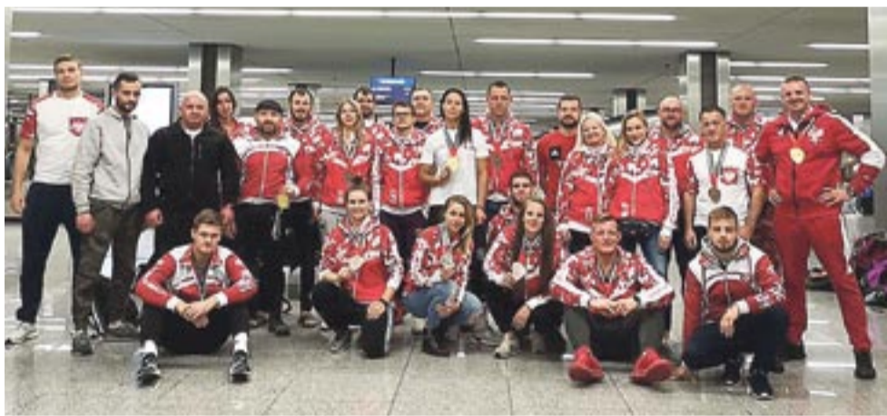
Reprezentacja Polski na mistrzostwa świata w ju-jitsu. Tyski mistrz – pierwszy z prawej.

sił pierwszeństwo, bo miał czerwone światło i czołowo zderzył się z naszym autem. Wystrzeliły wszystkie poduszki, a uderzenie było tak silne, że z taksówki zniknęła 1/4 maski, a z tego drugiego auta została tylko kabina kierowcy, bo cały przód został oderwany i silnik wypadł na jezdnię. Na szczęście wszyscy przeżyli ten wypadek. Jechałem na przednim fotelu i życie uratowały mi pasy bezpieczeństwa i poduszki. Skończyło się jedynie na stłuczeniach. Wsiadłem z auta i pobiegłem zobaczyć co się stało z kierowcą drugiego samochodu. Wyciągnąłem go ze środka, bo z auta zaczęły wyciekać różne płyny i nie wiadomo, jak by się to mogło skończyć. Kiedy wróciłem, kierowca naszej taksówki był w takim szoku, że wydrukował w aucie rachunek i nam go podał. Dopiero jakiś czas potem zdałem sobie sprawę, że to mistrzostwo świata mogło być moim ostatnim... Jaka z tego nauka? Zawsze trzeba jeździć z zapiętymi pasami! ●