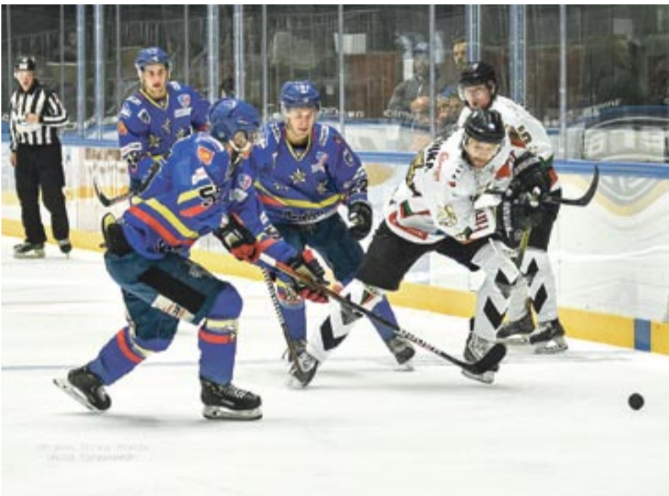
W meczu z Podhalem tyszanie wygrali dzięki dobrej grze w trzeciej tercji. W spotkaniu z JKH Jastrzębie było odwrotnie.

27-28 grudnia na Stadionie Zimowym rozegrana zostanie kolejna edycja Pucharu Polski z udziałem JKH GKS Jastrzębie, GKS Tychy, Unii Oświęcim i Podhala Nowy Targ. Sprzedaż biletów rozpocznie się 2.12 w kasach Stadionu Miejskiego i w sklepie klubowym GKS Tychy. Bilety na jeden mecz: półfinał – 25 i 15 zł, finał – 45 i 25 zł. Karnet na wszystkie mecze – 50 i 30 zł. LS