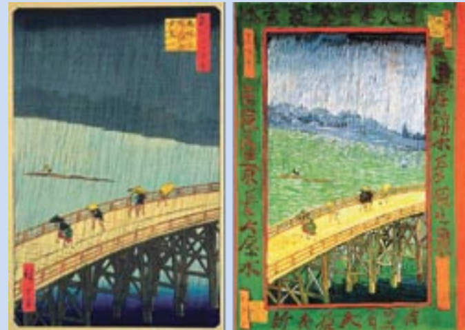
Van Gogh nie odwzorowywał japońskich drzeworytów jeden do jednego. Jego wersje różnią się od oryginału. Z lewej Hiroshige: „Wieczorny deszcz w Atake i Wielki Most”, po prawej „Most w deszczu” van Gogha.

Van Gogh wziął płótno o standardowych rozmiarach i pod względem kompozycji bardzo dokładnie odwzorował dzieło Hiroshige. Zmienił kolory: malował wyłącznie podstawowymi barwami, a ze swojej palety (wzorem impresjonistów) wyłączył czerń, szarość i biel.