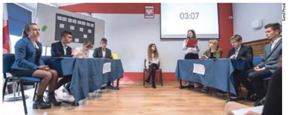
W turnieju debat oksfordzkich wzięli udział uczniowie wszystkich ośmiu klas pierwszych.