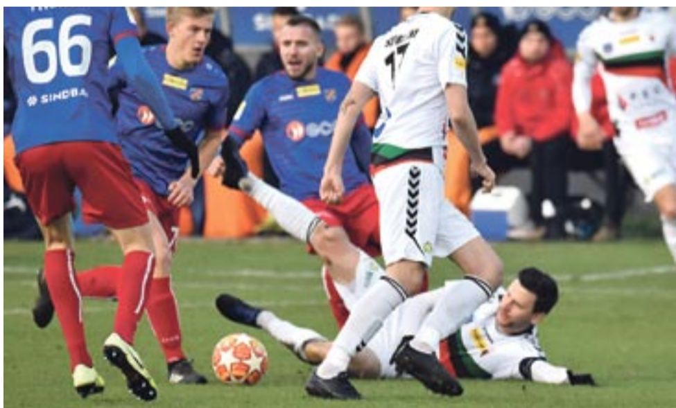
Gospodarze nie przebierali w środkach, by zatrzymać atakujących tyszan.

Wśród GKS Tychy zagra o awans do ćwierćfinału PP.