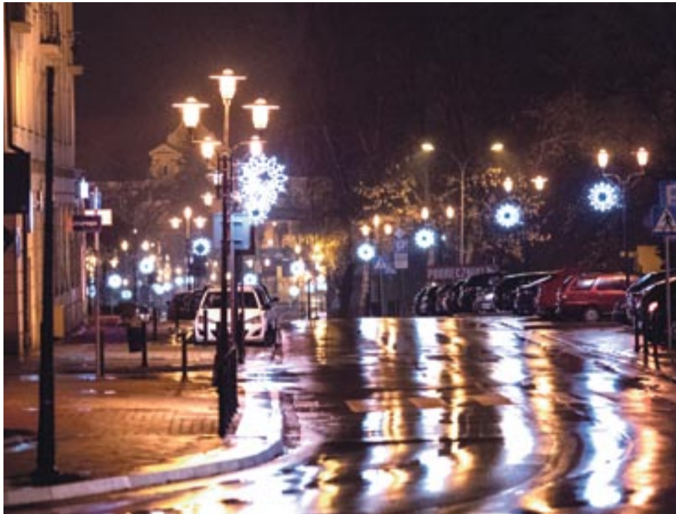
W minionych latach tyskie ulice i place wyglądały urzekająco. Podobnie będzie i w tym roku.

Na placu św. Anny pojawiła się choinka oraz ozdoby na latarniach. Świątecznie ustrojony został także napis TYCHY na al. Niepodległości. Oprócz tego, świąteczną oprawę zyskały ulice: Niepodległości, Sikorskiego, Bocheńskiego, Budowlanych, Bielska, Damrota, Dmowskiego, Katowicka.