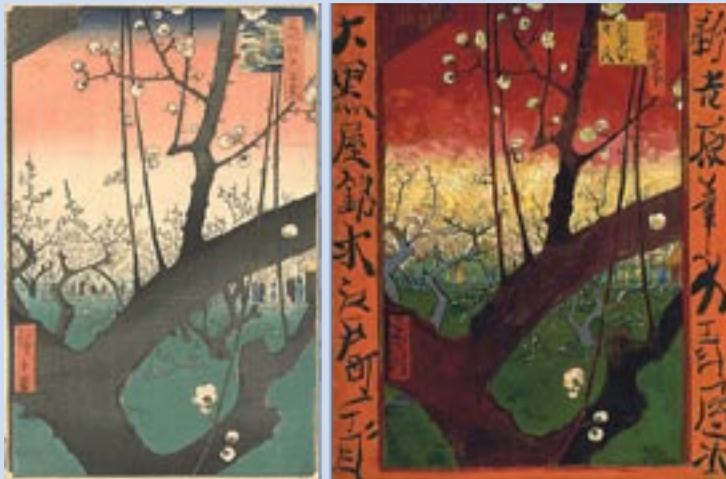
Kwitnąca śliwa van Gogha (z prawej) kontra oryginalny drzeworyt Hiroshige (z lewej).

tyści, a że cena po jakiej sprzedawano drzeworyty była przystępna, wielu z nich tworzyło własne kolekcje. Z barwnych, pełnych ekspresji, a niekiedy i odważnych drzeworytów japońskich (wszak wiele z nich przedstawiało uciechy zmysłowe i przyjemności) pełnymi garściami czerpali tacy wielcy jak Toulouse-Lautrec, Bernard czy Gauguin. W tym kręgu znalazł się także Vincent van Gogh, który nie dość że zbierał drzeworyty, to w dodatku był nimi zafascynowany. Umieszczał je w tle swoich obrazów m.in. na portretach ojca Tanguya czy Agostiny Segatori – właścicielki awangardowego lokalu o nazwie „Le Tambourin”. A że kobieta ta wówczas miała romans z Vincentem, to właśnie w tej restauracji van Gogh urządził wystawę swojej dość potężnej kolekcji japońskich plansz.