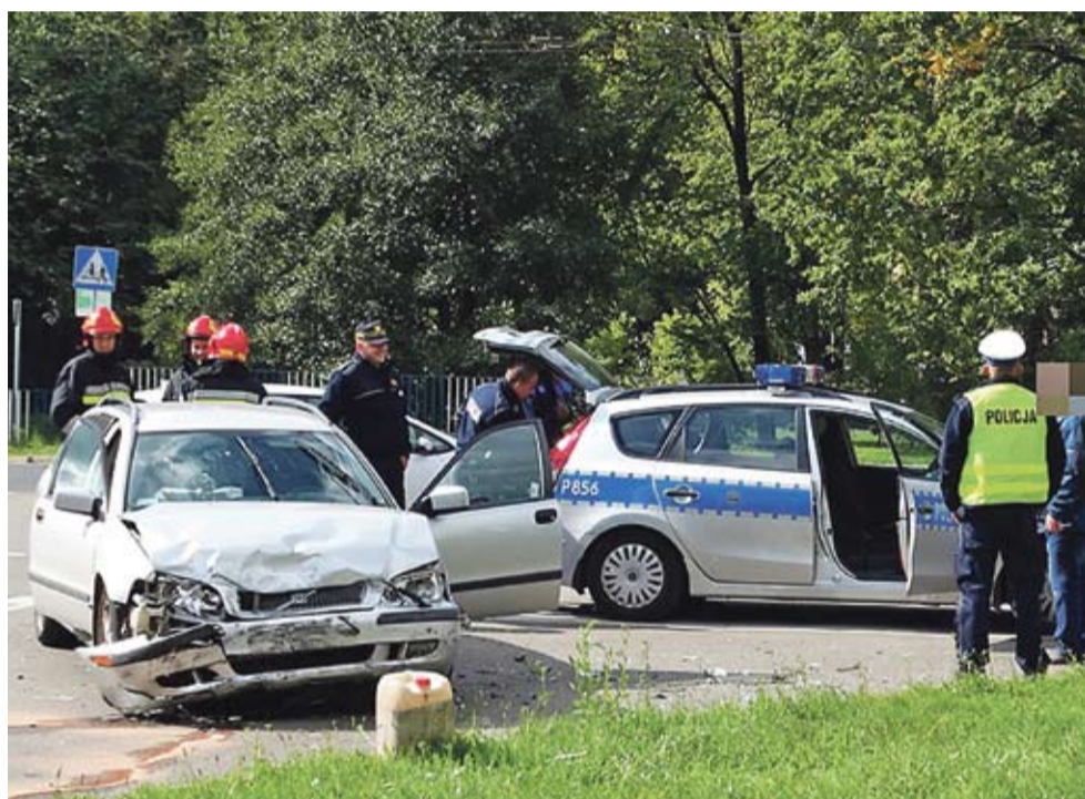
Wymuszenie pierwszeństwa przejazdu było przyczyną wypadku na ul. Sikorskiego.

◆ NA UL. SIKORSKIEGO DO SZŁO 19.09 DO WYPADKU. Kierujący samochodem marki rover, 57-letni mieszkaniec Bierunia wykonując skręt w lewo, wymusił pierwszeństwo przejazdu na kierującej volvo. Jadąca z przeciwka 38-letnia kobieta doznała złamania prawej ręki i została przewieziona do szpitala. Uczestnicy zdarzenia byli trzeźwi. LS