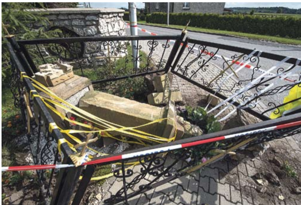
Prace renowacyjne ruszą dopiero na wiosnę.