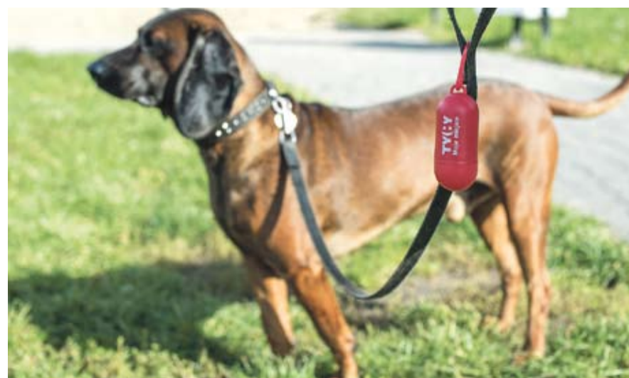
Zawieszki można odebrać m.in. w Biurze Obsługi Klienta w Urzędzie Miasta.