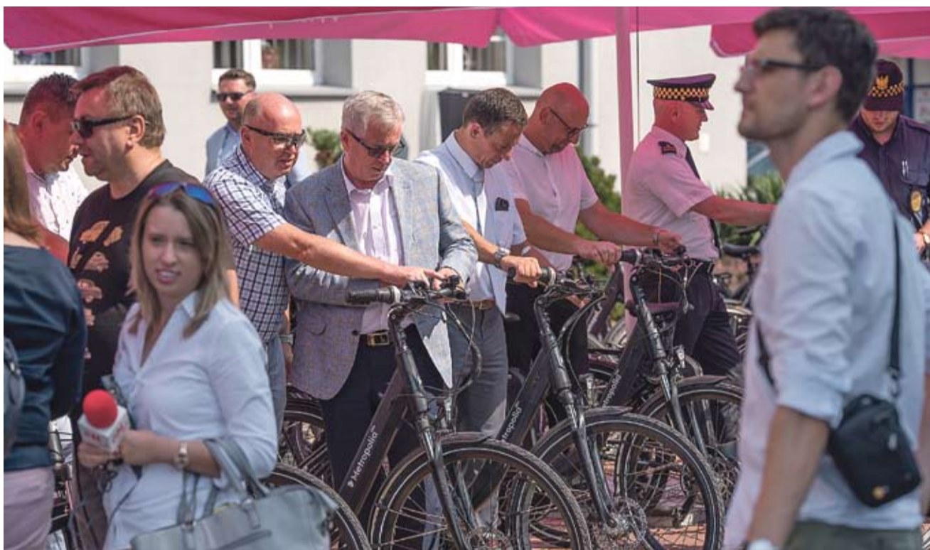
Dziewięć z 230 rowerów elektrycznych trafi do tyskich urzędników.

– Rowery napędzane silnikiem elektrycznym stają się coraz popularniejsze, ponieważ umożliwiają wygodne przemieszczanie się niezależnie od wieku, ukształtowania terenu czy kondycji. Pamiętajmy, że taki pojazd nie zwalnia użytkownika z obowiązku pedalowania. Jak każdy rower, tak i ten napędzamy siłą własnych mięśni. Silnik elektryczny stanowi jedynie uzupełnienie, dzięki czemu wysiłek fizyczny jest mniejszy. Poza tym każdy rodzaj aktywności fizycznej jest lepszy niż siedzenie za kierownicą auta. Więcej rowerzystów to także mniej samochodów na ulicach. A mniej samochodów oznacza mniej zanieczyszczeń, którymi