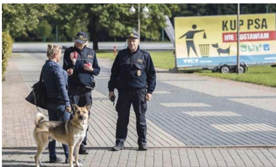
Strażnicy miejscy podczas patroli rozdają tyszanom zawieszki do smyczy.