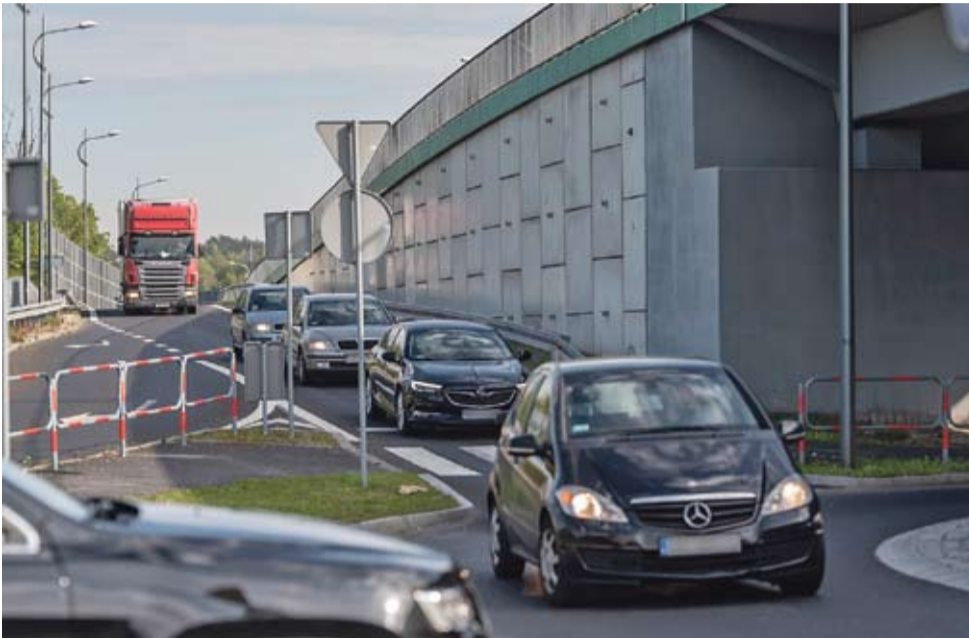
Cały ruch tranzytowy na DK1 zamiast górą wiaduktu odbywa się teraz przez rondo pod wiaduktem.