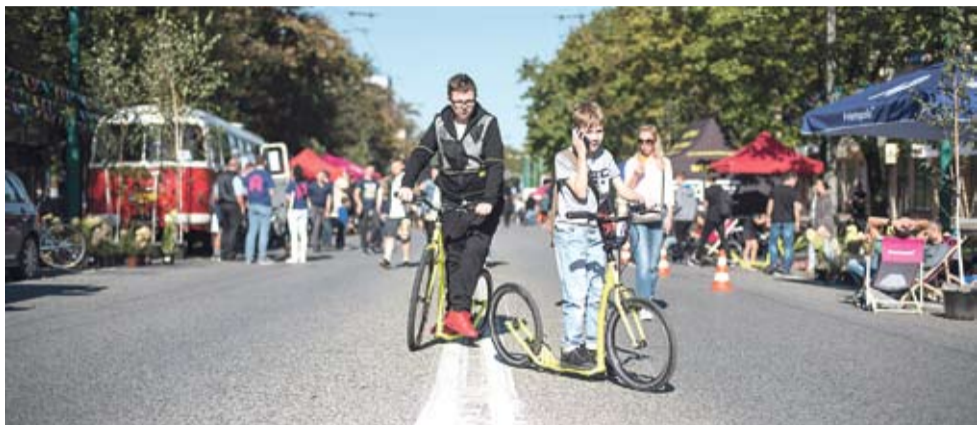
W niedzielę najmłodszy mogli bezkarnie hasać na swoich pojazdach środkiem ul. Grota-Roweckiego.

TYCHY PRZYŁĄCZYŁY SIĘ DO MIĘDZYNARODOWEJ KAMPANII PROPAGUJĄCEJ ALTERNATYWNE ŚRODKI TRANSPORTU.