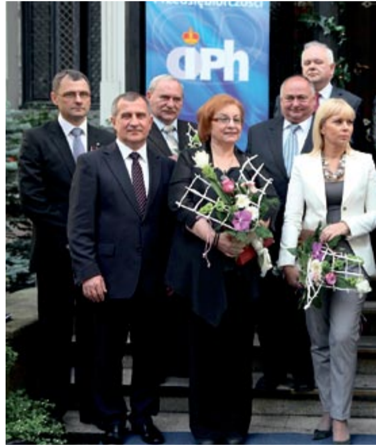
Tegoroczna Gala odbyła się w Zameczku Myśliwskim w Promnicach. Hermi zasłużonym dla Tychów i regionu.

Statuetkę dla WYBITNEJ POSTACI REGIONU odebrał prof. Jerzy Buzek, natomiast nagrodę specjalną – PROMOTORA PRZEDSIĘBIORCZOŚCI – otrzymała minister rozwoju regionalnego Elżbieta Bieńkowska, za efektywne pozyskiwanie funduszy europejskich.