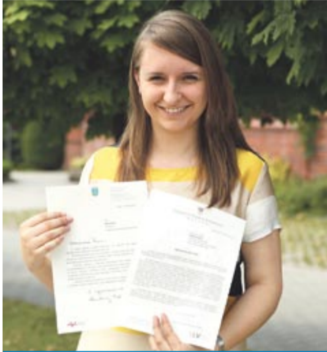
Marta ma wiele pasji, ale jej główne zainteresowania to muzyka i działalność społeczna.