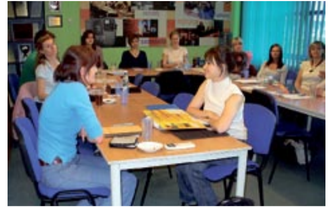
OIPH wiele uwagi poświęca programom pomocowym, w tym - szkoleniom.

– W związku z pogarszającą się sytuacją na lokalnym rynku pracy, związaną m.in. ze zwolnieniami grupowymi w tyskiej fabryce Fiat Auto Poland S.A., Izba w bieżącym roku rozpo-