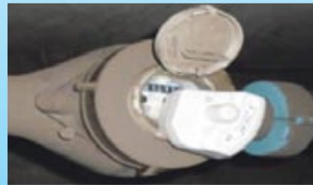
Wodomierz przemysłowy z nakładką radiową.

czasu. Potem zaczyna się część inwestycyjna projektu, która trwa mniej więcej tyle samo.