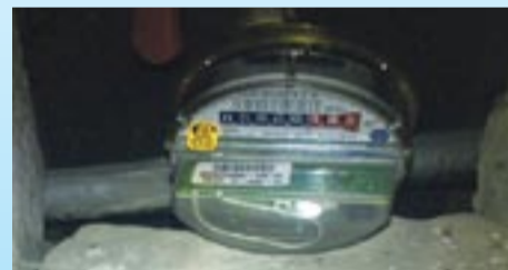
Wodomierz lokalowy z nakładką radiową.

Kolejnym etapem jest wykonanie docelowego otworu oraz dokumentacji hydrogeologicznej ustalającej zasoby wodonośne. Dokumentacja ta umożliwi rozpoczęcie procedury związanej z projektowaniem i budową stacji uzdatniania wody. Jeżeli zgoda zależy od lokalnego właściciela, sprawa ma szansę przebiec sprawnie. Problemy na tym etapie zaczynają się momencie, kiedy właściciel takiej zgody nie wyrazi lub jeżeli np. właścicielem terenu są Lasy Państwowe. Wówczas lokalizacja „upada” lub droga administracyjna znacznie się wydłuża. Do tego dodać trzeba uzyskanie zgody Urzędu Górniczego, przeprowadzenie uzgodnień środowiskowych, uzyskanie opinii „sąsiadów” i mamy prawie pełny obraz działań, jakie trzeba podjąć. Realizacja etapu przygotowawczego przekracza rok