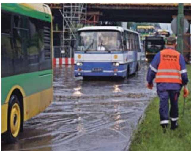
10 czerwca, pod wiaduktem przy Tesco nie można było przejechać.

ODPOWIADA KRZYSZTOF ZALOWSKI, PRZESZ ZARZĄDU I DYREKTOR NACZELNY RPWIK W TYCHACH: Nie wiązałbym powyższego zjawiska wyłącznie z ogólnie rozumianym działaniem kanalizacji deszczowej. Takiego nawalu wody, jak w czasie ostatnich ulew, nie jest w stanie odprowadzić żadna instalacja projektowana na przeciętne opady.