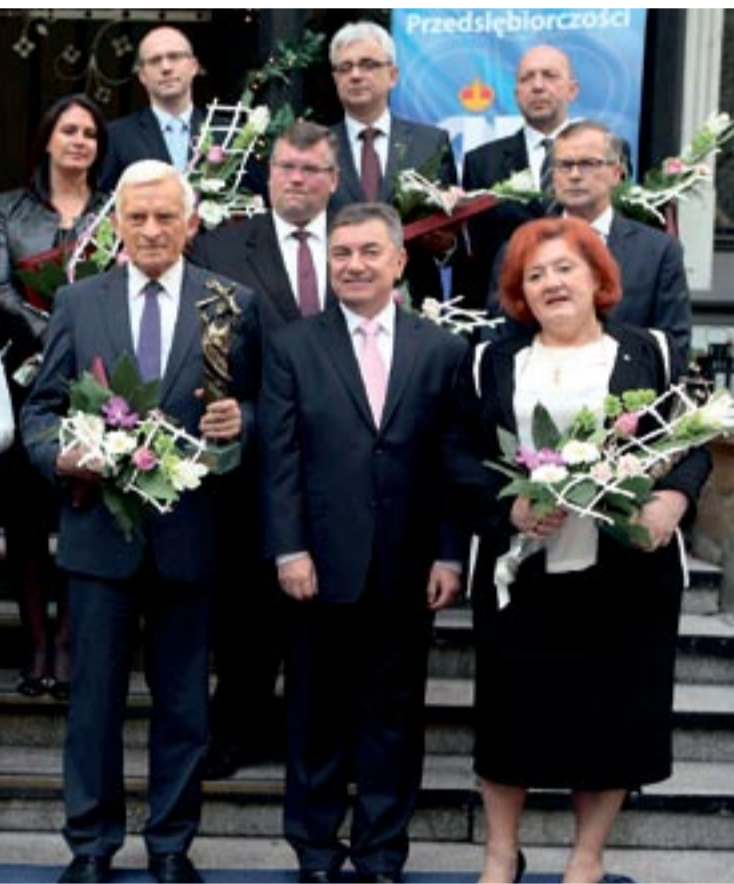
esy Biznesu przyznano przedsiębiorcom, firmom oraz osobom

Budżet unijny na lata 2014-2020 będzie budżetem wybitnie dla przedsiębiorców. Ten, który mieliśmy, był budżetem infrastrukturalno - przedsiębiorczym, następny będzie przedsiębiorczo - naukowo - infrastrukturalny. Znajdzie się w nim rzecz jasna infrastruktura, bo tu do zrobienia nadal jest jeszcze sporo, jednak kilkakrotnie więcej środków przeznaczonych zostanie dla przedsiębiorców. Nastąpił bowiem czas, kiedy musimy w sposób bardziej znaczący wzmocnić konkurencyjność polskiej gospodarki. W programie regionalnym znajdą się m.in. dotacje i pożyczki bezpośrednie dla małych i średnich przedsiębiorstw. Natomiast program operacyjny „Inteligentny rozwój” zostanie skierowany do wszystkich rodzajów firm, prócz mikro, na połączenie nauki z biznesem, na rozwój działów badawczych, tworzenie nowych rozwiązań, pomysłów, wdrażanie innowacji. Środki te będą również przeznaczone na współpracę firm z uczelniami. Wartość programu to 7,5 – 8 mld euro.