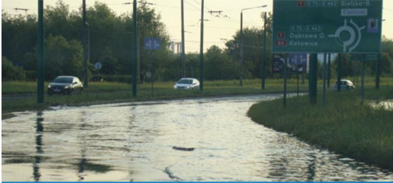
W sobotę nad Tychami znów przeszła burza z gradem. Tym razem jednak straty nie były tak wielkie, jak dwa tygodnie temu.

Miejski Zarząd Budynków Mieszkalnych wycenił straty w swoich zasobach na ponad 1,2 mln zł. Bardzo ucierpiały cztery budynki przy ul. Katowickiej (osiedle Osada). Całkowicie została tam zniszczona połać dachowa, a także okna na klatkach schodowych i rynny. Naprawa zniszczeń będzie kosztowała w sumie 400 tys zł. Na osiedlach A i B najwięcej szkód związanych jest z uszkodzeniami da-