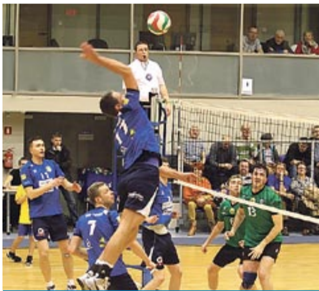
W nowym sezonie spotkamy się z tyskimi siatkarzami na zapleczu ekstraklasy!