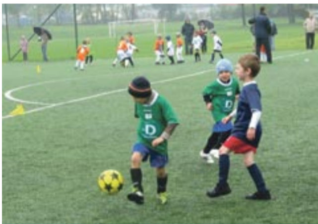
W turnieju startuje ok. 120 przedszkolaków.