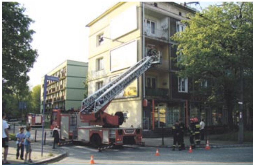
W ubiegły czwartek strażacy pomagali policji dostać się do mieszkania, w którym zasnął 86-letni mężczyzna. Rannego przewieziono do szpitala.

Na co dzień dominują jednak drobniejsze interwencje: pożary śmietników, usuwanie gniazd szerszeni, kolizje drogowe, po których