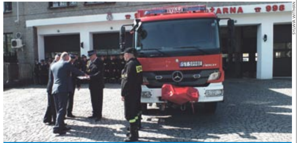
Podczas uroczystości Dnia Strażaka, 8 maja, został zaprezentowany nowy samochód kwatermistrzowski Mercedes Benz Atego o ładowności 6 ton, będący od niedawna na wyposażeniu tyskiej komendy. Pojazd został zakupiony ze środków budżetu państwa i Funduszy Ochrony Środowiska.

W Komendzie Państwowej Straży Pożarnej w Tychach pracuje 102 strażaków. 19-osobowe zmiany pełnią całodobowe dyżury. Do wyruszenia w każdej chwili gotowi są nie tylko ludzie, ale też sześć samochodów, w tym wozy gaśnicze (mieszczące w zbiornikach od 2,5 do 8 ton wody), samochód ratownictwa technicznego pełen specjalistycznego sprzętu, samochód z drabiną o zasięgu 37 metrów. W centrali przy telefonach stale czuwają dwaj funkcjonariusze. Odbierają połączenia z numeru alarmowego 112 i numeru alarmowego straży pożarnej 998. Dyspozytor ma możliwość, w zależności od rodzaju zgłoszenia, przełączenia rozmowy bezpośrednio na policję, pogotowie ratunkowe lub do straży miejskiej. Gdy przyjmuje zgłoszenie o pożarze, uruchamia alarm, na który natychmiast reagują pozostający w gotowości strażacy. Dyspozytor informuje o rodzaju i miejscu pożaru, wysyła też informacje, które jednostki mają udać się na miejsce zdarzenia. Podczas akcji strażacy przez cały czas mają łączność z centralą, a specjalny system rejestruje dokładny czas meldunków, rozpoczęcia i zakończenia akcji. Po zakończeniu działań wszystko trafia do szczegółowego raportu.