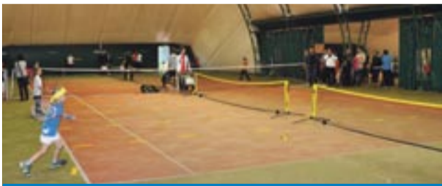
W Tychach rozpoczęto cykl turniejów o Puchar Śląska.

Finały w kat. 10 lat: Karolina Bartusek - Zuzanna Schab 4:1, 4:0 oraz Kamil Strzyszk - Wojciech Górniak 4:1, w. o. LS