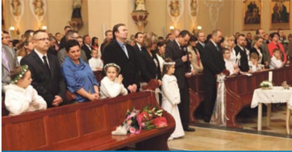
W minioną niedzielę do Pierwszej Komunii Świętej przystąpili dzieci m.in. w kościele pw. św. Marii Magdaleny.

– Nieco skromniej jest w tym roku również jeżeli chodzi o prezenty komunijne. – Najczęściej rozważanym prezentem jest tablet