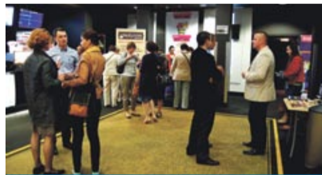
Organizatorzy festiwalu to BEST Centrum Języków Obcych, Multikino w Tychach i Miejskie Centrum Kultury w Tychach.