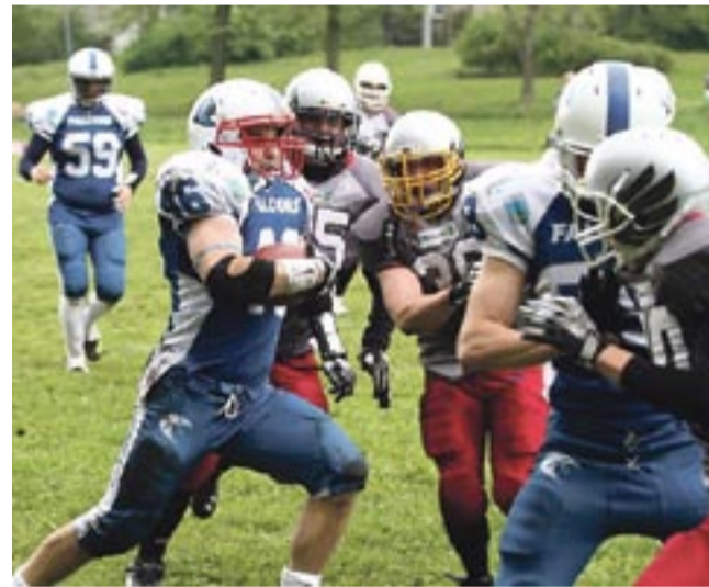
W debiutanckim sezonie w I lidze tyszanie mają na koncie zwycięstwo i porażkę.