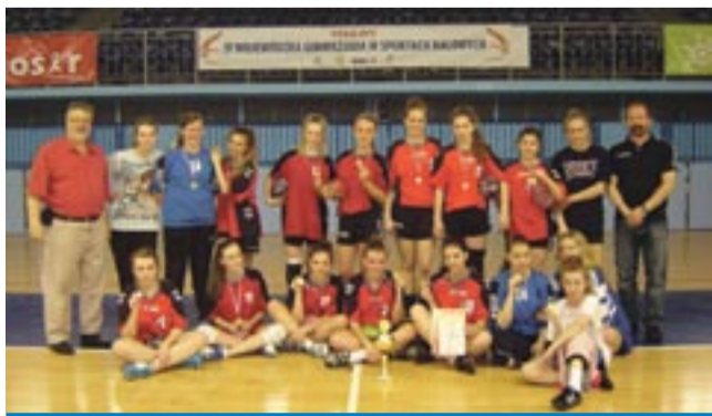
Tyskie szczypiornistki – mistrzyni śląskiej Gimnazjady.