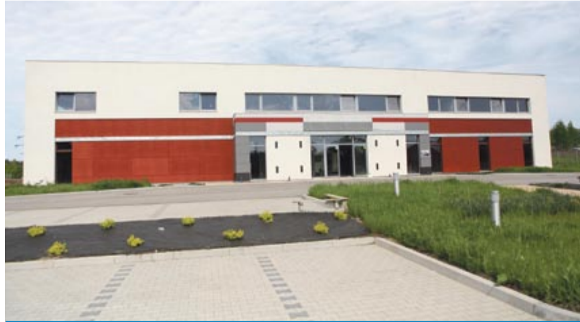
Do zakończenia budowy brakuje jeszcze trzech milionów złotych.

W kolejnym, siódmym etapie budowy, prace prowadzone będą na parterze budynku. Będzie to: wstawianie ścianek działowych i tynkowanie, a także wykonywanie instalacji wodno-kanalizacyjnych i centralnego ogrzewania. – Chcemy doprowadzić parter do stanu deweloperskiego, czyli takiego, jaki