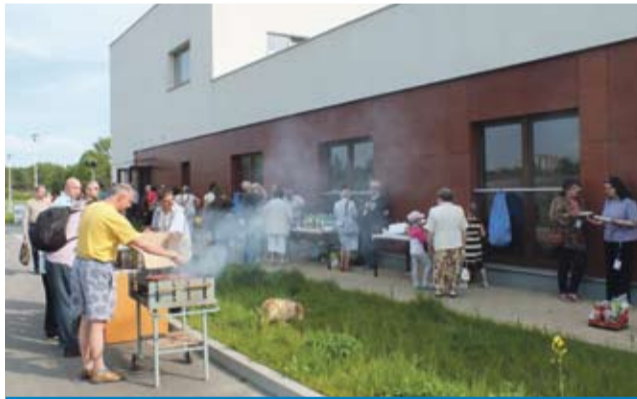
Po zwiedzeniu budynku była okazja do rozmów przy poczęstunku.