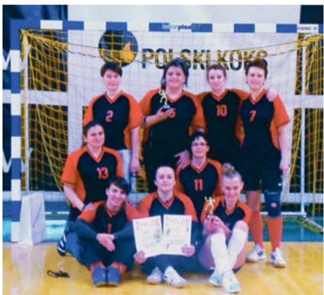
Tyskie „weteranki” – brązowe medalistki turnieju w Jastrzębiu.