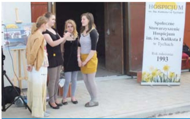
Imprezę uświetnił występ przedstawicielek zespołu Iskierki Bożej Miłości.

Po prezentacji będzie można skorzystać z trolejbusowej przejażdżki po mieście. LS