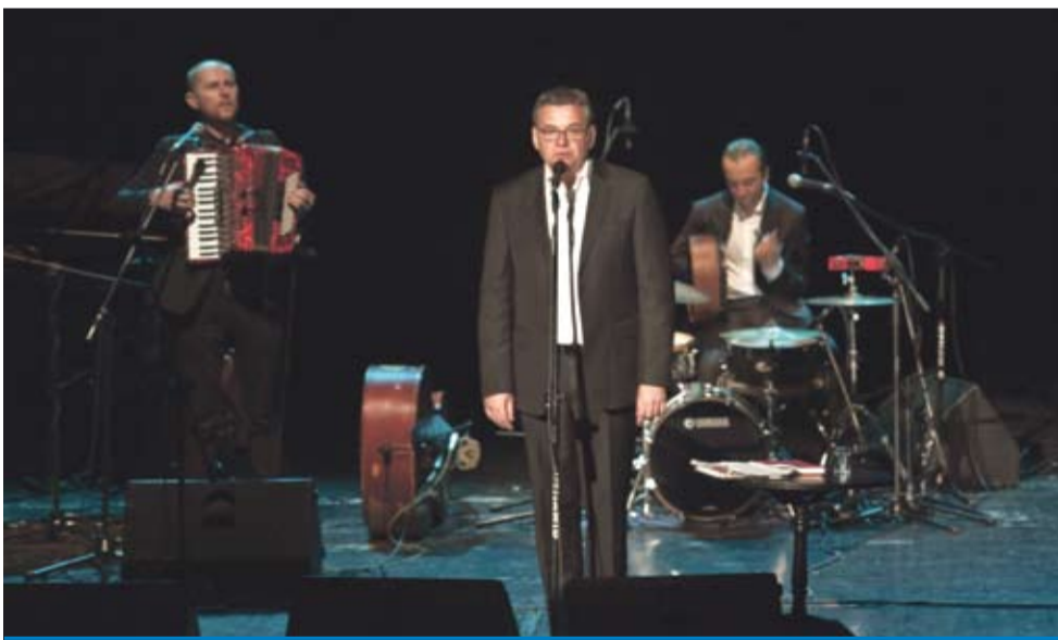
Na zakończenie uroczystości wystąpił Artur Andrus z zespołem.