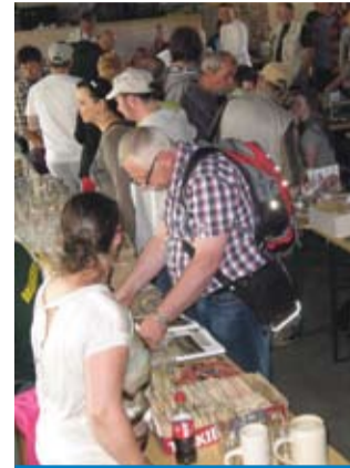
Piwną giełdę chętnie odwiedzają tyszanie.

Po raz pierwszy imprezę zorganizowano w Browarze Obywatelskim i wydaje się, iż jest to idealne miejsce na tego typu przedsięwzięcie. – Giełdę organizowaliśmy już w kilku miejscach, w tym na lodowisku, ale ten stary browar, budynki, mury i wnętrza nadają imprezie fantastyczny klimat. Mam nadzieję, że kolejne giełdy także odbędą się tutaj, bo jest szansa, iż wkrótce oddane zostanie wielkie pomieszczenie w budynku