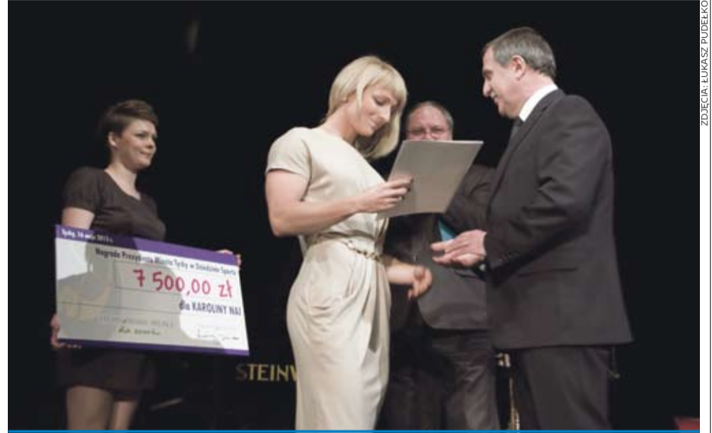
Nagrodę w dziedzinie sportu zdobyła znakomita kajakarka, brązowa medalistka Igrzysk Olimpijskich w Londynie, Karolina Naja.