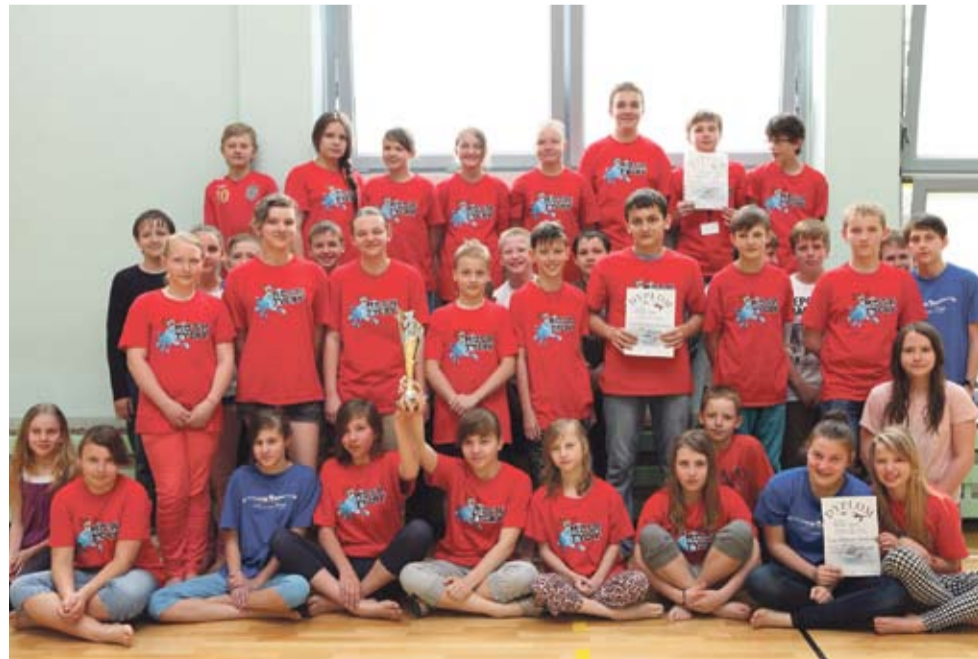
LS Pływacka ekipa MOSM zajęła w Lidze Klubów Śląskich rocznika 2001 drugie miejsce.

Podczas wszystkich czterech rund, drużyna MOSM zdobyła 5 złotych, 2 srebrne i 2 brązowe medale, zajmując w klasyfikacji generalnej drugie miejsce.