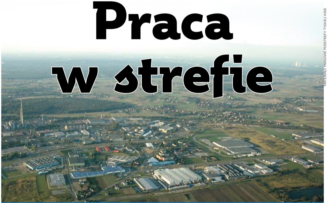
MATERIAŁY PRASOWE PODSTREFY TYSKIEJ KSSE

Kolejne firmy planują rozpocząć działalność w tyskiej podstrefie KSSE.