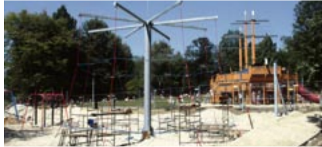
Paprocany mogą się pochwalić drugim w Polsce linarium.