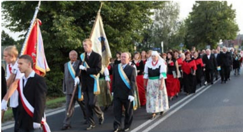
Po mszy uczestnicy przemaszerowali pod pomnik ku czci poległych Powstańców Śląskich.