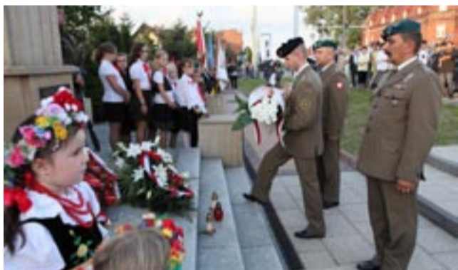
Kwiaty i wieńce pod pomnikiem złożyli przedstawiciele władz miasta, wojska, postówie, radni, dzieci, a także kibice.

Ryszard Karczmarek – I wojna światowa i okres powstań i plebiscytu. Tychy – monografia miasta.