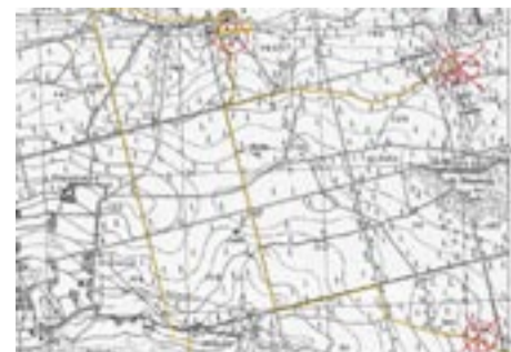
W zaznaczonych miejscach być może znajdują się kamienie.