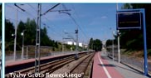
„Tychy Grota Roweckiego”