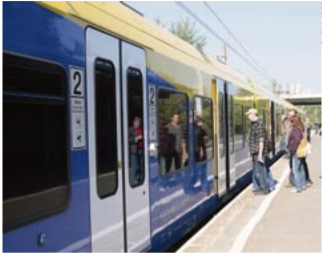
Dziś z Tychów odjeżdżają w dni robocze 32 pociągi do Katowic, z czego 26 dojeżdża aż do Sosnowca Głównego.

NOWE PRZYSTANKI KOLEJOWE SĄ JUŻ GOTOWE. MZK TYCHY MODYFIKUJE ROZKŁAD JAZDY AUTOBUSÓW I TROLEJBUSÓW, TAK BY JAK NAJWYGODNIEJ BYŁO PRZESIAĆ SIĘ Z NICH NA POCIĄG. CZY TYSZANIE CHĘTNIE TO UCZYNIĄ?