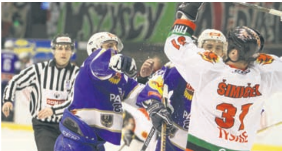
Rywalizacja z Unią była niemałym wyzwaniem dla tyckich hokeistów. W meczach było sporo walki i śpięć.

Podobnie jak ze Stoczniewcem, spotkania z Unią były wyrównanymi, emocjonującymi widowiskami, w których wiele zależało od dyspozycji dnia, czasami lutu szczęścia. Każdy mecz miał swoich