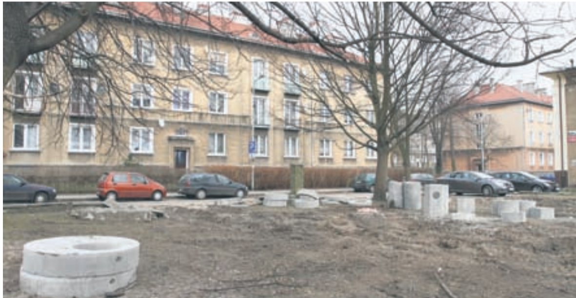
W budżecie miasta przewidziano też pieniądze na budowę parkingu na os. A.

Natomiast przy ul. Wojska Polskiego, w sąsiedztwie przychodni i Nauczycielskiego Kolegium Języków Obcych, powstaje większy parking na 160 samo-