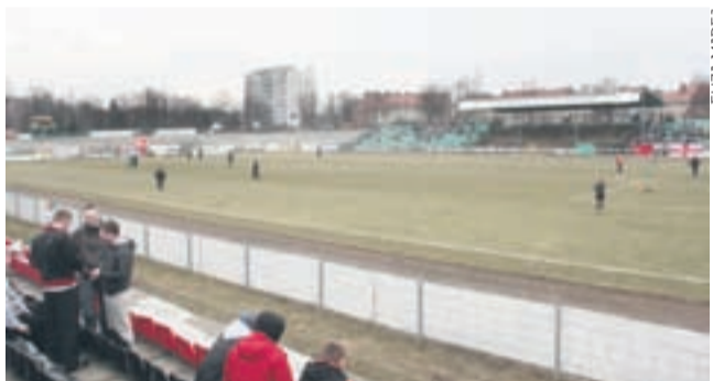
Spółka Tyski Sport S.A. rozpocznie działalność od modernizacji stadionu.