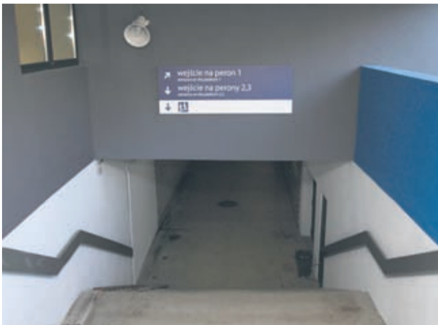
Po odnowieniu peronu, przyjdzie czas na remont tunelu.

Po odnowieniu peronu, do pełnego remontu stacji kolejowej Tychy pozostanie tylko tunel. – A właściwie środek tunelu – podkreślił Michał Gramatyka. – Zejście do tunelu od strony miasta zostało już wykonane na koszt miasta, wejście na peron będzie zrobione na koszt PKP PLK.