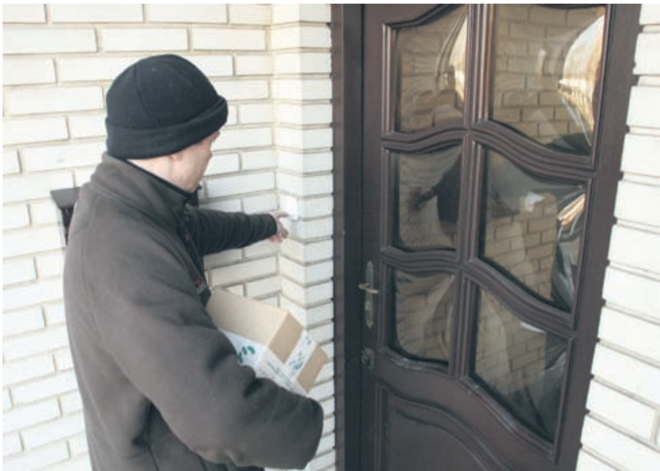
Nie wszyscy akwizytorzy zasługują na nasze zaufanie.