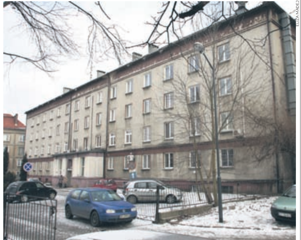
W Szpitalu Miejskim rozpoczęła się budowa zewnętrznego dźwigu.