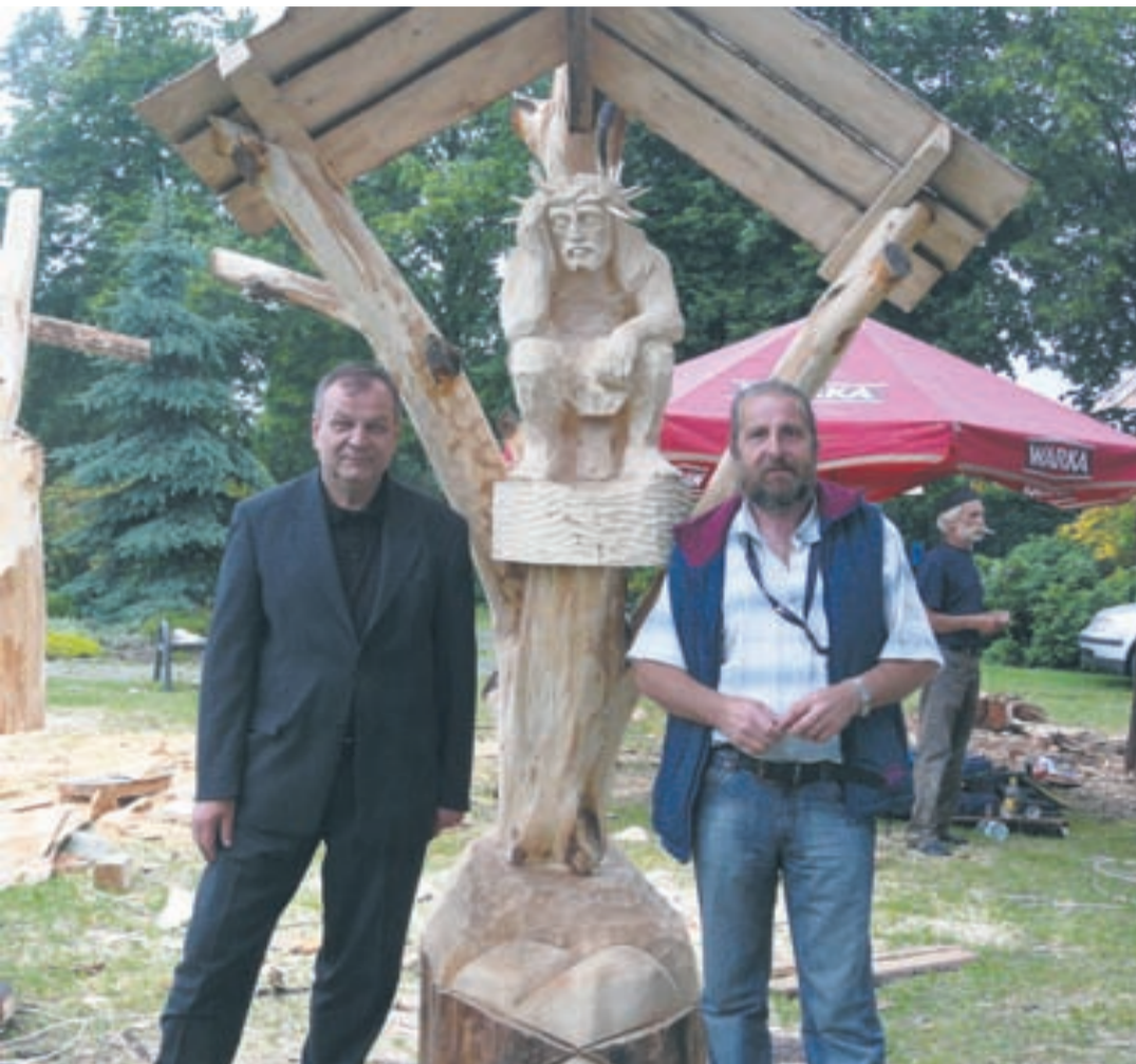
Plenery rzeźbiarskie są też dobrą okazją do spotkań z innymi artystami.

ma czasem 4-5 metrów wysokości, 1,5 metra średnicy, więc dłutkiem się tego nie obróbi. Mam kolegów, którzy pracowali na 8-metrowym pniu ale na Śląsku się takie raczej nie zdarzają. Co innego na północy, w Borach Tucholskich. Tam są pnie o średnicy 2,5 metra! Myślałem o zrobieniu bitwy pod Grunwaldem albo