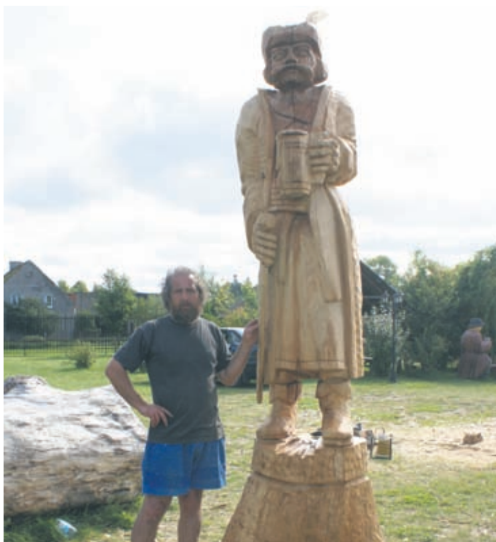
... ale woli raczej duże formy.

wo na opał. Mają również odpowiednie sprzęt. Taki pień