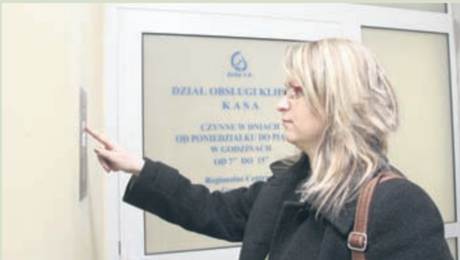
Co miesiąc pracownicy DOK wystawiają średnio 3.600 faktur.

Po przejęciu klientów od Rejonowego Przedsiębiorstwa Wodociągów i Kanalizacji w Tychach S.A., jednym z największych przedsięwzięć działu DOK było sprawne zawarcie ponad 5000 umów w ciągu 2 miesięcy. W związku z tym naszą firmę musiała odwiedzić znaczna część nowych klientów. W chwili obecnej ilość osób odwiedzających DOK znacząco zmalała, co wcale nie oznacza, że zmniejsz