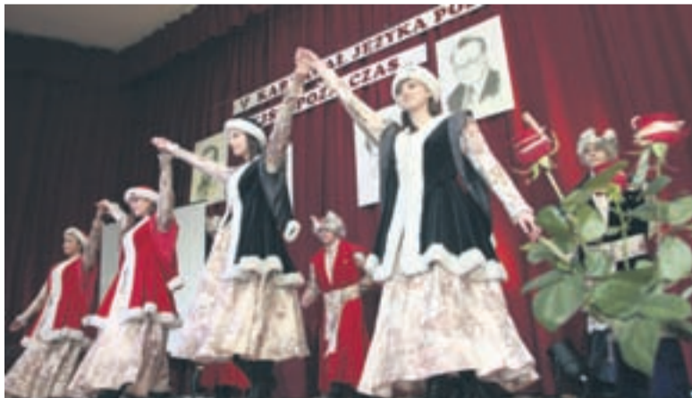
Jak na karnawał z noblistami przystało, spotkania rozpoczęły się od artystycznego występu młodzieży.