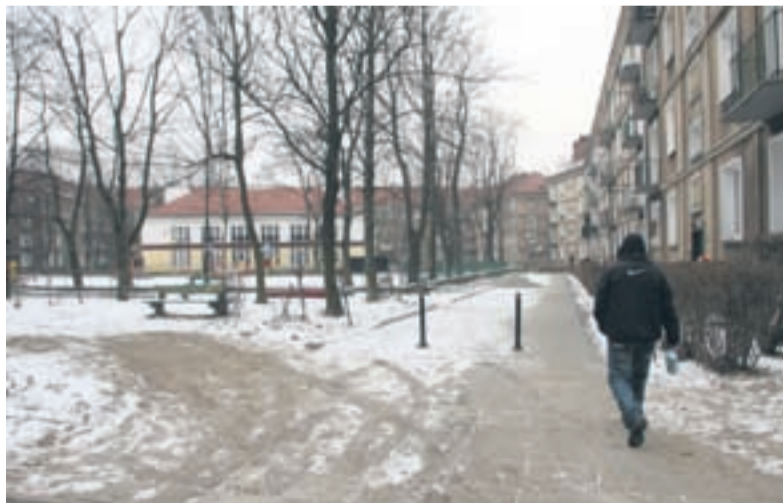
Plac na osiedlu C, w najbliższym czasie będzie modernizowany.

TYCHY ✓ DOBRE MIEJSCE Zapraszamy na miejskie profile społecznościowe