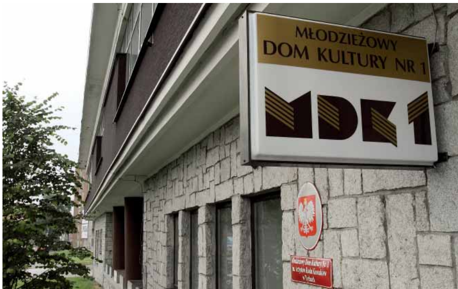
Więcej pieniędzy dostaną m.in. placówki kulturalne. W MDK nr 1 zamontowane zostaną klimatyzatory, wyremontowany będzie dach i podłogi.

PODCZAS OSTATNIEJ SESJI, 24 CZERWCA, TYSCY RADNI PRZEZNACZYLI DODATKOWE ŚRODKI Z BUDŻETU MIASTA NA INWESTYCJE. DZIĘKI PRZYJĘTYM ZMIANOM W BUDŻECIE MIASTA, JESZCZE W TYM ROKU ROZPOCZNIE SIĘ M.IN. BUDOWA BOISKA W DZIELNICY MAKOŁOWIEC ORAZ REMONT BUDYNKU MIESZKALNEGO NA OSIEDLU OSADA W CZUŁOWIE.