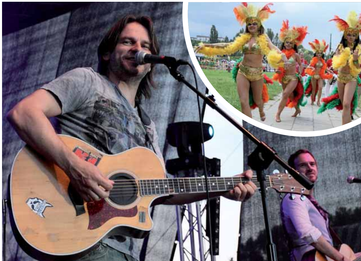
Największą atrakcją tegorocznych Dni Tyskich był koncert „Genesis Classic” w wykonaniu Raya Wilsona i grupy Stilkin.