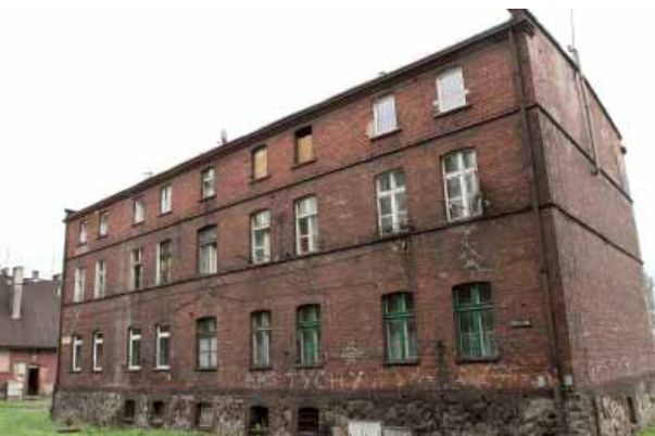
MZBM przygotowuje się do remontu bloków przy ul. Katowickiej