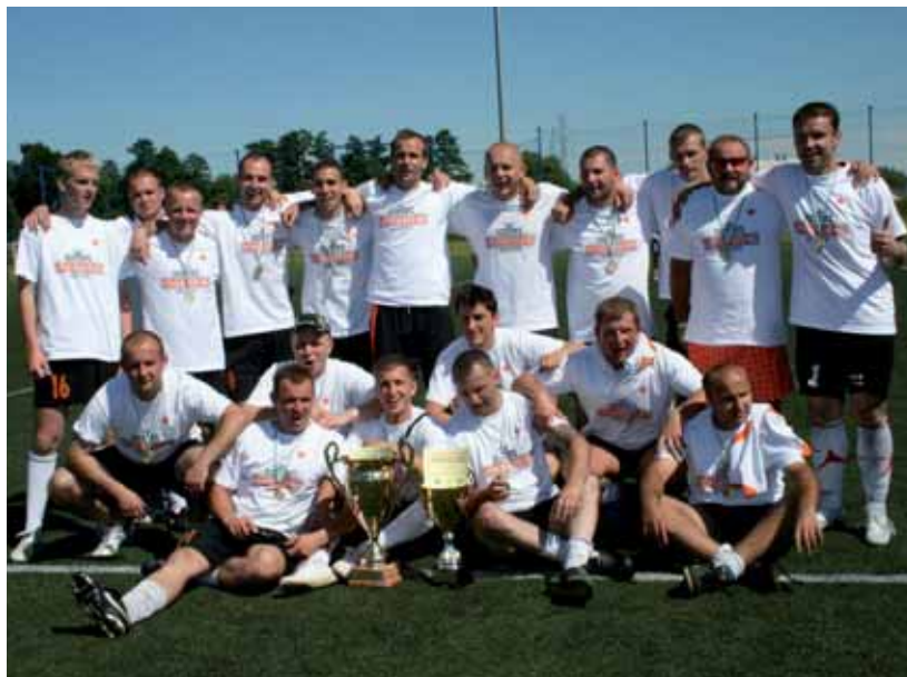
Drużyna Fenomen Ledger - mistrz ALPN i zwycięzca Turnieju Mistrzów.

Turniej wygrał Fenomen Ledger, wyprzedzając Browary, Jorgusie i Budowlanych.