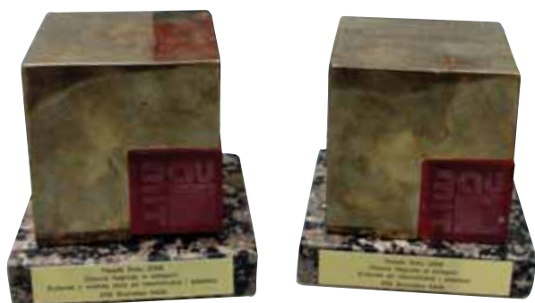
Statuetki konkursu „FASADA ROKU”.

Zakład Remontowo-Budowlany Bronisław Malik powstał przed 19 laty. Firma początkowo zajmowała się wykonywaniem instalacji wod.-kan., c.o. i gazowych. Z czasem jednak zamówień przybywało, doszły prace budowlane, a wraz z nimi rosły możliwości firmy. Po 15 latach działalności firma rozpoczęła przed dwoma laty budowę osiedla „Zielone Wzgórze” przy ul. Dołowej. Inwestycja jest już obecnie zakończona. Teraz planowana jest budowa kolejnego osiedla.