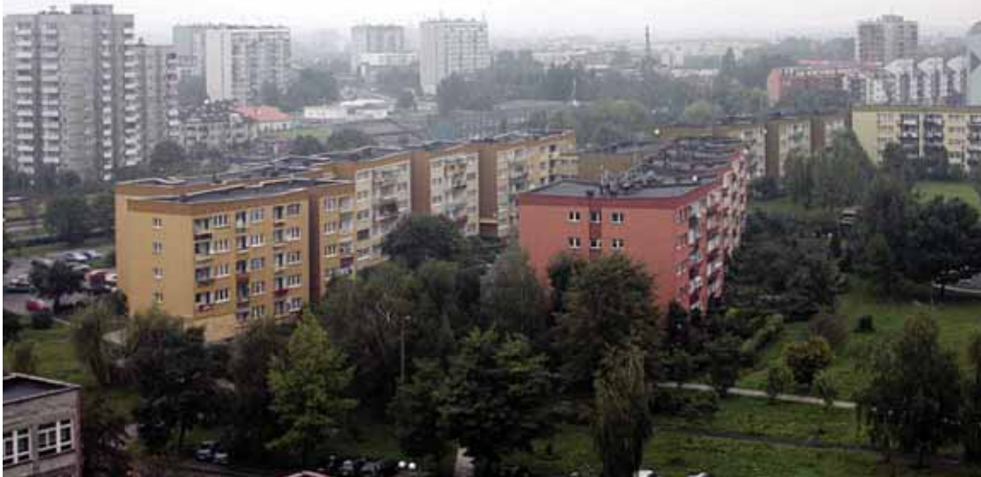
Im cieplej, tym... taniej.

OGRZEWANIE STANOWI OKOŁO 77 PROC. CAŁKOWITEGO ZUŻYCIA ENERGII PRZEZ GOSPODARSTWO DOMOWE. PRZYCZYNA TAK WYSOKIEGO ZUŻYCIA TO GŁÓWNIENISKA IZOLACYJNOŚĆ CIEPLNA BUDYNKÓW. CIEPŁO UCIEKA PRZEZ DACH, ŚCIANY, OKNA. TYMCZASEM NOWOCZESNE TECHNOLOGIE I MATERIAŁY BUDOWLANE POZWALAJĄ ZREDUKOWAĆ ZUŻYCIE ENERGII W STARYCH BUDYNKACH NAWET O 70 – 80 PROC.!