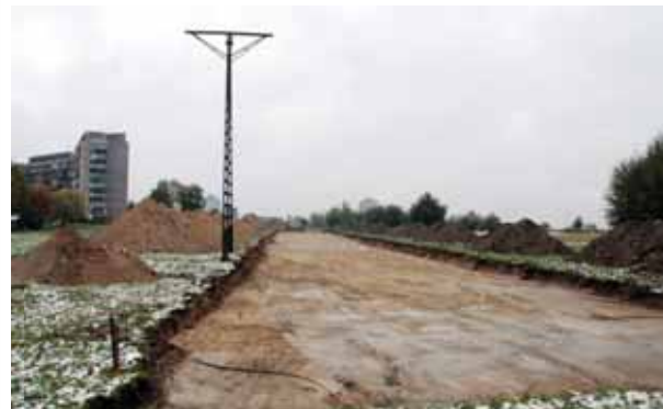
Trwa już budowa drogi łączącej ulicę Sikorskiego i Uczniowską.