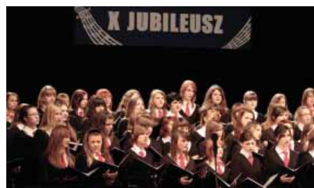
W czasie jubileuszu można było usłyszeć utwory nagradzane na międzynarodowych festiwalach.

Podczas jubileuszowej gali goście składali chórzystkom życzenia – między innymi zdobycia upragnionego, złotego medalu. Jubileusz zakończyły owacje na stojąco po brawurowym wykonaniu utworu „Save Me My Lord” Tomasa Kaznowskiego. MS