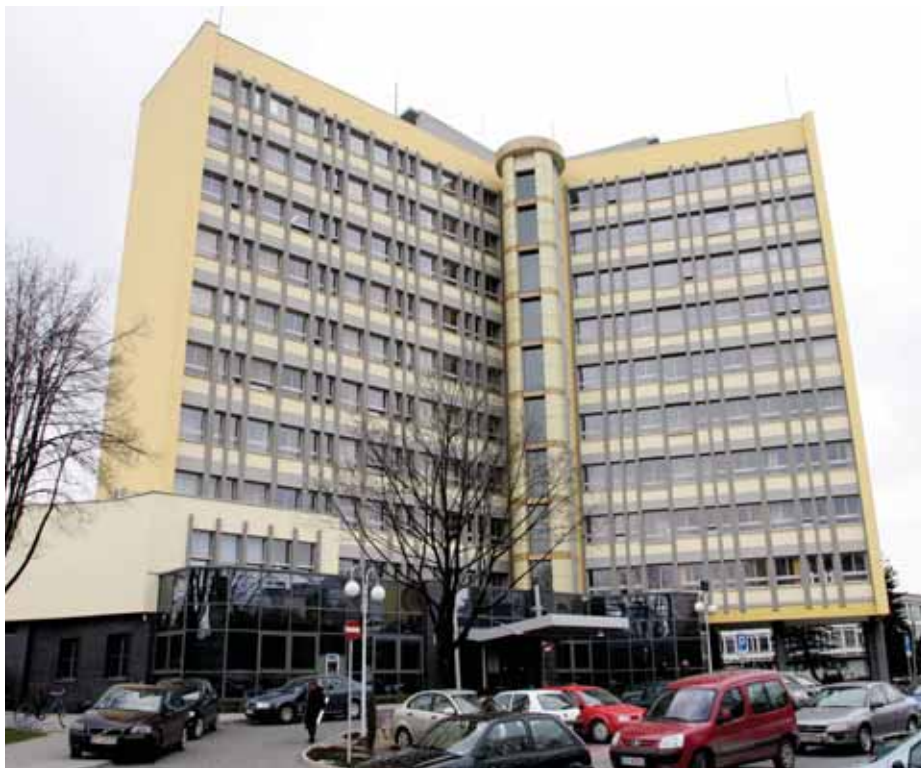
Nagrodzona elewacja Urzędu Miasta Tychy.