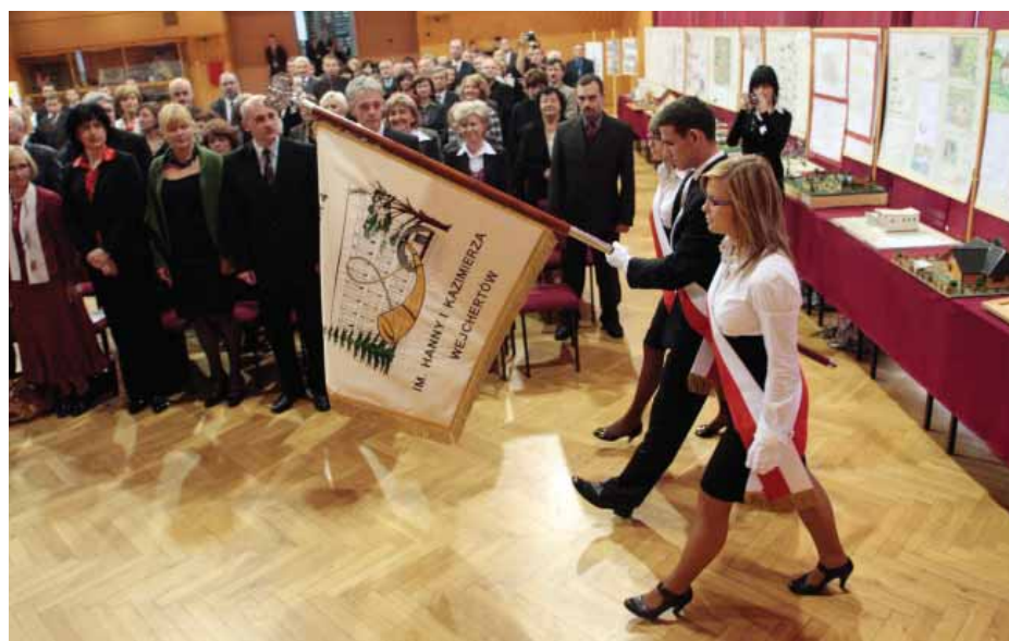
14 października Technikum nr 4 należące do Zespołu Szkół nr 5, przyjęło imię profesorów.

można posługiwać się kartą. Planujemy, że Śląską Kartą Usług Publicznych będzie można płacić m.in. za parkingi na terenie miasta, za korzystanie z obiektów rekreacyjno-sportowych i kulturalnych (m.in. Stadion Zimowy, Kryta Pływalnia, Hala Sportowa, Teatr Mały, Muzeum Miejskie), będzie pełniła funkcję karty dostępowej w Miejskiej Bibliotece Publicznej, umożliwi także pobieranie opłat od mieszkańców w Urzędzie Miasta Tychy – wymienia Marta Witk z UM Tychy. MS