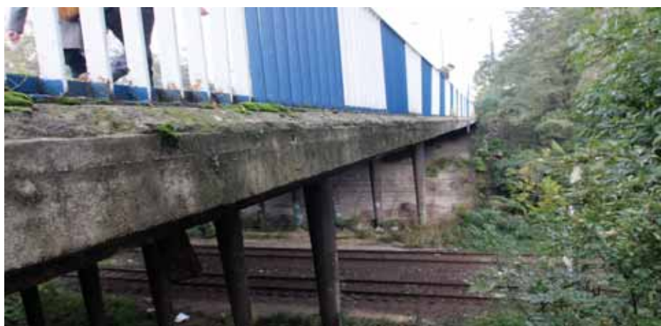
Dzieci urządziły sobie „zabawę” – z wiaduktu przy lodowisku rzucały w pociągi wiozące samochody... kamieniami.