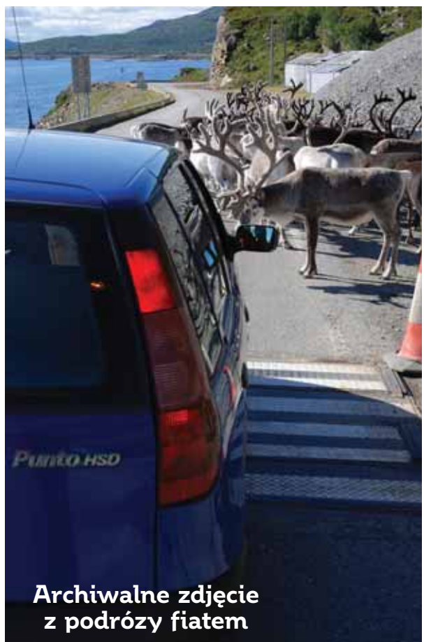
Archiwalne zdjęcie z podróży fiatem