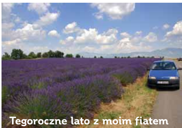
Tegoroczne lato z moim fiatem