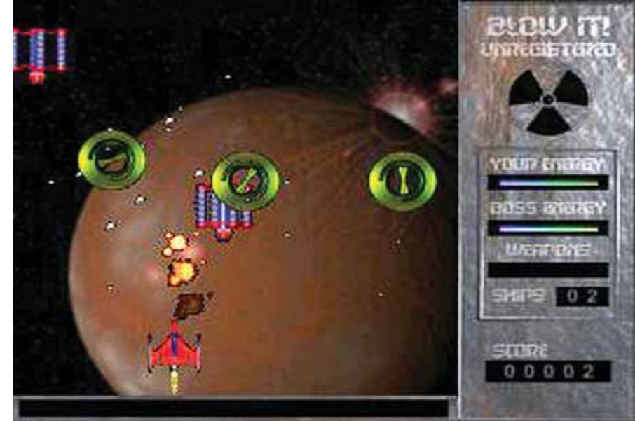
... i ich wyróżniona gra „Blow it”.

– Przed rozpoczęciem jakichkolwiek rozmów o studiach, uczelnie amerykańskie wymagały wpłaty bardzo wysokiego czesnego, a mnie nie było i śmieć powiedzieć, że nadal nie ma, żadnego rozsądnego wydziału zajmującego się grafiką komputerową. Zdecydowałem się rozpocząć studia na Uniwersytecie Śląskim, na kierunku język