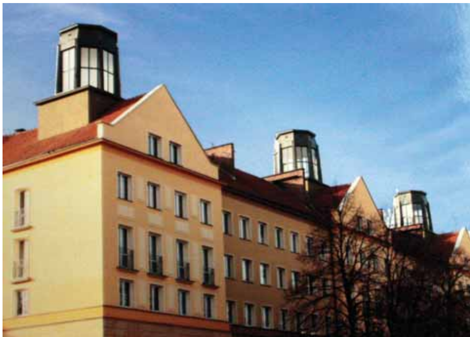
Odnowione budynki przy Placu Baczyńskiego.