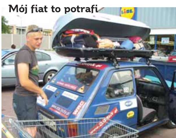
Mój fiat to potrafi