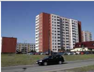
Osiedle „R” zlokalizowane jest z dala od centrum.