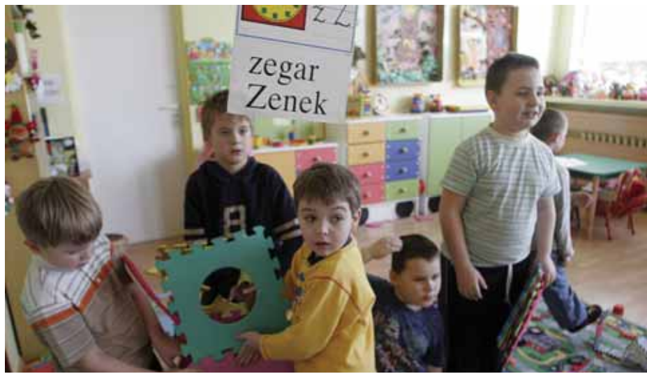
Dzieci, które uczą się w szkolnych zerówkach, mają ułatwiony start w pierwszej klasie.

Do klasy zerowej w podstawówce można zapisać każdego sześciolatka, bez względu na to, czy chodził wcześniej do przedszkola. Zapisy prowadzone są do 31 marca, drogą elektroniczną – przez internet albo metodą tradycyjną – rodzic wypełnia specjalny formularz, który może otrzymać w szkolnym sekretariacie.