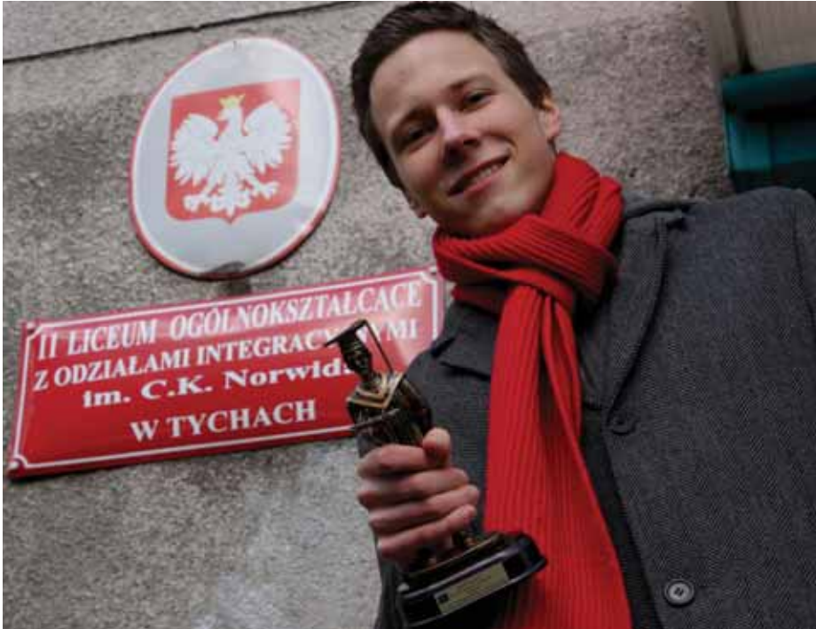
Uczeń II LO w Tychach dzięki sukcesowi w olimpiadzie ma już zapewniony indeks na studia.

Maturzysta znalazł się nie tylko w pierwszej dwudziestce, ale do zwycięstwa zabrakło mu... jednego punktu. – Odpadłem na pytaniu o organ konsultacyjny parlamentu polskiego i europejskiego – mówi.