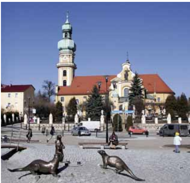
Liście tyskich zabytków otwiera kościół pw. św. Marii Magdaleny.

Innym XVIII-wiecznym obiektem jest zespół zabudowań Huty Paprockiej. Wielo-