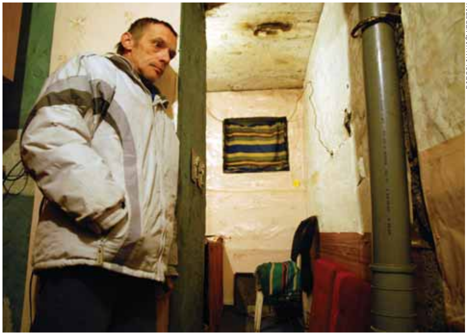
Pan Ernest mieszka w piwnicy od lat i niezależnie od tego czy z własnego wyboru czy nie, coś z tą sytuacją trzeba zrobić.

– Nasza klatka jest po remoncie, ale teraz znowu zrobiło się nieprzyjemnie, bo przychodzą tutaj jacyś podchmieleni mężczyźni, załatwiają się... A ile trzeba, by kto zaproszył ogień w piwnicy? – pyta inny sąsiad.