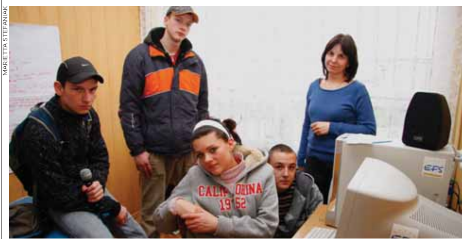
Młodzi radiowcy wypełniają muzyką nudne przerwy.