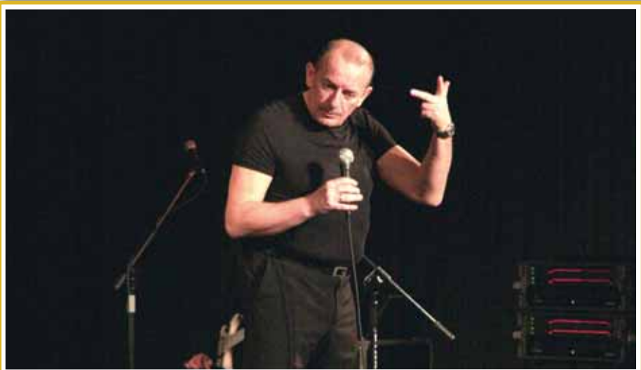
W wypełnionym do ostatniego miejsca Teatrze Małym wystąpił Marcin Daniec, jeden z najbardziej znanych polskich artystów kabaretowych. W przeddzień Dnia Kobiet nie mogło oczywiście zabraknąć skeczu ze specjalnymi życzeniami dla wszystkich tyszanek.