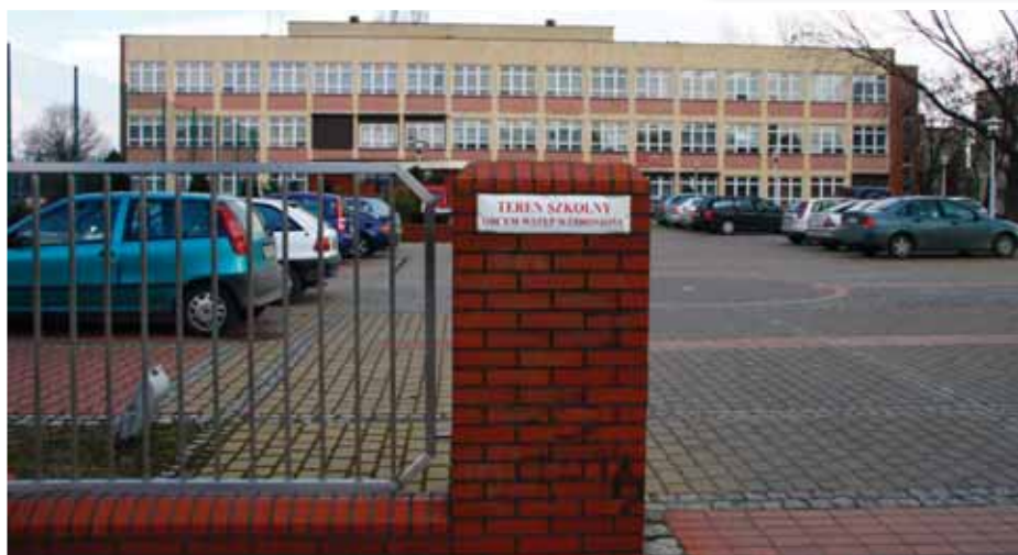
Dzięki wyremontowaniu wejścia do Zespołu Szkół nr 1 szkoła nie tylko ładniej wygląda, poprawiło się także bezpieczeństwo.