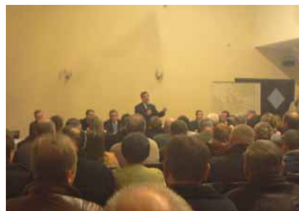
Prezydent Andrzej Dziuba zapewnił mieszkańców, że ich uwagi będą uwzględnione w czasie prac.