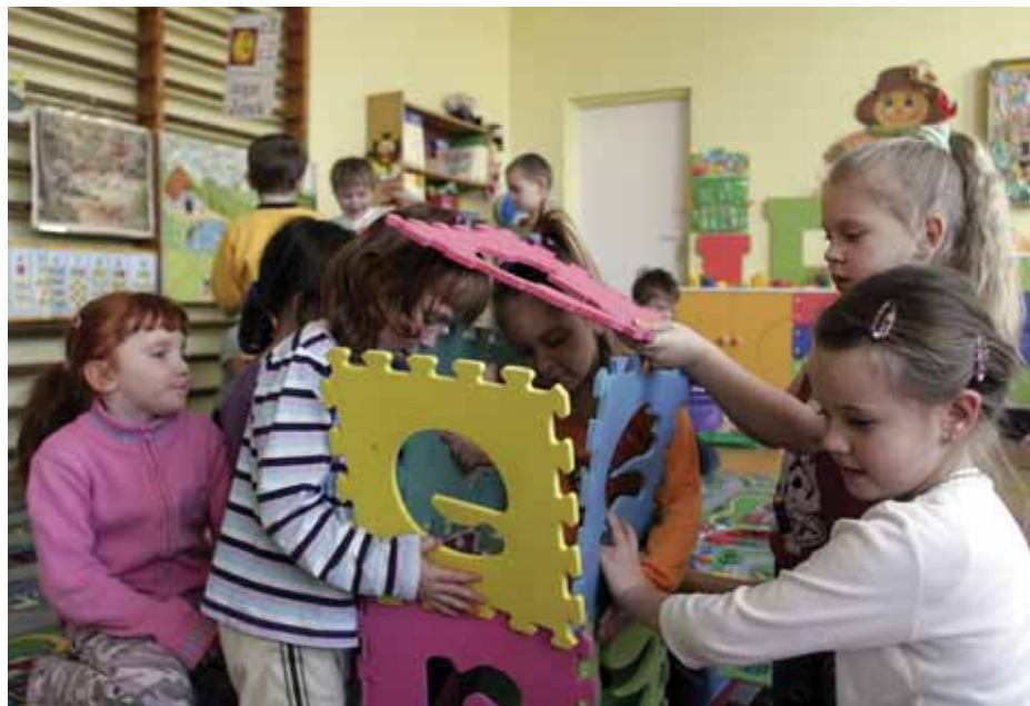
W szkolnej zerówce jest czas na naukę, ale też na zabawę.

Z dala od sal lekcyjnych, ale za to w pobliżu świetlicy, stołówki, biblioteki i pomieszczenia pedagoga.