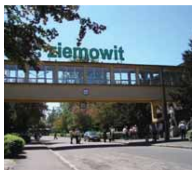
W KWK „Ziemowit” pracuje wielu tysiancy.

roku. Mieszkańcy naszego miasta stanowią 15,7 proc. jej załogi – spośród 4337 zatrudnionych górników 682 to tysiancy. MS