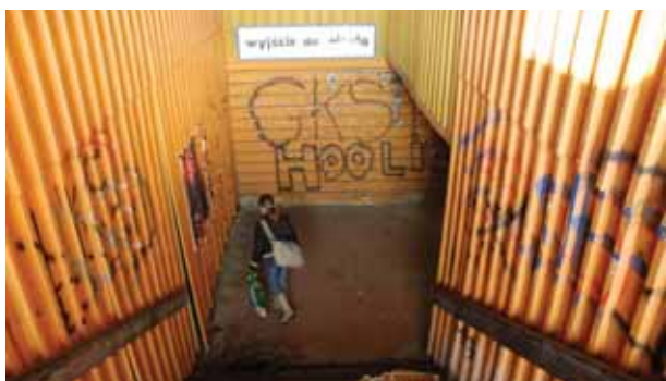
To ma być wizytówka miasta?

W – jak „wyjście do miasta”, czyli napis na ta-