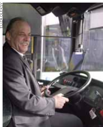
Kabina przypomina pulpit pilota.

Nic dziwnego, że pojazdy (Solaris to polska firma) te można spotkać w 120 miastach w 15 krajach Europy.